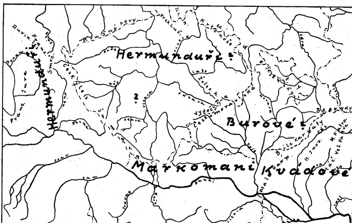
Mapa 3. Mapa osídlení našich zemí po markomanských válkách. 1:3 700 000.