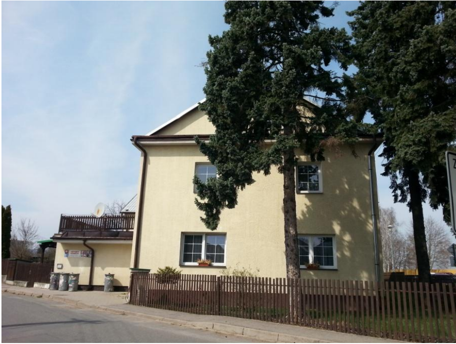
Obrázek č. 1 - Dětský domov Moravská Třebová 1

„Kdyby si děti mohly vybírat své rodiče, ušetřili bychom spoustu rodičů.“