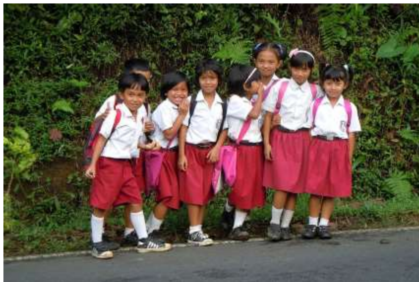
Obrázek č. 5 - Školní uniformy žáků základních škol v Indonésii

Studenti v Indonésii jsou také povinni nosit školní uniformy, které se vzhledem liší podle toho, zda se jedná o základní, či střední školu. Žáci tzv. primary school nosí bílé košile s krátkým rukávem, které doplňují chlapci červenými kraťasy a dívky sukněmi stejné barvy. Jelikož většina populace vyznává v Indonésii islám, výjimku tvoří muslimské dívky, kterým je povoleno nosit dlouhý rukáv, sukni ke kotníkům a šátek zakrývající vlasy. Žáci, kteří pokračují na tzv. middle school , uniformy mění a oblékají stejnokroje v modré a bílé barvě. Dívky i chlapci oblékají bílou košili spolu s modrými kraťasy, či sukní. Povinností každého žáka je mít černé kožené boty s ponožkami, které zakrývají kotníky a černý pásek. Studenti na tzv. high school nosí šedé uniformy s bílými košilemi, ale oproti nižším ročníkům chlapci vymění kraťasy za dlouhé kalhoty. Jakékoliv porušení, či nedodržení pravidel v oblékání uniformy se trestá a učitel má právo poslat studenta v případě nevhodného oblečení domů (Fitriani, 2017).