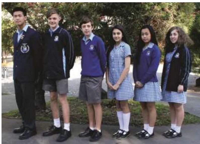
Obrázek č. 4 - Letní a zimní typ školní uniformy v Austrálii

V Austrálii je povinné nošení školních uniforem na většině základních, soukromých všech katolických škol. Díky tomu, že si může každá škola vybrat vlastní design uniformy, volí většinou barvy, které vychází z loga školy. Chlapecká uniforma zahrnuje obvykle košili, šedé kalhoty a kraťasy doplněné podkolenkami (pouze v letních měsících). Některé školy chlapcům umožňují nosit kraťasy jen v mladším věku. Dívky kromě kalhot odívají kostkované, či pruhované šaty, pod kterými nosí halenku. V zimních měsících je uniforma doplněna sakem a kravatou u obou pohlaví. Existují však i školy, kde si dívky mohou vybrat a nosit místo sukně tmavé kalhoty. Co se týče sportovních aktivit, u žáků je vyžadována změna uniformy z klasické na sportovní. Tato souprava obsahuje komfortní polokošili a kraťasy. V rámci posledního ročníku můžeme na ulicích potkat studenty, kteří mají svůj vlastní svetr, či bundu, která představuje jejich závěrečný rok na střední škole (K12 Academics, © 2004).