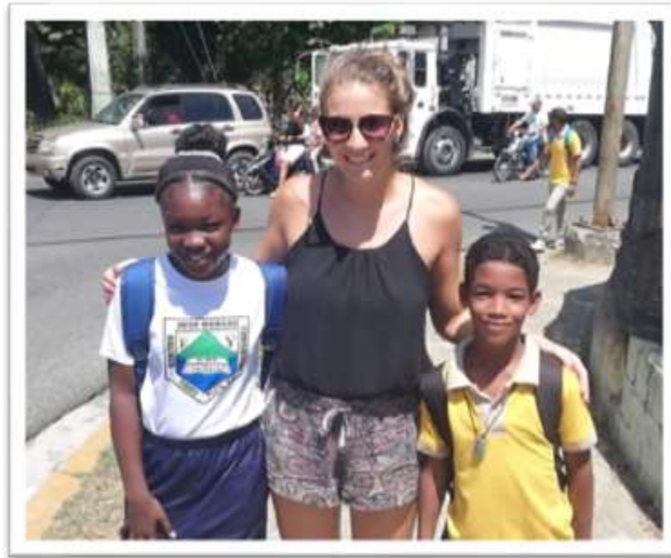
Obrázek č. 1 - Žáci v Dominikánské republicy