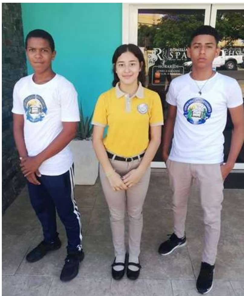
Obrázek č. 13 - Každodenní a sportovní uniforma žáků školy Antera Mota

Z rozhovoru s ředitelem školy Antera Mota v Dominikánské republice jsem se dozvěděla, že školní uniformy na státních školách jsou po žáky povinné. Přímo tato škola má dva typy uniforem, které jsou totožné pro obě pohlaví (liší se pouze střih khaki kalhot). Uniformu, kterou má na obrázku dívka a skládá se ze žluté polokošile a khaki kalhot, slouží pro každodenní nošení. Žáci jsou také povinni doplnit uniformu slušnými černými boty. Žlutá barva košile představuje jednu z pěti oblastí, na které jsou jednotlivé školy v Dominikánské republice rozděleny. Není to barva typická pro jednu školu, nýbrž pro celou oblast. Vlastní uniformu školy představuje pouze bílé tričko s logem, které si škola sama navrhla. Tmavě modré tepláky s bílými pruhy můžeme totiž v Dominikánské republice vidět i na dětech z některých jiných škol. Kombinace bílého trička s logem a modrými tepláky používají žáci v tělesné výchově (chlapec na obrázku č. 13 právě hodinu tělesné výchovy absolvoval). Ředitel školy mi však vysvětlil, že žákům nechává volnost a je na jejich úvaze, zda si obléknou žlutou polokošili, či bílé tričko s khaki kalhoty do běžné výuky. Když jsem řediteli položila otázku, jakou výhodu, či nevýhodu vidí v používání uniforem,