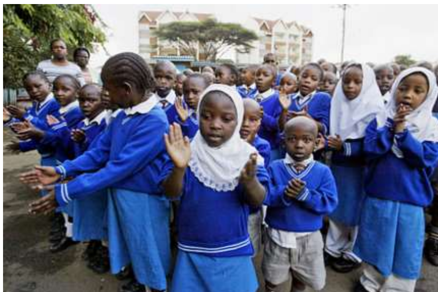
Obrázek č. 2 - Žáci základní školy Kongoni Primary School v Nairobi

Při příchodu nového školního roku obstarávají rodiče v Keni svým dětem školní uniformy, které jsou na státních školách povinné. Rodiče žákům kupují nové uniformy v místních speciálních obchodech, či si je vyměňují s ostatními rodiči a využívají již ty nošené (Dallabrida, 2015, s. 36). Problematiku v Keni však představuje finanční situace rodin a jejich povinnost nové uniformy koupit, či jiným způsobem zajistit. Bohužel řada dětí musí dokonce předčasně ukončit studium, protože školu bez uniformy nesmějí navštěvovat. Některým těmto dětem však pomohl krajský úřad ISC s další místní organizace, která financuje program na podporu dětí v rámci distribuce školních potřeb. Díky činnosti těchto organizací, se počet žáků, kteří studium nemohli dokončit kvůli absenci školní uniformy, snížil téměř o polovinu (Doucette, 2014).