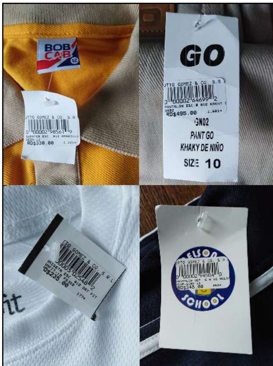
Obrázek č. 14 - Cena jednotlivých částí uniformy školy Antera Mota