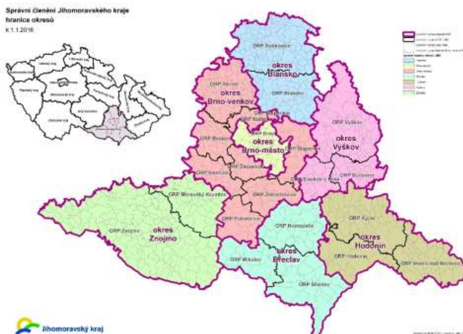
Obrázek č. 12 - Správní členění Jihomoravského kraje

Podle Českého statistického úřadu žilo k datu 31. 12. 2018 v Jihomoravském kraji 1 187 667 obyvatel, což činilo celkem 11,2 % počtu obyvatel České republiky a převažovaly zde ženy. Počet obyvatel ve věku 15 – 64 let se snížil a zároveň došlo k nárůstu obyvatel věkové skupiny 0 – 14 let a skupiny 65 let a starších (Český statistický úřad, 2019).