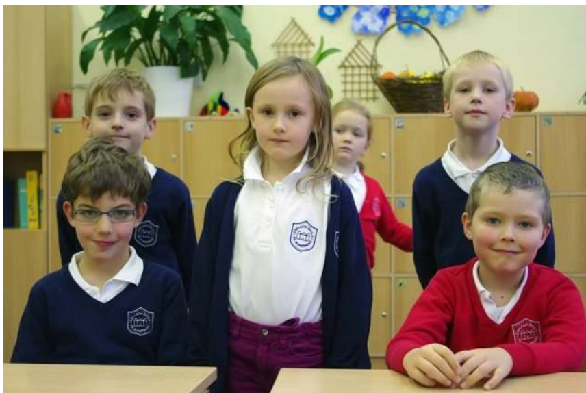
Obrázek č. 6 - Školní uniformy na první státní ZŠ Františky Plamínkové

Základní škola Františky Plamínkové je jedinou státní školou v České republice, kde byly zavedeny od roku 2012 školní uniformy. Tento projekt nejdříve podpořila městská část Praha 7 a uniformy pro prvňáčky z části financovala. Nyní už veškeré náklady na uniformy hradí rodiče žáků. Stejnokroje tvoří tričko, či košili a červený nebo modrý svetr s logem školy. Dívky také mohou využít dva druhy sukní, kalhot, či legín a chlapci zase kalhoty, či džíny. Škola na svých webových stránkách zmiňuje, že materiál pro výrobu uniforem je kvalitní a také uvádí tabulku velikostí a kontakt přímo na pověřenou osobu, která se zabývá objednáváním stejnokrojů (Základní škola Františky Plamínkové).