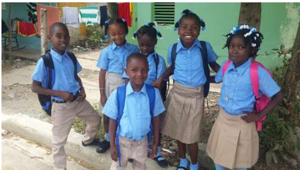
Obrázek č. 9 - Původní uniforma státních škol v Dominikánské republice do roku 2018

Tvar a barva školních uniforem je v Dominikánské republice dána typem školy. Soukromé školy mají vlastní typy školních uniforem, kdežto ty státní jednotné. Do roku 2018 nosili žáci veřejných škol stejnou modrou košili a khaki kalhoty, či sukni na celém území země (Idominicanas, 2017).