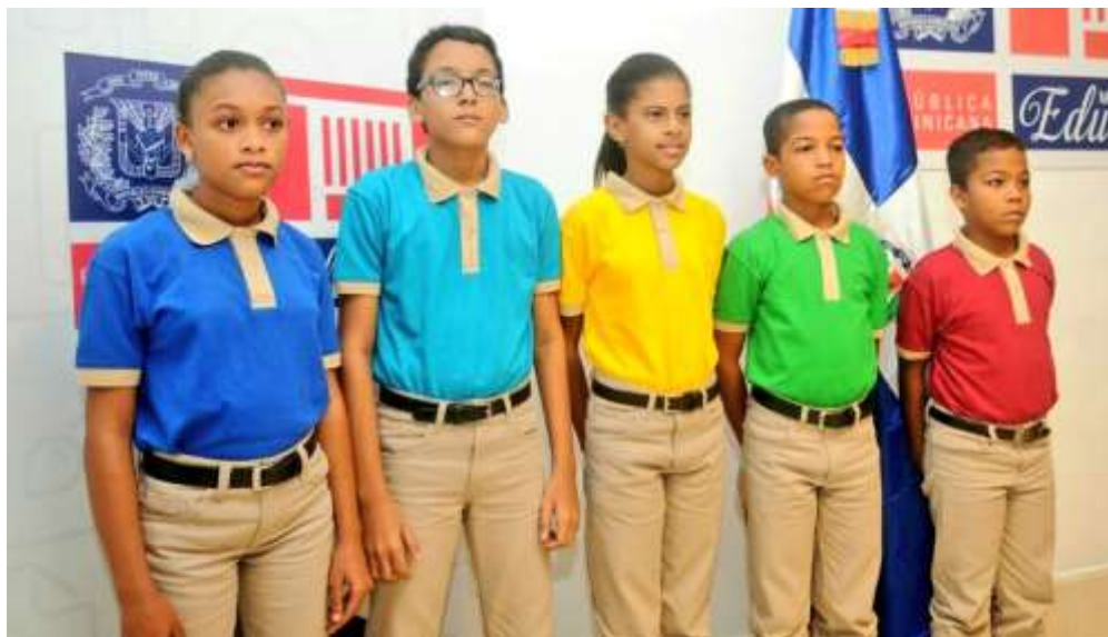
Obrázek č. 10 - Nové barvy školních uniforem pro dané oblasti