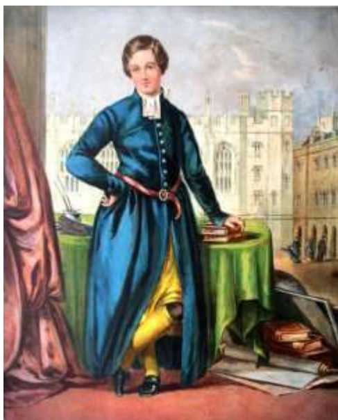
Obrázek č. 11 - První školní uniforma ve škole Christ's Hospital z 16. století

STEPHENSONOVÁ (2016, s. 21-31) uvádí, že první školní uniforma vznikla ve škole Christ's Hospital, která byla založena v 16. století a poskytovala vzdělání sirotkům, či dětem pocházejících z chudých rodin. Jelikož si děti nemohly opatřit oděv, zajistila ho škola. Toto oblečení, které bylo jednotné, je považováno za první školní uniformu. Díky tomu, že každý oděv byl identický, byly náklady na jeho pořízení velmi nízké. Pomocí barev a vzorů rozdělili pohlaví dětí a jejich umístění v určitém ročníku. Stejnokroje obsahovaly dlouhé modré kabáty (přípevněné k pasu), punčochy a košile. Dívky se oblékaly do bavlněných šatů, které doplňoval kabát, a stejně jako chlapci nosily žluté punčochy a košile. Barva punčoch byla žlutá z toho důvodu, že se vedle nemocnice pěstoval šafrán, který posloužil jako žluté barvivo.