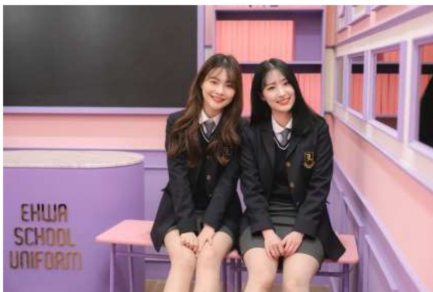
Obrázek č. 3 - Korejské uniformy z obchodu Ehwa school uniform

PARKOVÁ (2015, s. 164-170) uvádí, že školní uniformy v Jižní Koreji začaly vznikat v 19. století a všechny měly velmi podobný vzhled. Jejich design se začal měnit až v roce 1983, kdy bylo Ministerstvem školství dovoleno, že si škola svůj vzhled uniformy mohla navrhnout sama. Dnes se tedy vzhled školní uniformy liší podle dané školy. Nejčastějšími barvami stejnokrojů jsou hnědá, šedá, modrá a bílá. Problémem zde nejčastěji bývá zvolení vhodné velikosti uniformy. Uniforma některých středoškolských studentů je mnohdy záměrně těsná dívky občas volí kratší sukně, než je povoleno. Školy nekontrolují však jenom oblečení, celkovou úpravu zevnějšku. Délka vlasů u chlapců nesmí přesáhnout čtyři centimetry a u obou pohlaví je zákaz jejich barvení a užívání stylingových produktů (gely, laky, vosky a jiné). Dívky se nemohou líčit a společně s chlapci nosit doplňky (dovoleny jsou pouze hodinky).