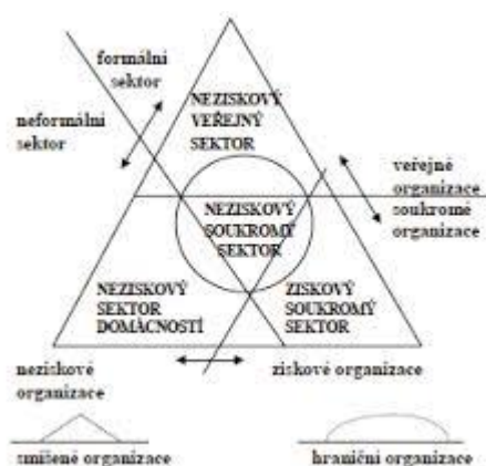
Obrázek 2: Vztahy mezi jednotlivými sektory

Sektor domácností vstupuje na trh produktů i výrobních faktorů a zasahuje do koloběhu financí. Sektor domácnosti má význam pro formování společnosti, čímž zpětně ovlivňuje kvalitu i chod neziskových organizací (Rektořík a kol. 2004, s. 14)