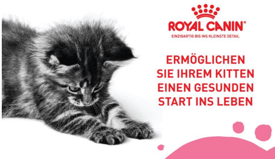
Abbildung 4: Gesund Start ins Leben