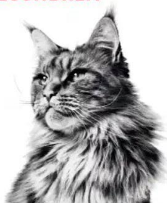
Abbildung 5: Unterstützen Sie die Gesundheit

UNTERSTÜTZEN SIE DIE GESUNDHEIT IHRER KATZE MIT MAßGESCHNEIDERTER NAHRUNG