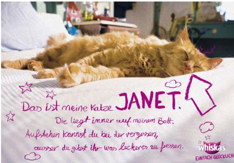
Abbildung 2: Meine Katze Janet