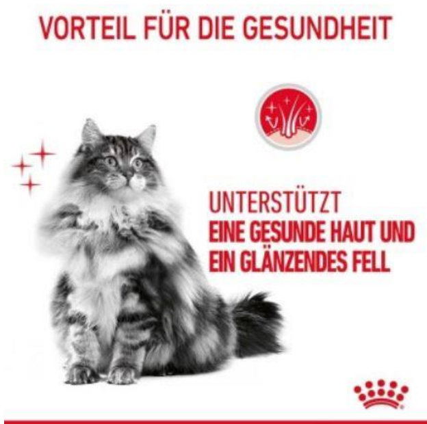
Abbildung 6: Vorteil für die Gesundheit