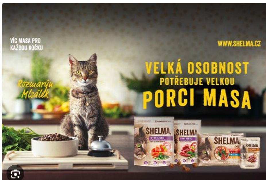
Abbildung 9: „Rozmarýn Měsálek“