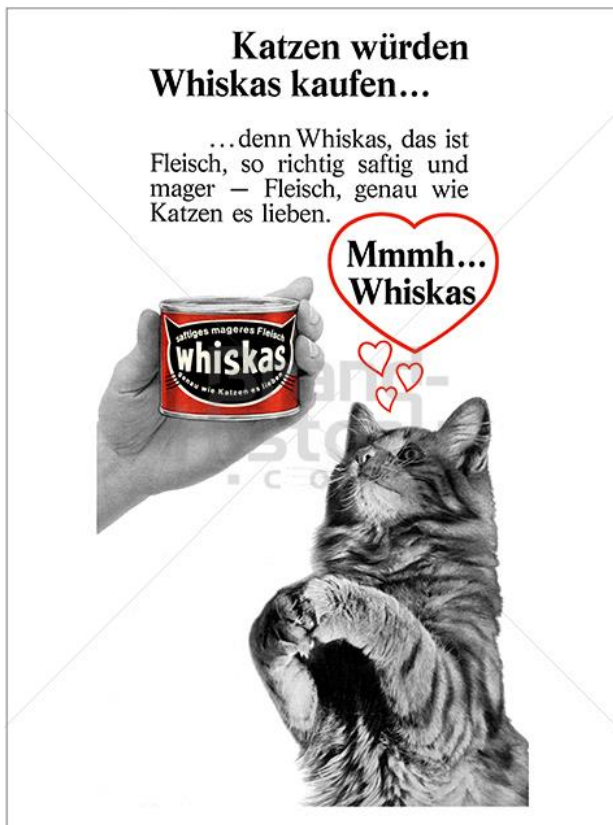
Abbildung 3: Katzen würden Whiskas kaufen