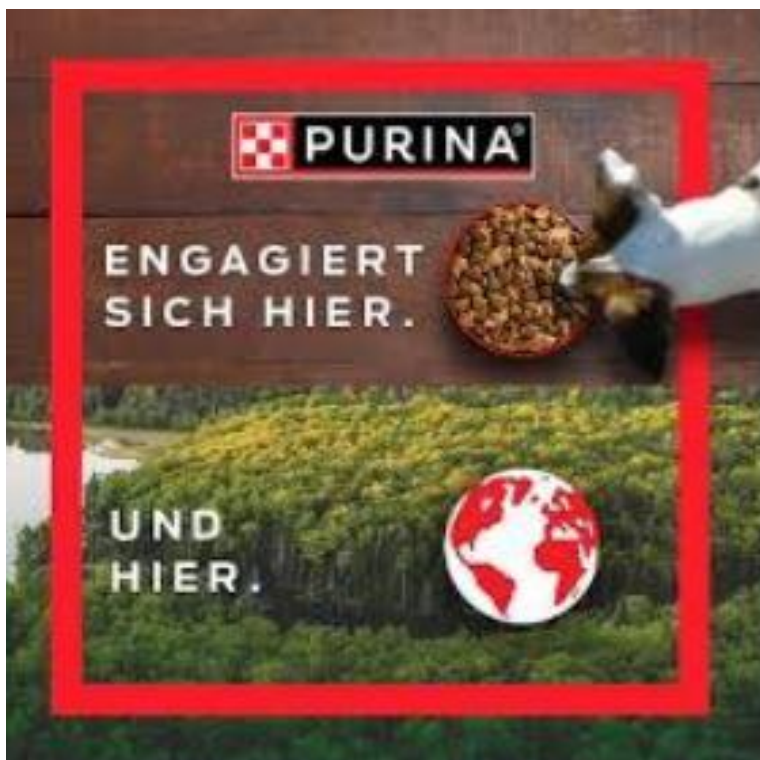
Abbildung 10: Engagiert sich hier