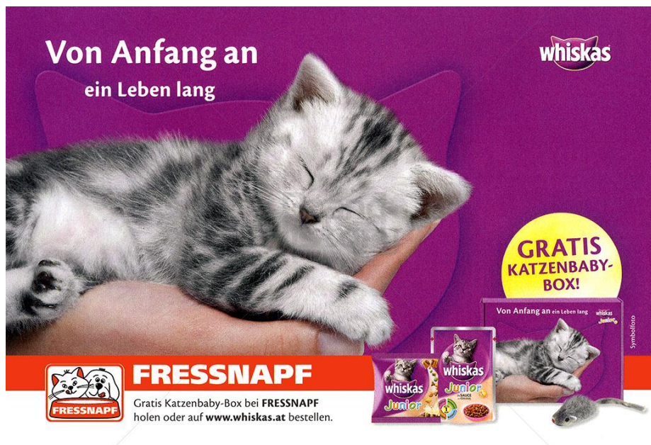
Abbildung 1: Von Anfang an ein Leben lang