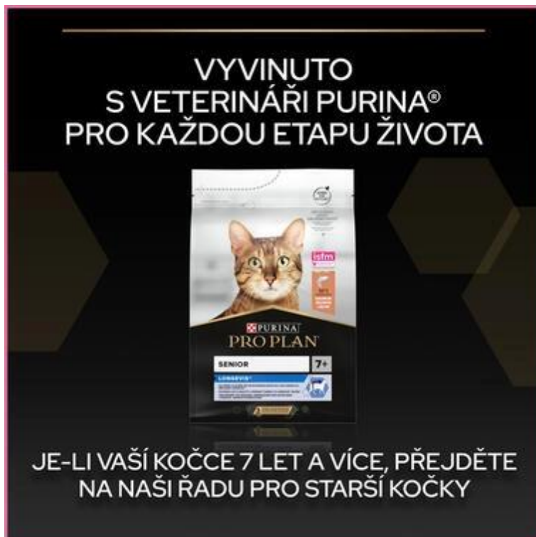
Abbildung 12: Entwickelt mit Tierärzten von Purina 28