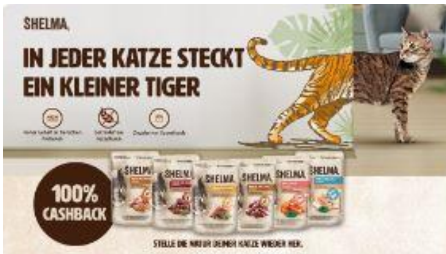
Abbildung 7: In jeder Katze steckt ein kleiner Tiger