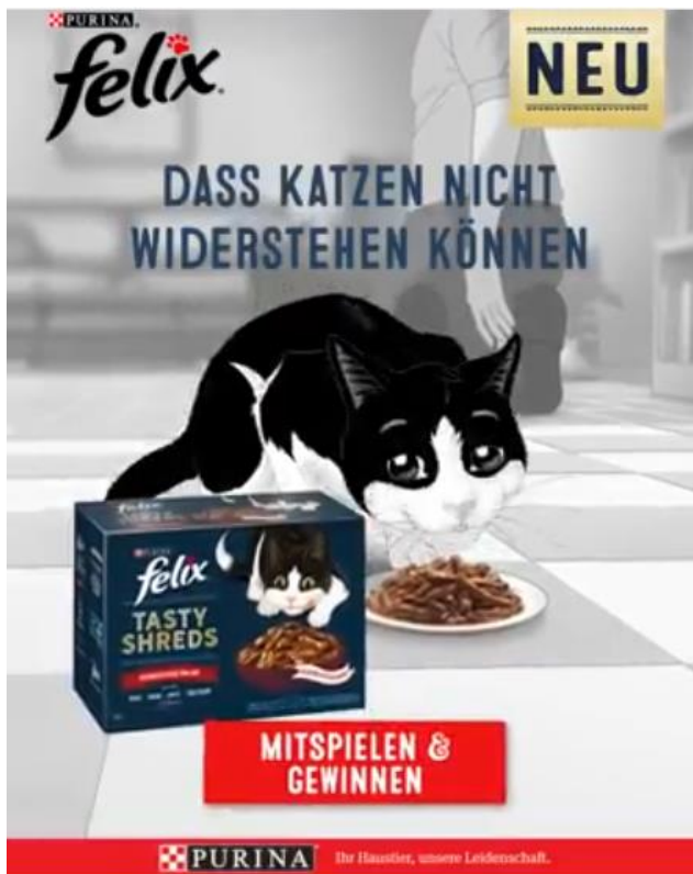
Abbildung 11: Dass Katzen nicht widerstehen können