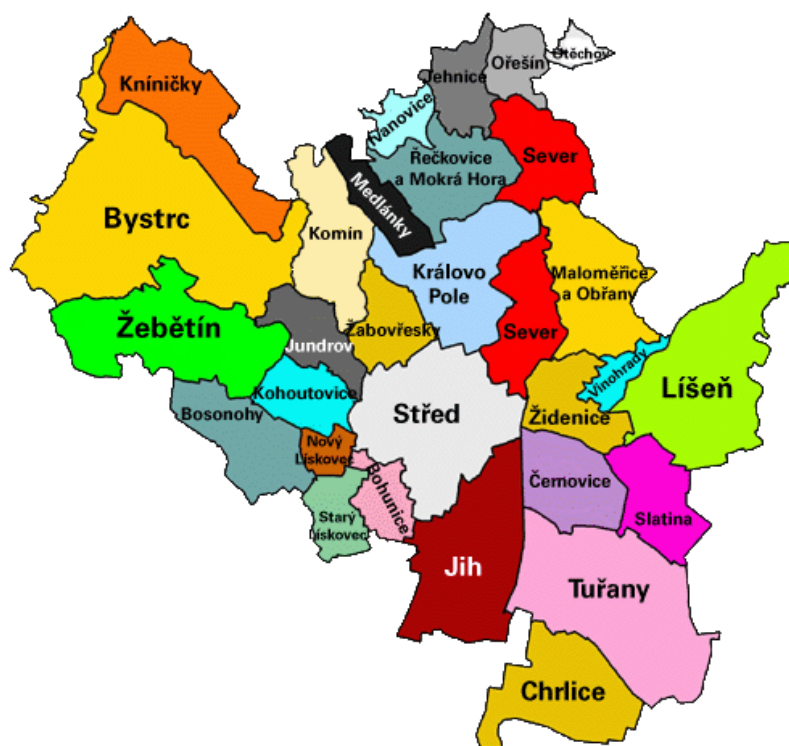
Obr. 1 Městské části Statutárního města Brna