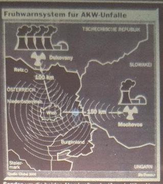
Sonden um die balden Atomkraftwerke Eosin in Wien Alarm aus - ein Zeitvorsprung von mehreren Stunden.

struktur und auch usprojekte. wurden 2001 Projekte Investitionsvolumen Millionen Schilling ge- reichen von der Er- einen Sommerfische- in Kolonpark Kamp- die Errichtung eines lungs- und Nahver- entrums in Waidho- mit etwa 200 Arbeits- bis hin zur Errichtung derzentren in Krems brunn. mögliche Schwerpunkte ill bei der Enquete In- a in den Bereichen gie, Gewerbe, Land- und Tourismus, aber Fortbildungsmaßnah- müsse es als Chance neuen Aufbruch be- weinen es keine Grenzen nen mehr gebe, betonte ehauptmann. nahme durch VP g. Hans Muzik warf Chef in einer Reaktion Ankündigung einen en Vereinnehmungs- er. Das Finanz- des Landes entspringe emeinsamen Initiative D und OVP, über die eige verhandelt habe. erzte Muzik konkrete lungen mit Bund und die Förderungen.