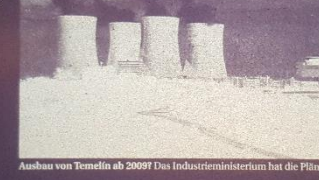
Ausbau von Temelin ab 2009? Das Industrieministerium hat die Pläne nun präzisiert.