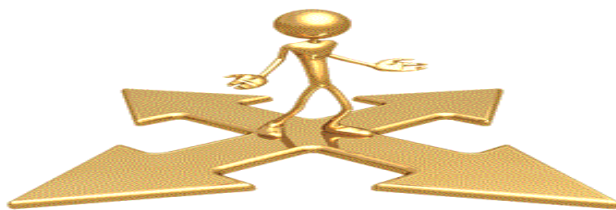
Obrázek 2 Koučování

Zdroj: BUSINESS DEVELOPMENT: Coaching. 50 [cit. 2010-12-29]. Dostupné z WWW: < http://www.gabrielcollignon.com/business-development/ >