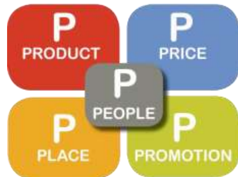
Obr. 2: Model 5P (Efrhymios, 2006, s. 45)