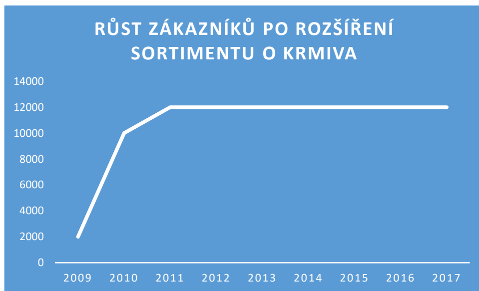
Graf 1: Růst zákazníků po rozšíření sortimentu o krmiva

Během roku 2009 měla firma kolem 2 000 zákazníků. Od roku 2012, kdy podnik rozšířil distribuci o krmivo, stoupl počet zákazníků o více jak 10 000.