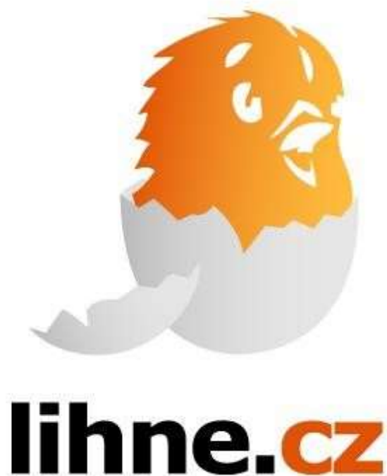
Příloha 2: Leták firmy