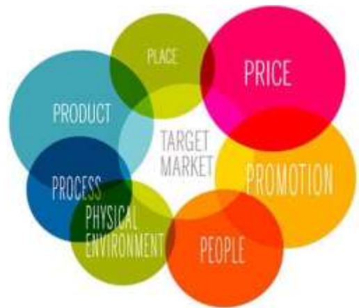
Obr. 3: Model 7P (Efthymios, 2006, s. 407)

Dle mého názoru jde v modelu 4P pouze o základní prvky, jelikož služba samotná je nehmotný produkt, lidé se často setkávají s poskytovateli, navštěvují prostředí, ve kterém se služby poskytují a tím pádem jsou sami svědky procesů poskytování služeb. Proto musíme vzít v potaz všech 7 faktorů, které mohou zákazníka ať už pozitivně či negativně ovlivnit.