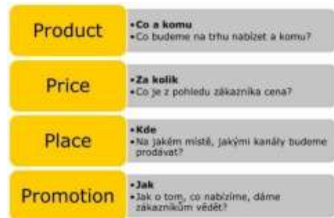
Obr. 1: Model 4P (Efrhymios, 2006, s. 40)