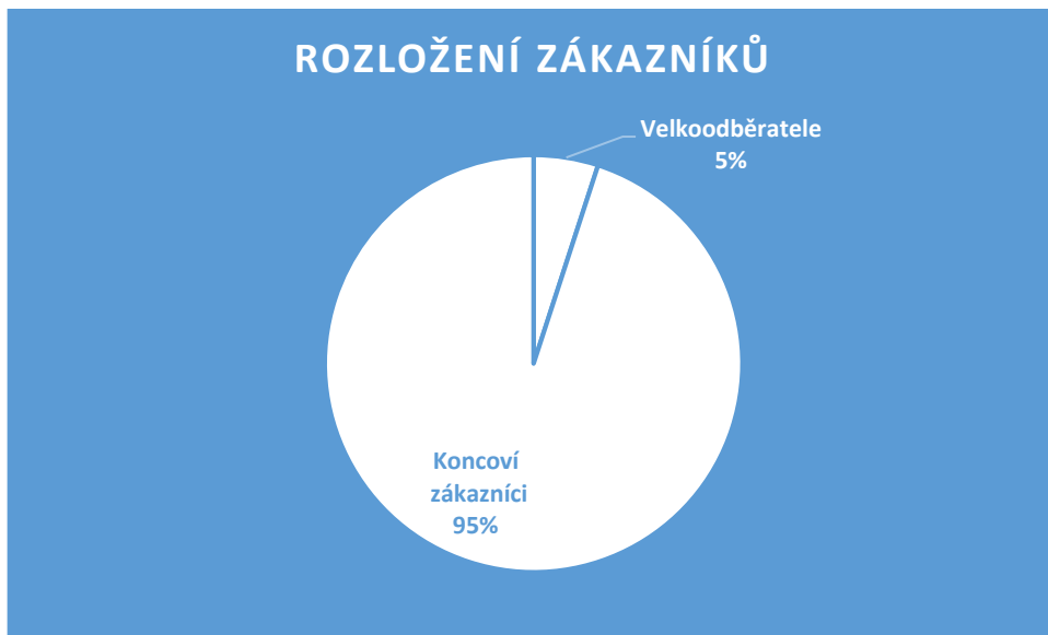
Graf 3: Rozložení zákazníků

Těchto 5 % dále tvoří z 80 % samostatné prodejny. Na jednom pytli krmiva je o 20 % větší zisk od koncového zákazníka než od velkoodběratele.