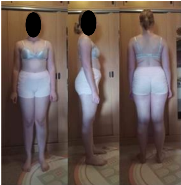
Obrázek 10. Vstupní vyšetření – probandka č. 3.