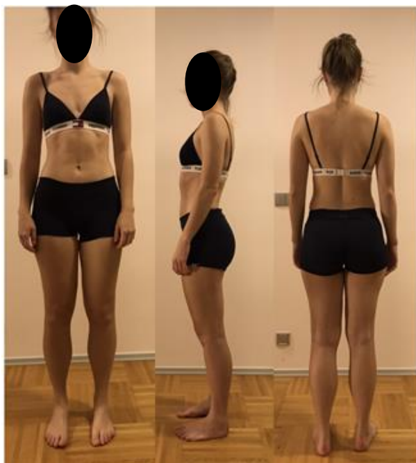
Obrázek 8. Vstupní vyšetření – probandka č. 2.