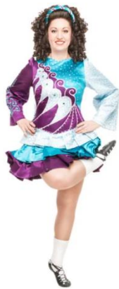
Obrázek 1. Soutěžní šaty.

Dnes jsou soutěžní šaty navrženy podle individuálního vkusu tanečnicků (Obrázek 1). Každý kus je jedinečný barvou, vzorem i materiálem, aby tanečníci vyčnívali z davu. Výšivky, které vyšly z módy, dnes nahradily mnohem populárnější třpytky a umělé diamanty. Kromě šatů nosí tanečnice také kudrnaté paruky s čelenkami, součástí je i výrazný make-up. Muži v současnosti nosí častěji místo kiltu dlouhé černé kalhoty s vyšíváním kabátem či sakem (Pask, 2022).