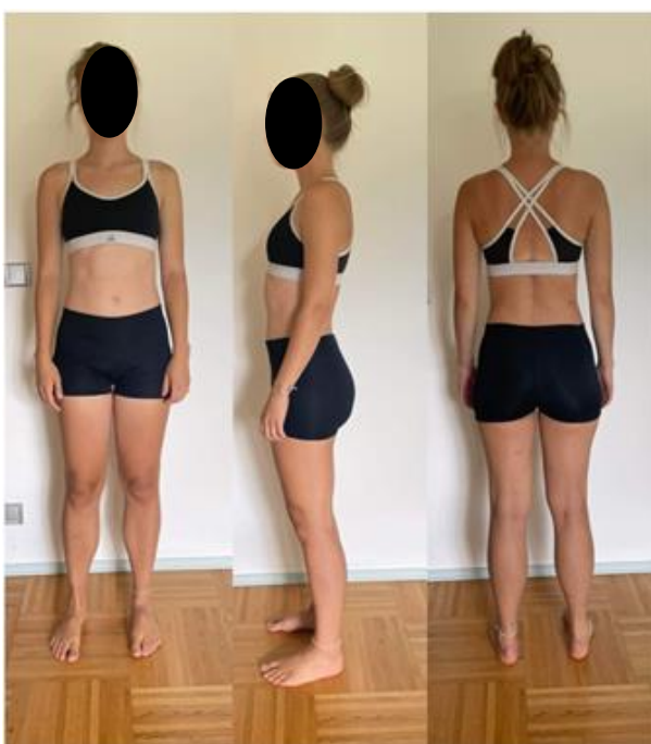
Obrázek 9. Výstupní vyšetření – probandka č. 2. Zdroj: vlastní.