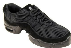
Obrázek 4. Tréninková obuv.