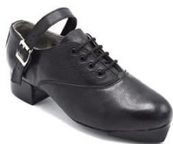
Obrázek 3. Tvrdá obuv.

Tvrdé boty (Obrázek 3) jsou někdy nazývané také jako jigové nebo hornpipové. Tanečníci jsou díky těmto botám schopni používat nohy jako nástroj k vyluzování zvuků (Luther Burbank Center for the Arts, 2019). Jsou podobné stepařským botám, ale špičky a podpatky (nazývané jako steps ) jsou vyrobeny ze skelných vláken namísto kovu a jsou podstatně objemnější. První steps byly vyrobeny též z kovu, ale postupem času se začaly vyrábět z pryskyřice nebo skelných vláken, aby se snížila hmotnost a zvuk byl hlasitější (Pask, 2022). Typický tvar boty je nejlépe vidět při pohledu z boku. V oblasti paty bývá podpatek vysoký kolem 3-4 cm. Od paty klesá podrážka lehce směrem dolů, odkud se směrem ke špičce zase zvedá. Zesponu špičky boty, zhruba v délce prstů, je také destička ze skelných vláken připomínající podpatek, jen o něco nižší, vysoká 1-2 cm. Tvar boty tak navádí chodidlo do nepřirozené polohy půloblouku směrem dolů. Podrážka boty je kožená, pružná, boty se zavazují tkaničkami, upevňují se řemínkem, jako doplněk se zejména na soutěžích používá ozdobná přezka přes tkaničky (Luther Burbank Center for the Arts, 2019).