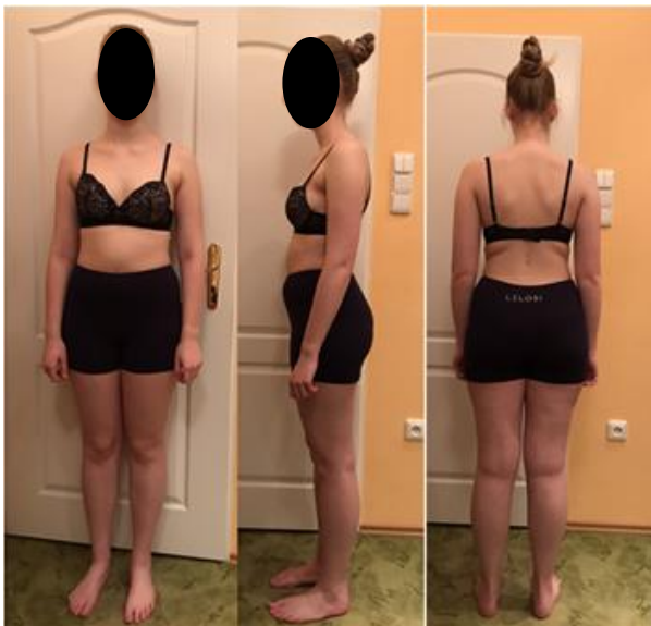
Obrázek 11. Výstupní vyšetření – probandka č. 3.