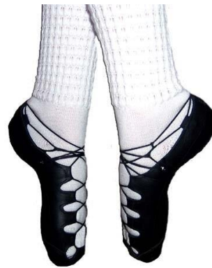
Obrázek 2. Ghillies.