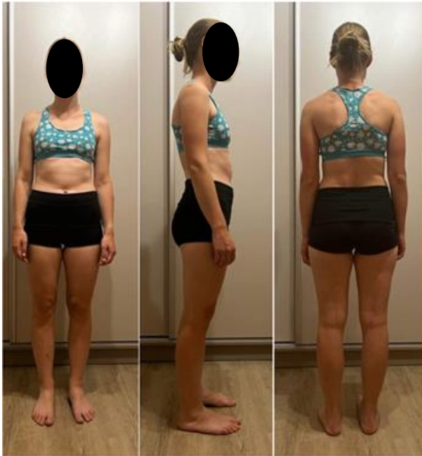
Obrázek 6. Vstupní vyšetření – probandka č. 1.