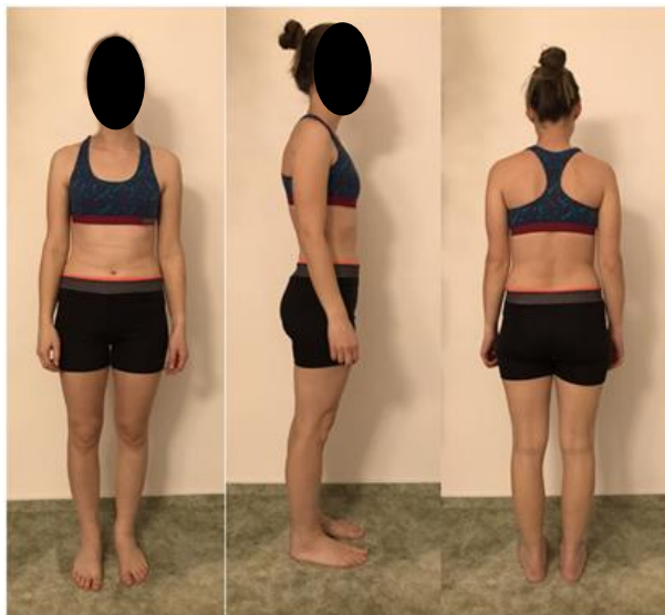
Obrázek 7. Výstupní vyšetření – probandka č. 1.