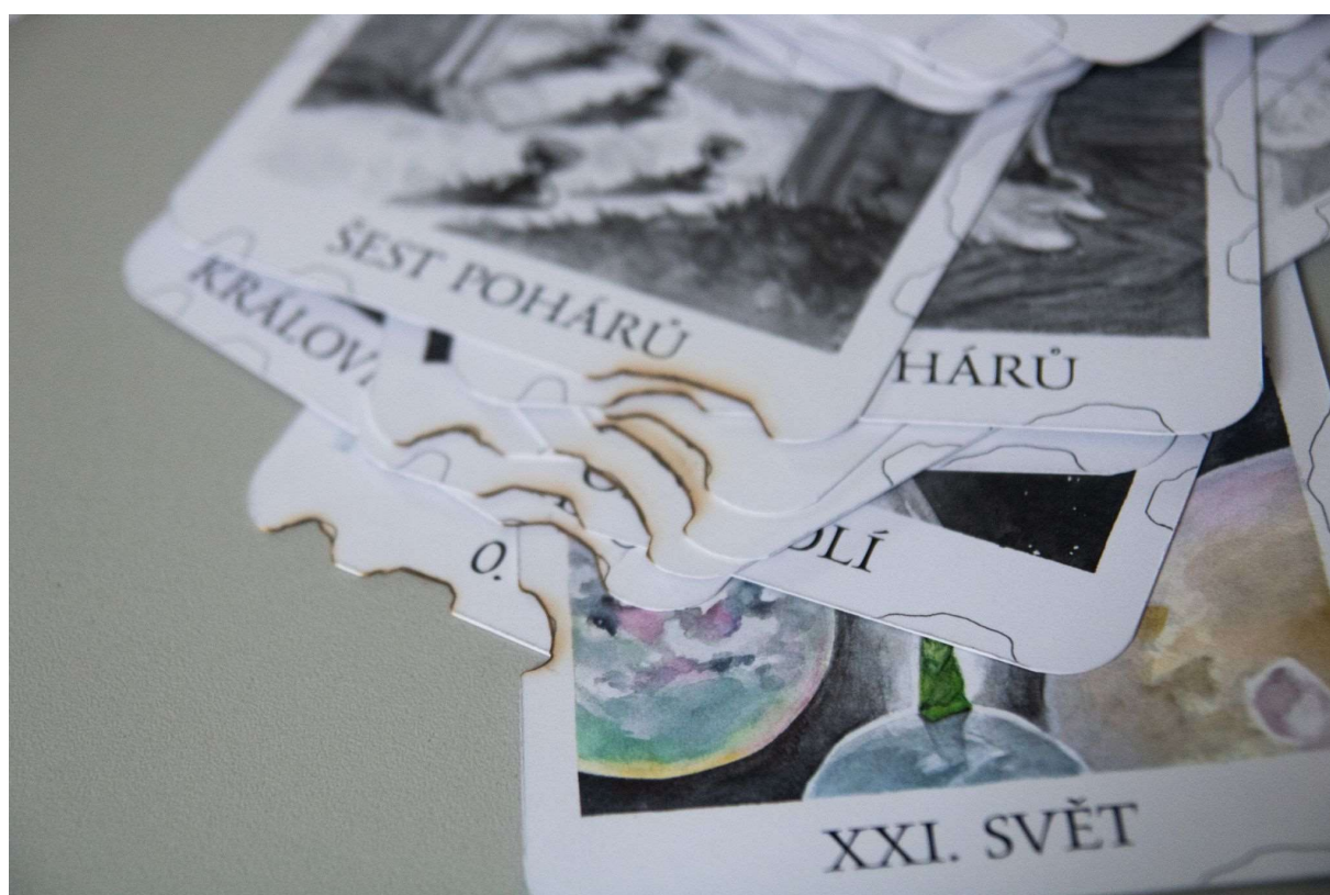
Příklad opálených karet podle šablony z verze 2, 2023