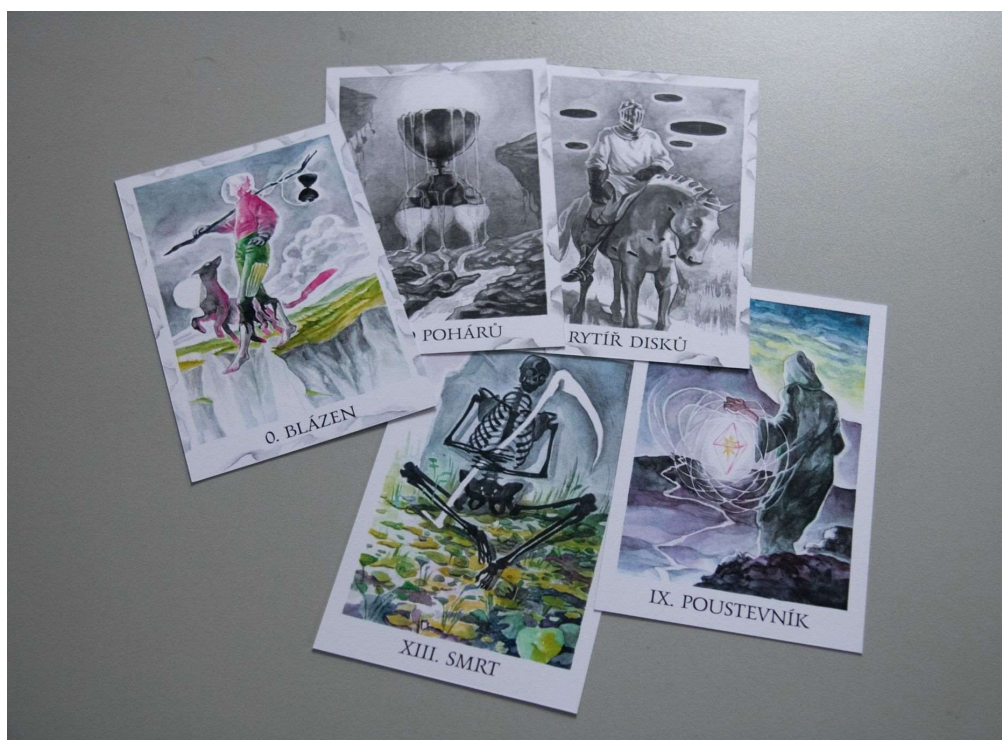
Verze 3 - líce se šablonami pro opalování karet. 0. Blázen, Eso pohárů, Rytíř disků, XIII. Smrt a IX. Poustevník, 2023