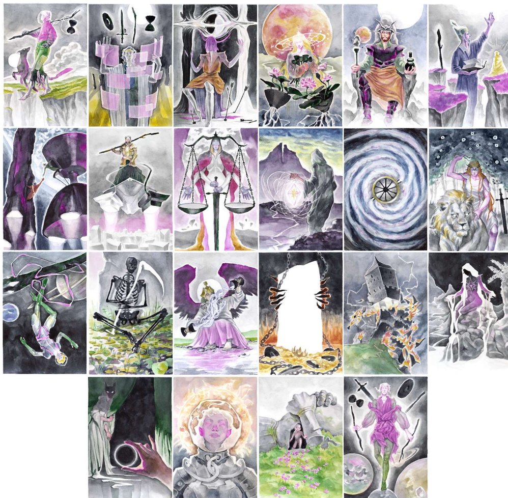
Skeny Ilustrací karet Velké arkány, akvarel na papíře, originální rozměr 14.8. x 21 cm, po digitální úpravě, 2023.