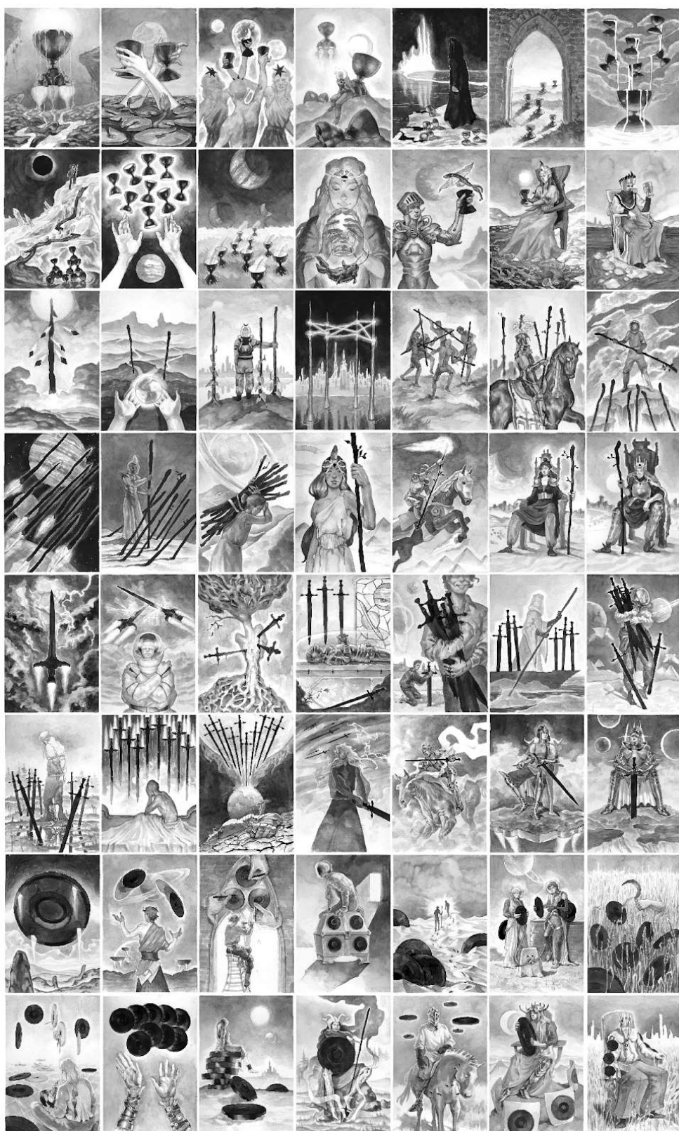
Skeny Ilustrací karet Malé arkány, akvarel na papíře, originální rozměr 14.8. x 21 cm, po digitální úpravě, 2023.