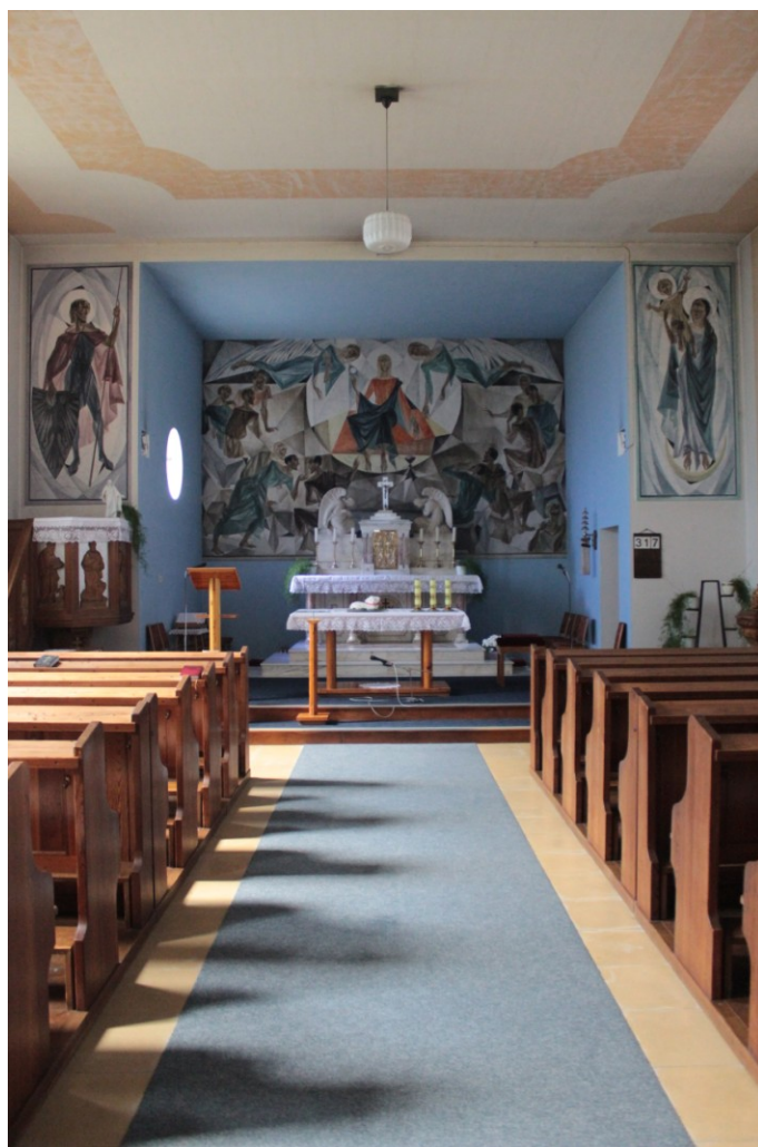
Obr. 7. Interiér kostela sv. Václava s freskami L. Kolka.