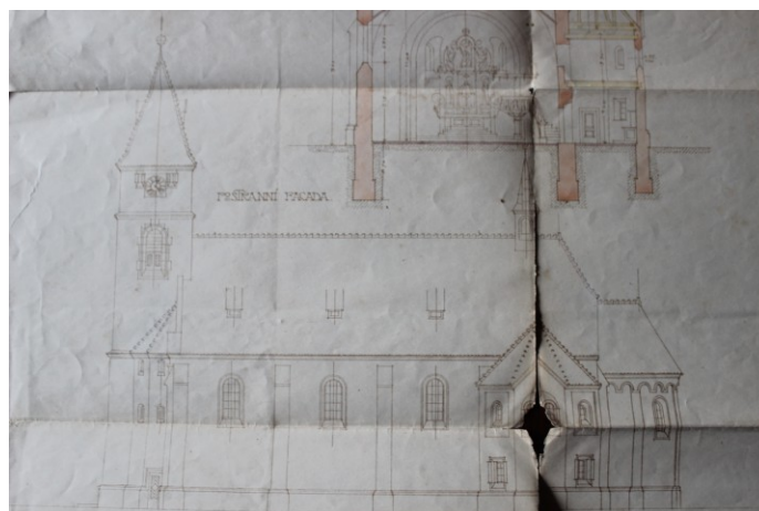
Obr. 4. Výsek z plánů J. Blažka z r. 1909.