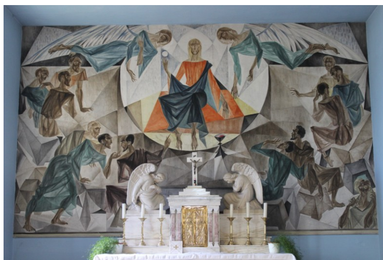
Obr. 8. Svatostánek a freska Poslední večeře.