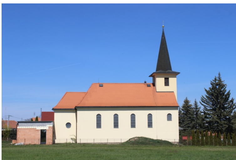
Obr. 6. Boční pohled na kostel sv. Václava s realizovanou přístavbou.