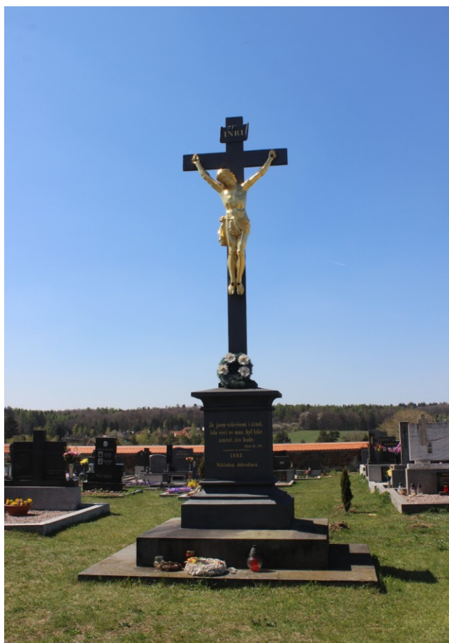
Obr. 1. Hřbitovní litinový kříž z r. 1894.