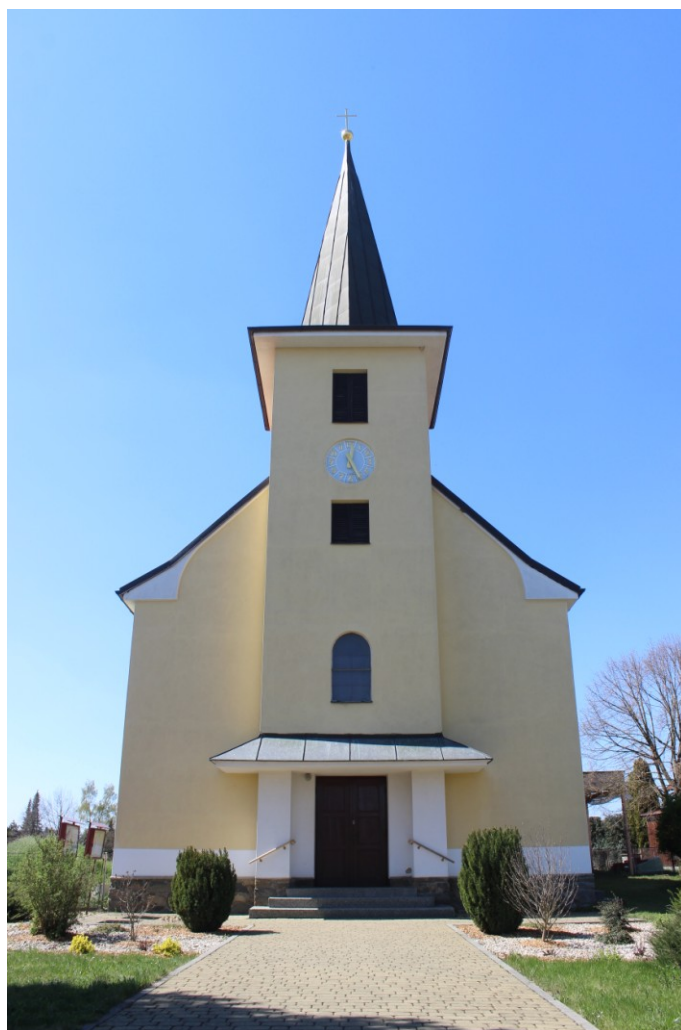
Obr. 5. Průčelí kostela sv. Václava v Ruprechtově.