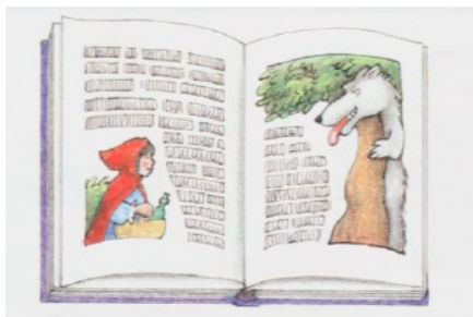
Obrázek 2: Little Red Riding Hood

Druhý případ na s. 13 je však typickým příkladem ilustrace, která překladateli může „svázat ruce“. Viola čte paní Velké z knížky, která je u textu vyobrazená a jednoznačně odpovídá titulu uvedenému v textu: Little Red Riding Hood . Tato konkrétní situace má jednoduché řešení, protože pohádka je v obou kulturách dobře známá a není problém použít český název. V opačném případě by ale překladatel musel hledat kreativnější východiska.