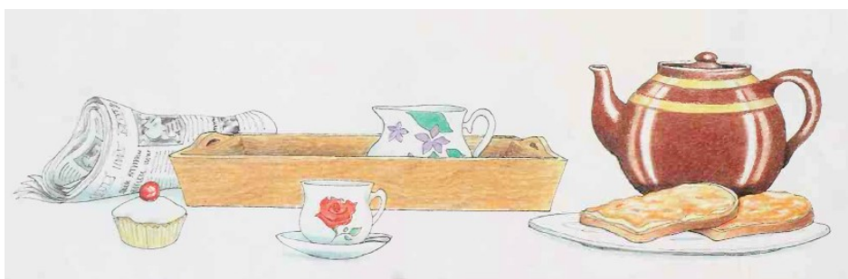
Obrázek 1: Cake

Nejméně vhodné protějšky jsou dort a koláček , protože pod nimi si český čtenář představí něco zcela jiného. Zákusek by se použít dal a díky své konotaci by možná v rukou slonice vyvolával podobné pobavení jako křehký šálek čaje, je ale zbytečně generalizující a pro dětského čtenáře jaksi odtažitý. Nejpřesněji obrázku odpovídá výraz cupcake , který by stejně jako muffin děti patrně znaly; u těchto slov ale vyvstává otázka transkripce do češtiny ( kapkejk, mafin ). Zvolila bych výraz muffin , protože obrázku odpovídá lépe než dortík a v české kultuře je už zcela běžný; cupcake jen v menší míře. Slovo bych nepočesťovala, protože se převážně používá v originálním tvaru a v případě, že by si dítě knihu četlo samo, mu nebude způsobovat velké potíže.