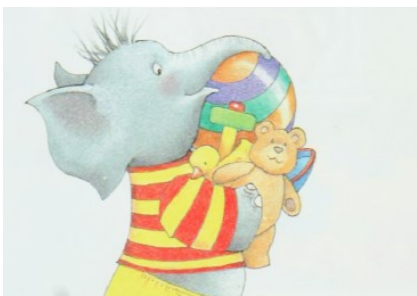
Obrázek 6: Trunkful

Matoucí by bez ilustrací (a tedy informace, že se jedná o slony), mohl být i výraz trunkful , kde přinese malý sloník paní Velké plný chobot hraček. Se slovníkem, ale bez vizuální podpory, by mohl překladatel trunkful snadno interpretovat jako plnou bednu , truhlu či kufř . I když ale význam odhalí, není toto slovo snadné uspokojivě přeložit. Jako základ pro překlad se nabízí české plná náruč , když se ale převede na přišel [...] s plným chobotem hraček , může čtenáři v první chvíli podsunout nepříjemnou představu, že má slon rýmu. Tomuto problému může pomoci výměna dvou slov: přišel [...] s chobotem plným hraček . Jinou možností je slovo opsat: přišel [...] a v chobotu nesl spoustu (hromadu, náklad) hraček . Tato varianta však narušuje spád věty, proto bych zvolila poměrně uspokojivou možnost přišel [...] s chobotem plným hraček .