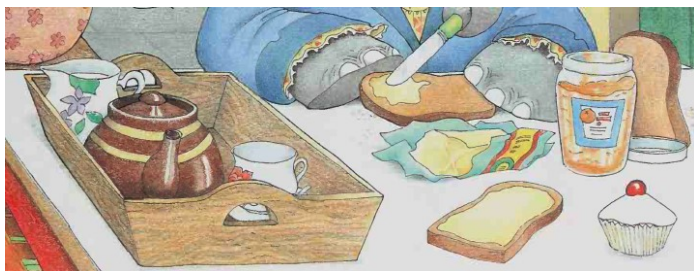
Obrázek 3: Toast

Zde je zmíněn i vyobrazen a plate of marmalade toast . Protože toast je v Británii ekvivalentem českého chleba, bez obrázku by možná překladatel zvažoval, zda výraz domestikovat např. jako pár krajíců chleba s marmeládou . Pro tento typ chleba, toustový chléb, se ale i v češtině používá slovo toast , nikoli chleba (chléb) . V tomto případě bych k transkripci do češtiny přistoupila ( toust ).