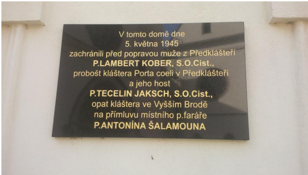
Obrázek 4-Pamětní deska na Podhoráckém muzeu.