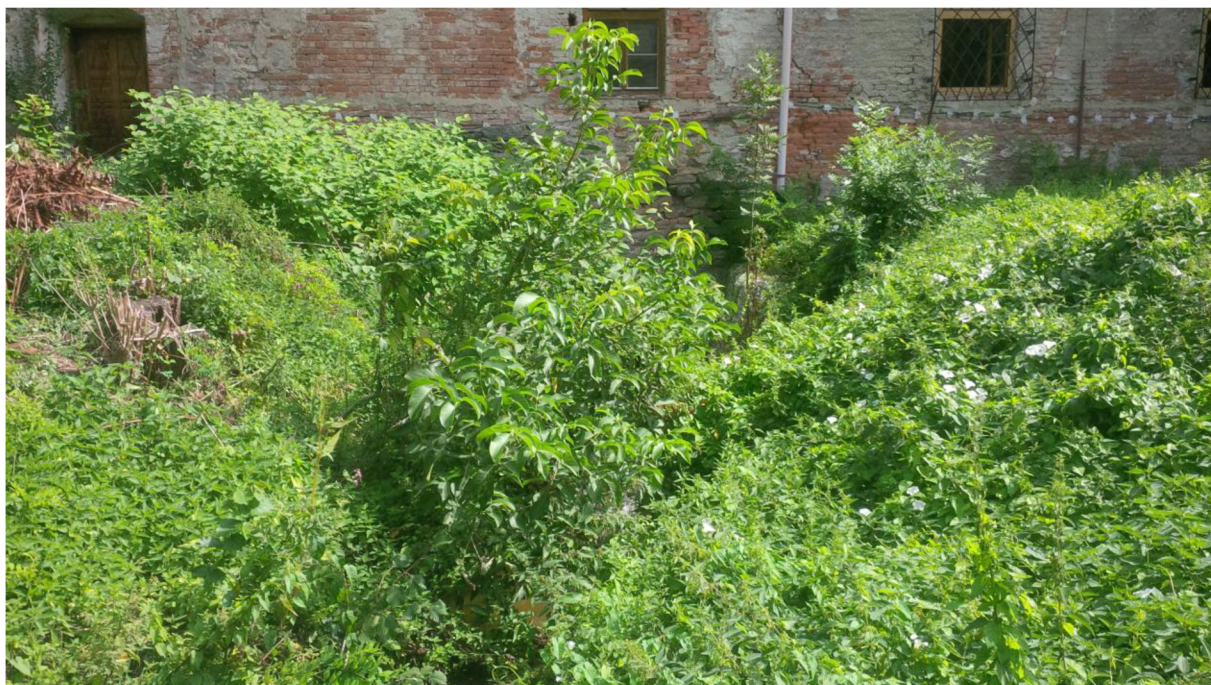
Obrázek 1-Zarostlá část náhonu v zahradách.

Cisterciácké hospodářství je jistě jedním z důvodů, proč se řád stal tak populárním ve vrcholném středověku. Kláštery se stavěli na nehostinných místech, nejčastěji v údolí a v bažinách. Kláštery pomocí systému odvodu vody pomalu vysoušeli neúrodnou krajin. Náhon byl tedy součástí každého kláštera. Zajišťoval jak již zmíněné vysoušení, tak často i klášter zásoboval pitnou vodou. Vede tedy často prostředkem klášterního komplexu, i když v Předklášteří tak tomu vždy nebylo. Po zrušení kláštera Josefem II., byl klášterní náhon odkloněn od své původní dráhy pro potřeby textilky. Po návratu sester do Předklášteří bylo tedy nutné vrátit náhon do původního koryta. Toto koryto bylo částečně i nedávno zrekonstruováno, a i když je jeho většina dnes již skrytá pod zemí, jedna část v zahradách je stále odkrytá a další část která se nachází před kaplí je chráněná kovovou mříží. Náhon jako takový nebyl jediným zdrojem vody pro klášter a hospodářství. Klášter měl i svůj vlastní vodovod. Vodojem se nacházel naproti staré cihelně, za sýpkami a chaloupkami.