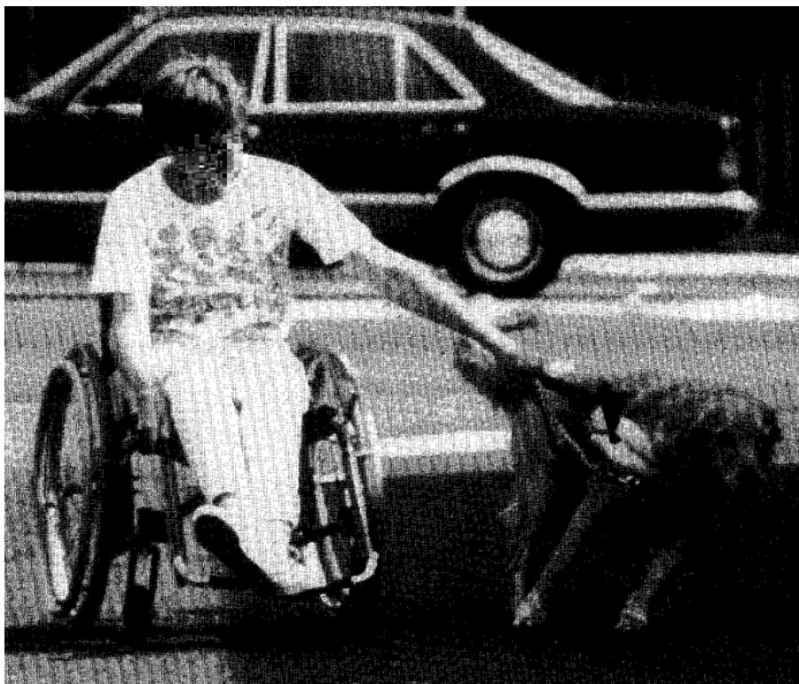
Obr. č. 2 Asistenční pes na obrázku táhne osobu na invalidním vozíku do strany, respektive jiným směrem, než chce osoba jet. To způsobilo přetočení postroje a zařezávání nevypolstrovaných částí postroje do oblasti ramen psa (Coppinger et al. 1998)