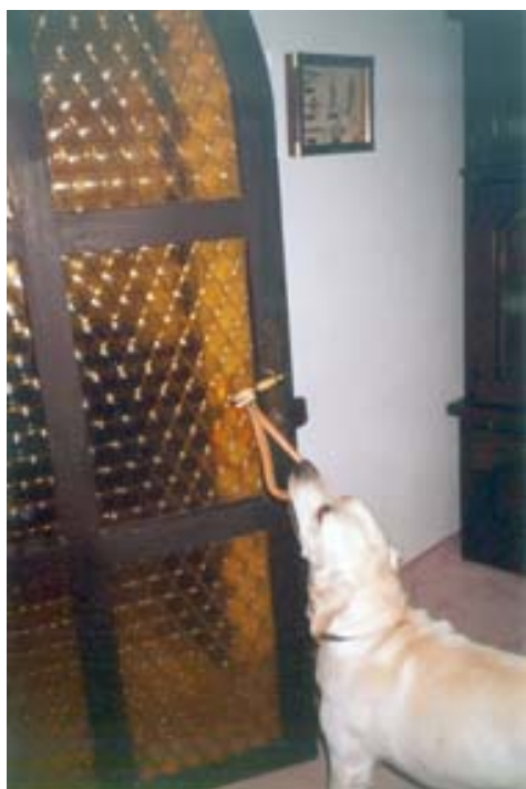
Obr. č. 1 Asistenční pes při otevírání dveří http://www.pes-pomuze.com/asistencni_pes.html