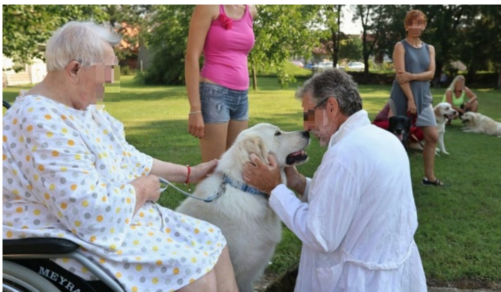
Obr. č. 5 Testování reakce psa na upřený pohled do očí v blízkém kontaktu s cizí osobou https://www.canis-sdruzeni.cz/canisterapeuticke-zkousky