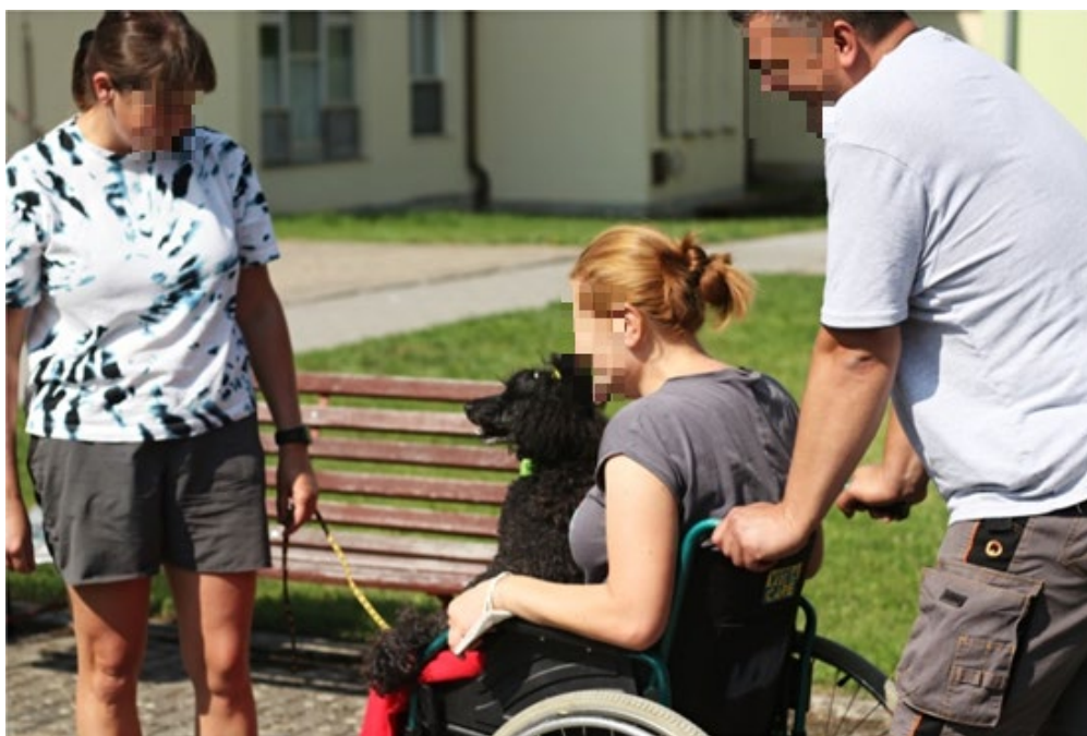
Obr. č. 6 Zkouška, zdali pes v klidu setrvá na klíně klienta na invalidním vozíku https://www.canis-sdruzeni.cz/vysledky-ct-zkousek/item/176-vysledky-zkousek-valtice-a-podzimni-zidlochovice