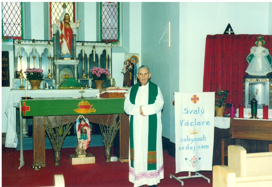
16) Návštěva krajanů v USA, 1990