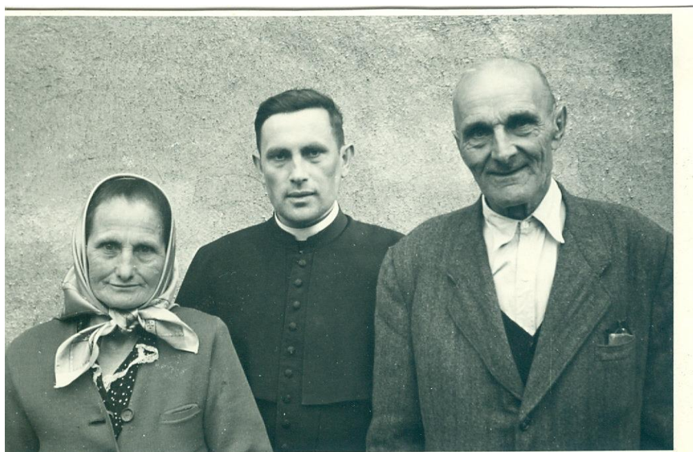
15) Mladý kněz s rodiči (nedatováno)