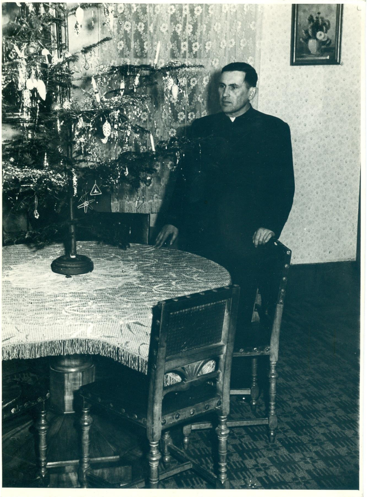
16) Vánoce na rýmařovské fáře (nedatováno)