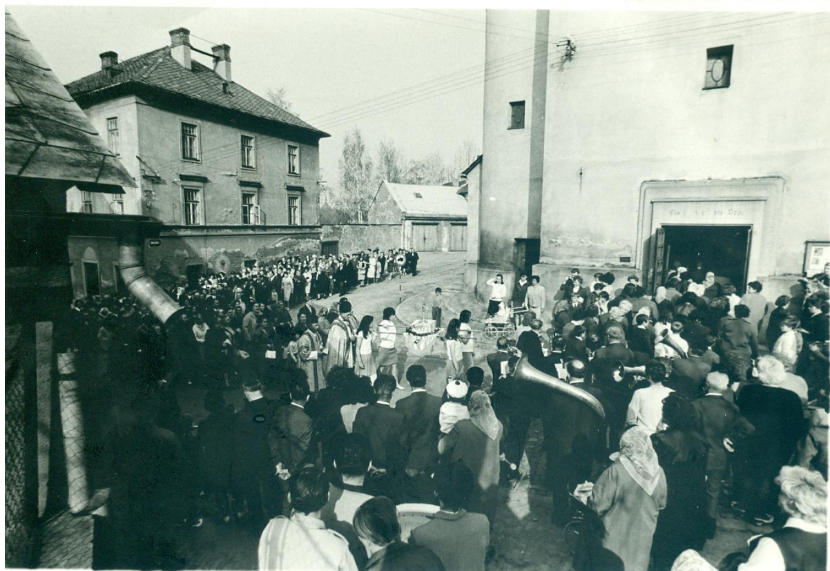
11) Procesí se svatými ostatky – kostel sv. archanděla Michaela Rýmařov (nedatováno)