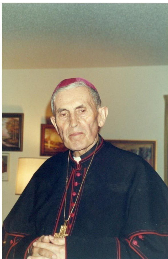
17) Arcibiskupem, 1991