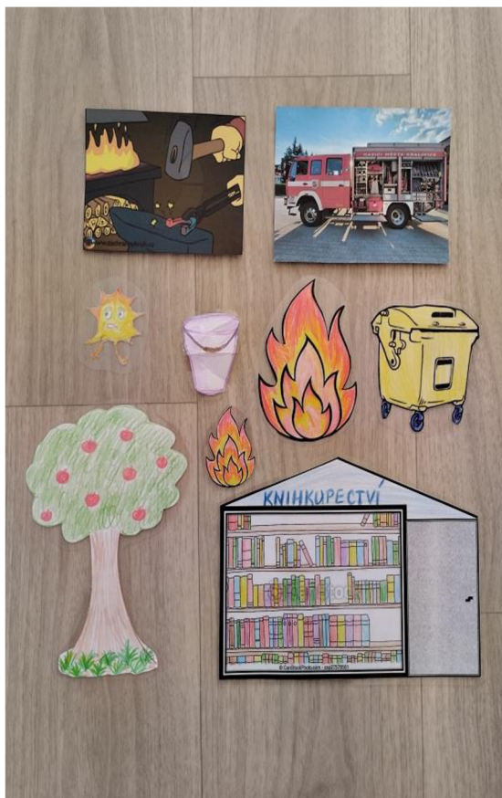
Př. č. 37 – Obrazový materiál k pohádce

Zvědavá jiskřička