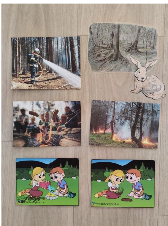
Př. č. 39 – Obrazový materiál k pohádce

Požár lesa