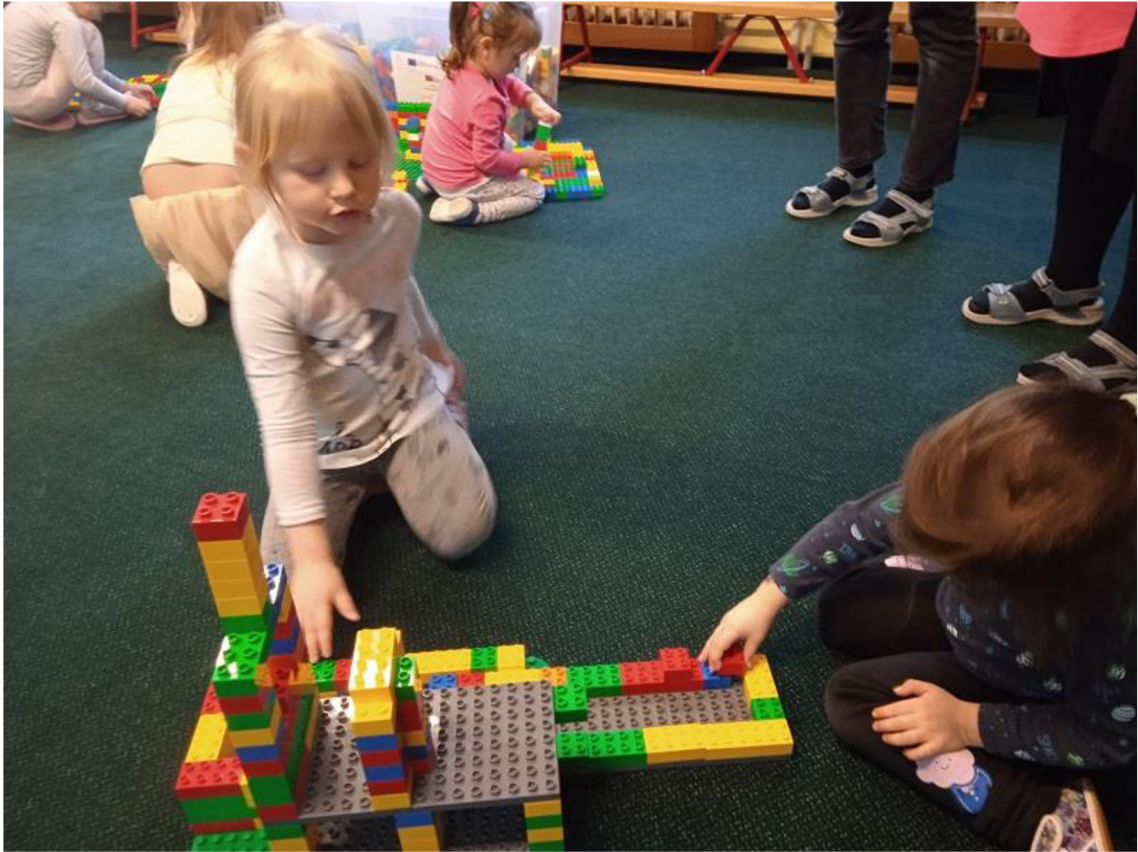
Př. č. 28 – Stavění domečků s únikovým východem