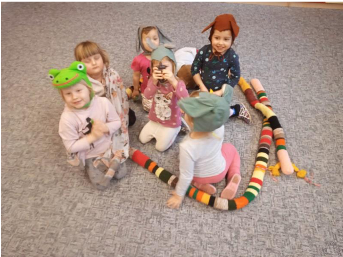
Př. č. 31 – Dramatizace – Požár lesa – hra na zajíčka a jeho kamarády v lese