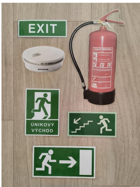
Př. č. 33 – Obrazový materiál k materiál k pohádce Hasič v pekle