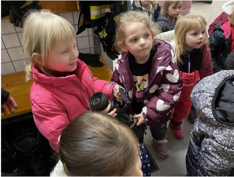
Př. č. 22 - Návštěva has.