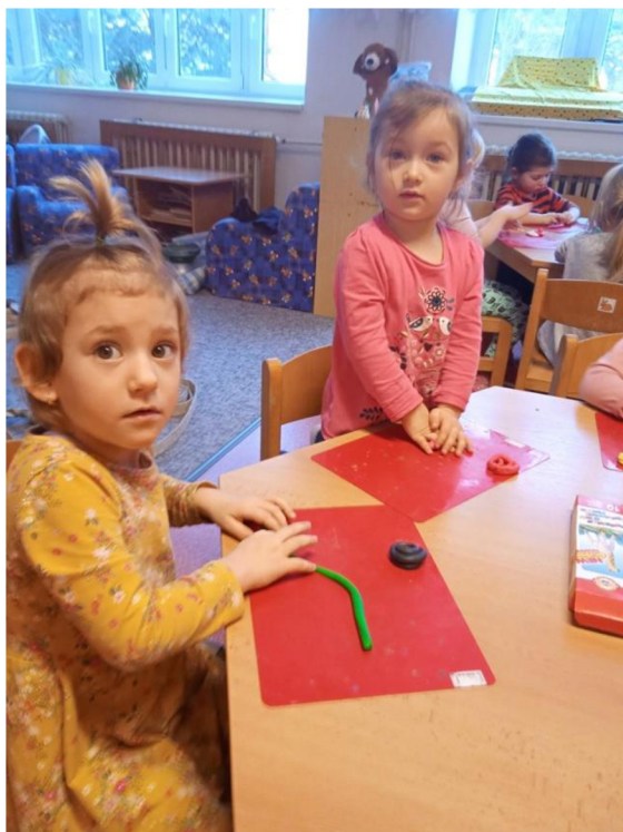
Př. č. 12 – Tvoření hadic z plastelíny

Přílohy č. 12 - 39 – Fotodokumentace z realizace projektu: