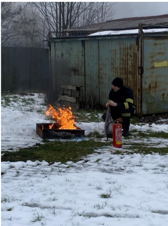
Př. č. 23 - Návštěva has. zbrojnice