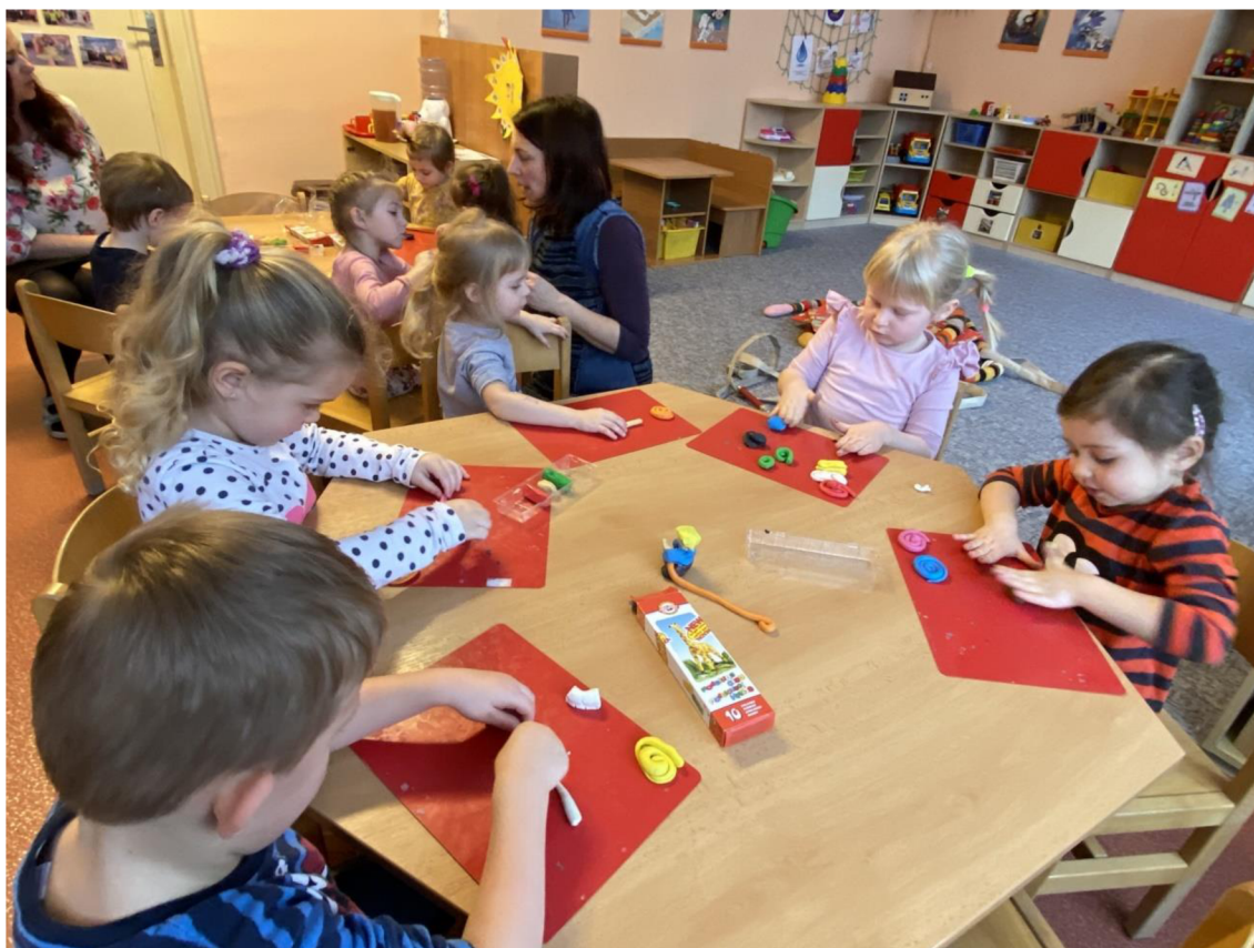
Př. č. 14 – Tvoření hadic z plastelíny