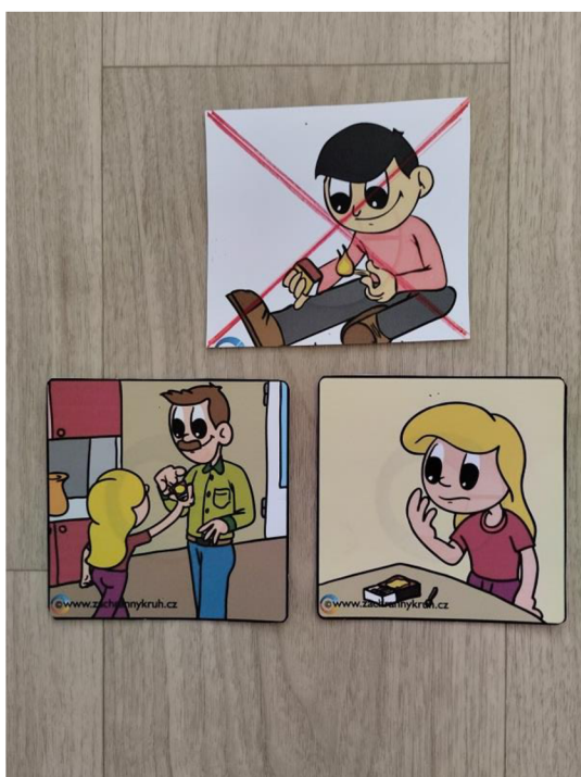
Př. č. 35 – Obrazový materiál k příběhu Nebezpečná hra