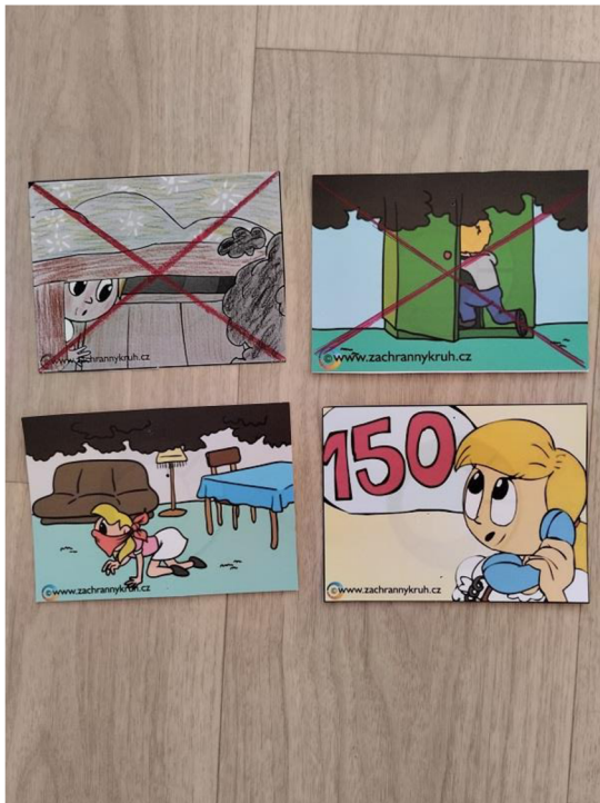
Př. č. 36 – Obrazový materiál k pohádce