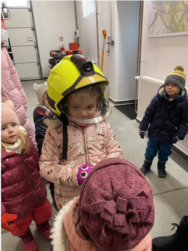
Př. č. 20 – Návštěva has. zbrojnice