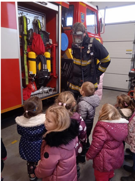
Př. č. 19 – Návštěva hasičské zbrojnice