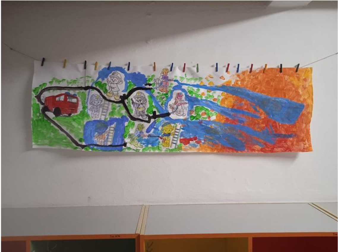
Př. č. 16 – Společná výtvarná práce- Hasiči hasí požár