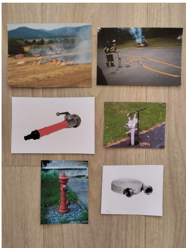
Př. č. 34 – Obrazový materiál k písničce Hasič hasí s proudnicí