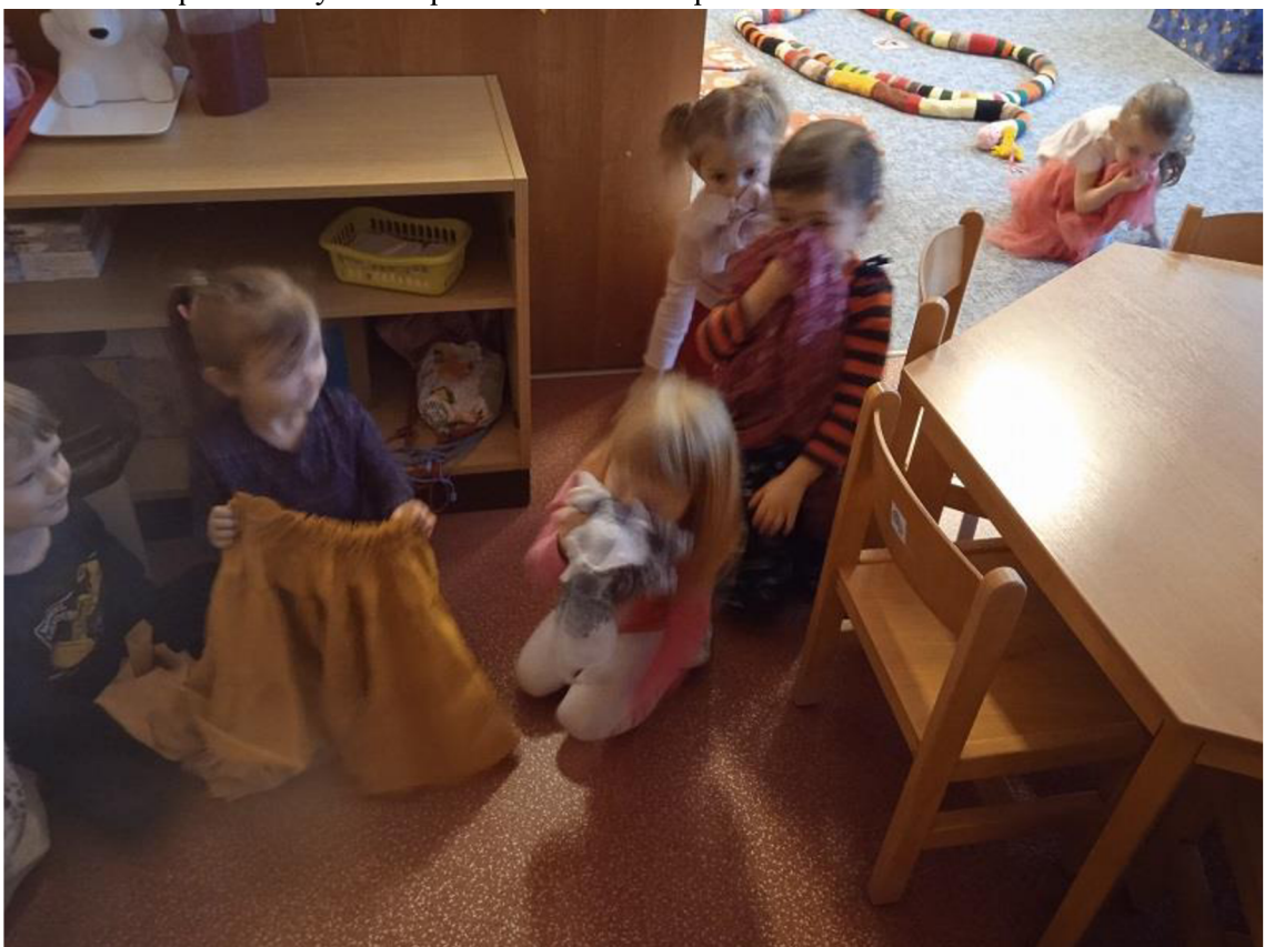
Př. č. 17 – Dramatizace – Hra na kuřátko – únik ze zakouřeného prostoru