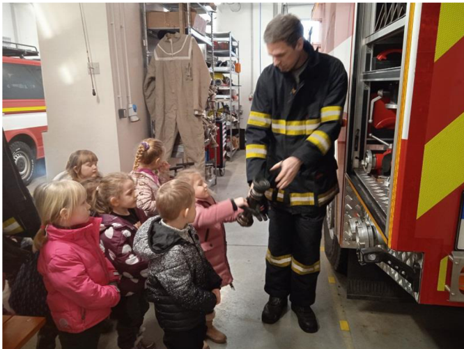
Př. č. 21 - Návštěva has. zbrojnice