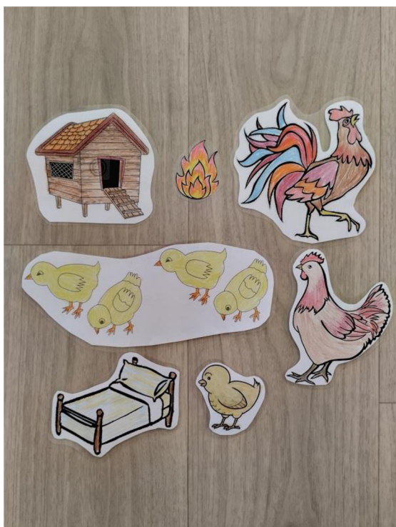
Př. č. 38 – Obrazový materiál k pohádce