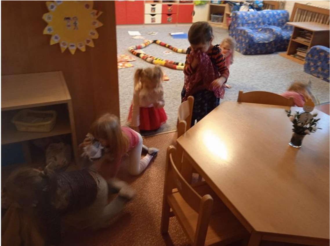
Př. č. 18 - Dramatizace – Hra na kuřátko – únik ze zakouřeného prostoru