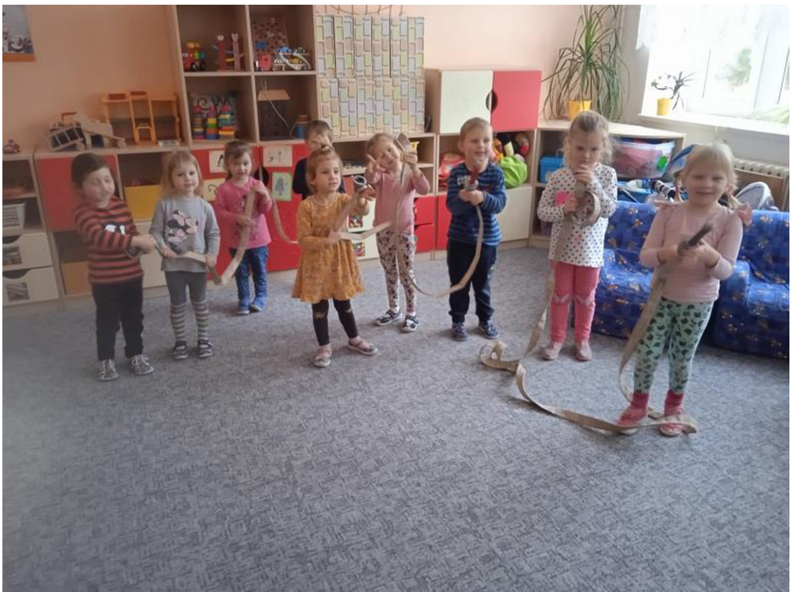
Př. č. 29 – Pohybová hra Hasiči hasí společně