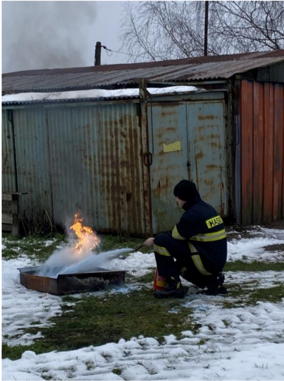
Př. č. 24 – Návštěva has. zbrojnice