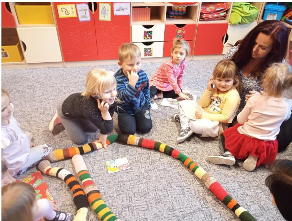
Př. č. 15 – Improvizace – telefonování hasičům