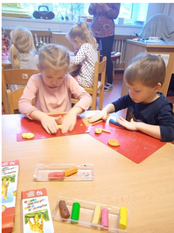
Př. č. 13 – Tvoření hadic z plastelíny