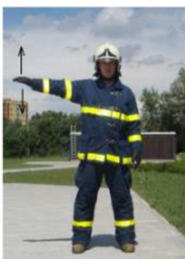
POMALEJI! Tlak SNÍŽIT!