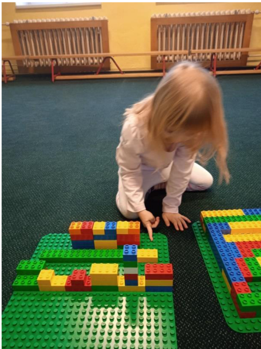
Př. č. 25 – Stavění domečků s únikovým východem