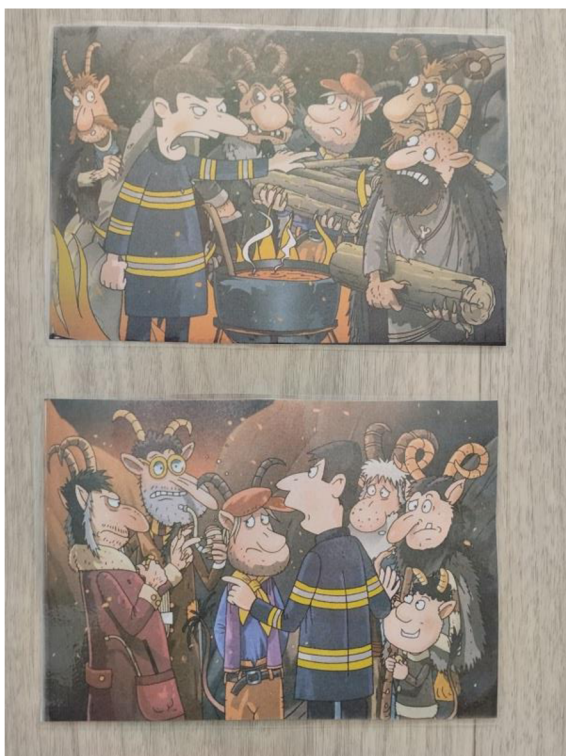
Př. č. 32 – Obrazový materiál k pohádce Hasič v pekle (z knihy Hasičské pohádky, Pospíšilová Z., 2016)