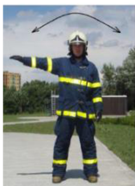
STÁT! Vodu STAV!