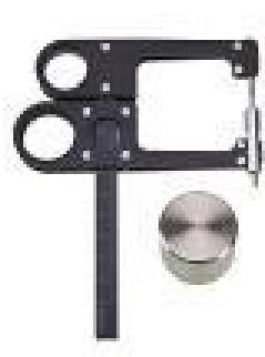
Obrázek 3. Kaliper BEST II K-501 (upraveno dle http://www.trystom.eu/ )

Chyba odhadu může vzhledem k intervalu spolehlivosti vystoupat až na 9-10 %. Samotné měření může i u zkušených antropologů dosáhnout chybovosti až 5 %. Výhodou této metody však je rychlost, použitelnost v terénních podmínkách a rozsáhlejších studiích (Riegerová, Přidalová, & Ulbrichová, 2006).