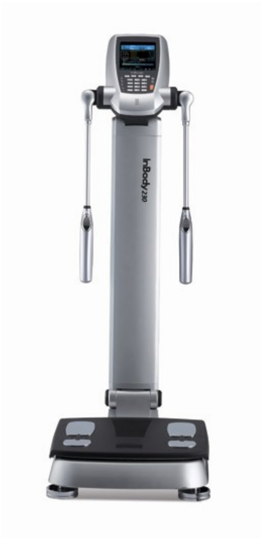
Obrázek 3. In Body 230 (upraveno dle http://www.nutripraktik.cz/inbody-230-analyza-tela )