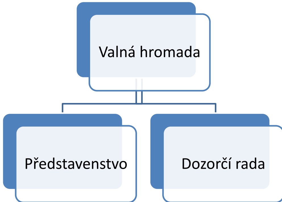
Obrázek 2: Orgány akciové společnosti podle dualistického systému