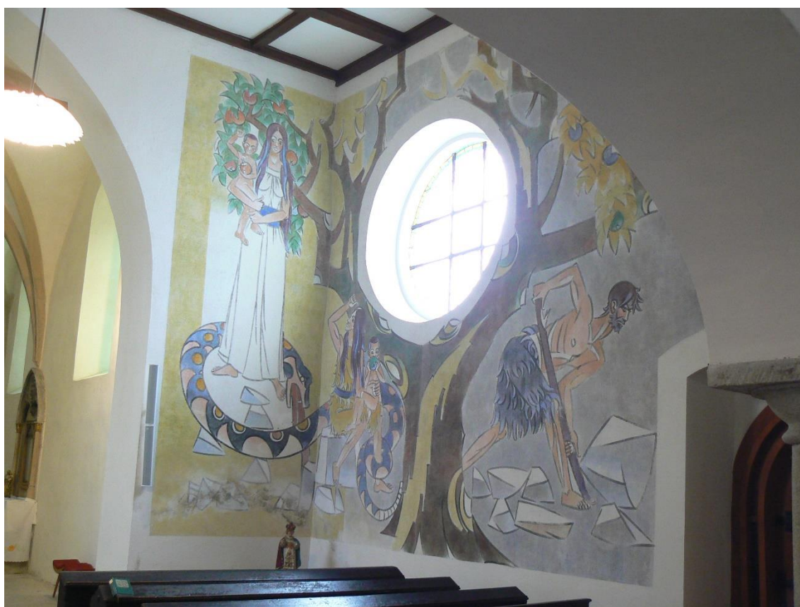
Obr. 11: Vojmír Vokolek, Adam a Eva po vyhnání z ráje, nástěnná malba, 1965. – Dřítč, kostel sv. Petra a Pavla.

Ke zpracování tématu života prvních lidí po vyhnání z ráje si Vojmír Vokolek vybral jižní (pravou) stěnu kostela sv. Petra a Pavla v Dřítči. Tato stěna je rovná, hladká bez jakéhokoliv architektonického členění. V její východní (pravé) části je umístěno kruhové okno, ze západu je ohraničena podklenutou kruchtou. Před stěnou není umístěn žádný mobiliář ani postranní oltáře, či jiné prvky, které by malbu mohly limitovat. K realizaci díla byla využita i plocha příčné čelní stěny vpravo od vítězného oblouku. Výsledná monumentální malba je tak umístěna na dvou stěnách – jižní a východní.