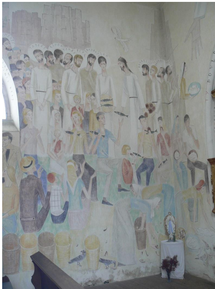
Obr. 6: Vojmír Vokolek, Sbíráni maný, nástěnná malba, 1958–1962. – Hrbokov, kostel sv. Václava.

Starého a Nového zákona a symbolicky odkazuje na Ježíše Krista, který dává sám sebe jako duchovní chléb vedoucí do života věčného.