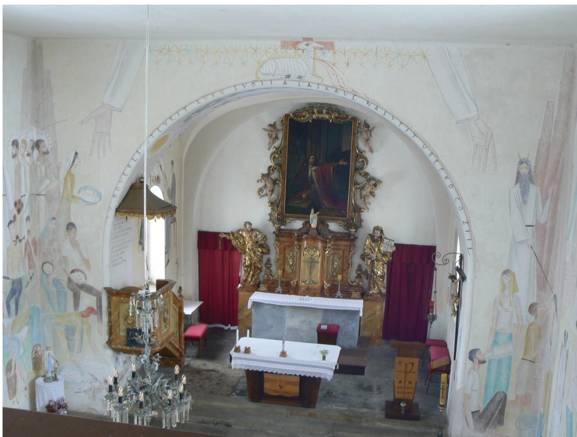
Obr. 8: Vojmír Vokolek, Boží Beránek (vítězný oblouk), nástěnná malba 1958–1962. – Hrbokov, kostel sv. Václava.

Vokolek stěny kostela ozdobil starozákonními i novozákonními výjevy a příběhy ze života svatých. Liší se od jeho jiných prací tím, že tyto děje přesunul do současnosti. Motiv, který spojuje všechny části této jeho výmalby je fyzické i duchovní uspokojení. Jeho postavy, kdy se začínal utvářet jeho styl tvorby, jsou vysoké, protáhlé a vznešené. 48 Jeho pozdější výtvořky osob jsou robustnější, barevnější a jejich obrysové linie jsou více zvýrazněny. Výmalba v Hrbokově je vlastně ještě docela tradiční a nepřekvapila tolik jako jeho pozdější malby. Biblické postavy byly oblečeny do šatů své doby, ale lid, který je obklopuje, počínaje malými dětmi a konče starými, byl inspirován obyvateli Hrbokova, Vojmír je všechny oblékl do šatů moderní doby.