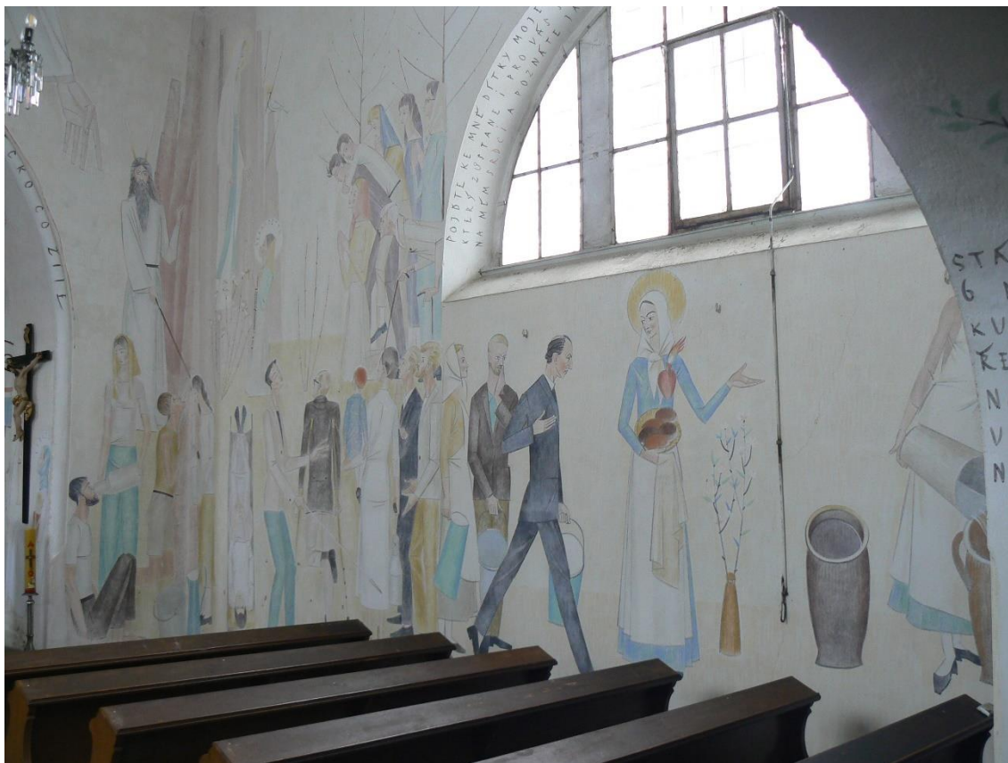
Obr. 7: Vojmír Vokolek, Voda ze skály (vlevo), nástěnná malba, 1958–1962. – Hrbokov, kostel sv. Václava.

postavy z tohoto výjevu postavami z naší současnosti. Pramen tryskající ze skály byl záchranou pro Izrael na poušti, a symbolicky je pramenem spásy pro všechny generace.