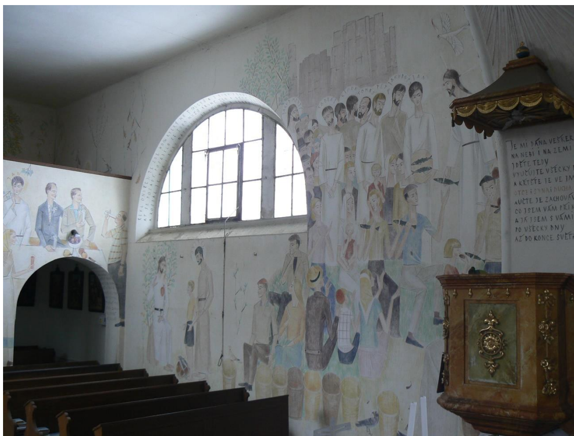
Obr. 4: Vojmír Vokolek, Zázračné nasycení pěti tisíců lidí, nástěnná malba, 1958–1962. – Hrbokov, kostel sv. Václava.

Na levou (severní) stěnu kostelní lodi umístil Vojmír Vokolek malbu zobrazující zázračné nasycení pěti tisíců lidí. Tento Ježíšův zázrak máme zachycen v bibli (Mt 14,13-21, Mk 6,30-44, L 9,10-17 a J 6,1-15).