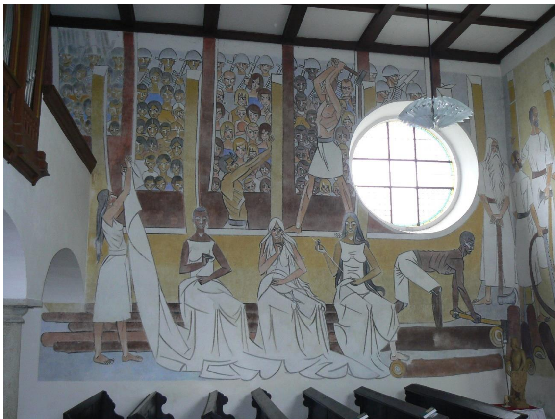
Obr. 9: Vojmír Vokolek, Stavba Noemovy archy, nástěnná malba, 1965. – Dříteč, kostel sv. Petra a Pavla.

Jde o aktualizaci tématu a údajně se jedná o výjev z tzv. Kubánské krize, ale možná obecně o závody ve zbrojení v rozděleném světě. Nejspíš se jedná o konfrontaci moderní doby (ovšem ozbrojené), která s pohrdáním hledí na nadčasové (biblické, tvůrčí). Je zde kontrast ničení a tvoření.