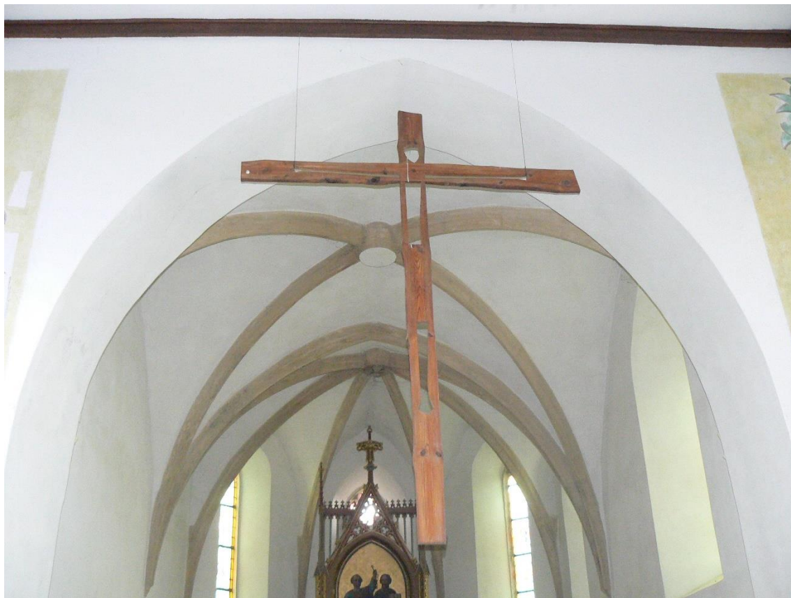
Obr. 14: Vojmír Vokolek, Závěsný kříž, dřevo, 1965. – Dříteč, kostel sv. Petra a Pavla.

Kříž zavěšený v horní části vítězného oblouku je sestaven ze dvou dřevěných prken. Prkna jsou opět „neomítaná“ a corpus je znázorněn jednoduchým vyříznutím polí symbolizujících tělo, končetiny a hlavu ukřižovaného. V kříži tak vznikají průhledné části, které jej opticky odlehčují.