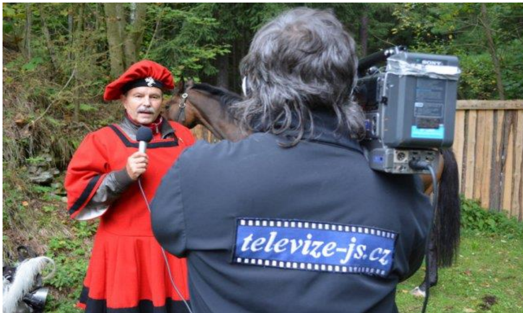
Obrázek č. 7: Příprava pořadu Mazlíček