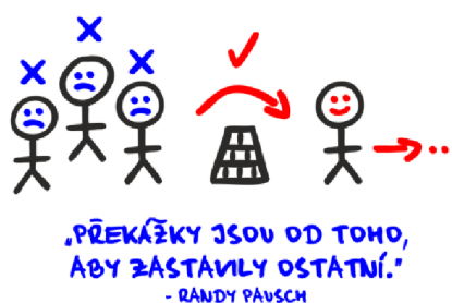
Obrázek č. 3: Překážky a cesta k úspěchu (Ludwig, 2019)