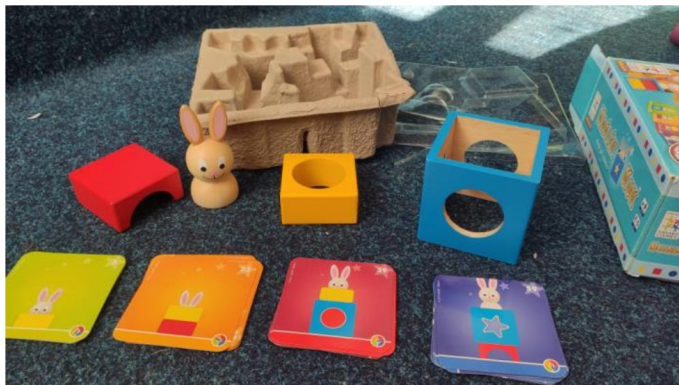
Obrázek č. 2: Králík Kuk

Hlavními pomůckami budou dvě didaktické hry, které obsahují předmatematické úlohy seřazené vzestupně dle obtížnosti. První hra se nazývá Králík Kuk , je zaměřená na prostorovou orientaci a logické myšlení. Obsahuje 60 kartiček s úlohami, které jsou seřazené ve čtyřech úrovních od jednodušších ke složitějším. Děti mají pomoci manipulace s dřevěnými kostkami sestavit, co vidí na obrázku.