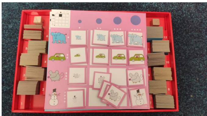
Obrázek č. 3: Nikitin Matrici (Logo Verlag)

Kromě toho budu potřebovat záznamový arch, papíry, nahrávací zařízení, tužku. A také pomůcky pro „odreagování“ mezi jednotlivými fázemi ve výzkumu, u Králíka Kuka to byly pastelky, papíry a puzzle se souvislostmi.