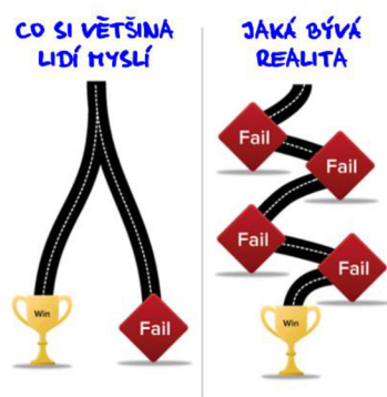
Obrázek č. 2: Cesta k úspěchu (Ludwig, 2019)

Jak u růstového, tak v případě fixního myšlení může být jakékoli selhání bolestné. Taková zkušenost o nás nevypovídá, že jsme hloupi. Staví nás ale před problém, kterému je třeba čelit a poučit se z něj (Dwecková, 2017, s. 43). Bohužel v naší zemi se na chybu často kouká jako na něco nežádoucího, nepatřičného, jako na osobní selhání. Obrázky č. 2 a 3 ukazují, že cesta vedoucí k úspěchu nebývá přímá, ale znamená i překonávání překážek, které mohou některé jedince odrazovat.