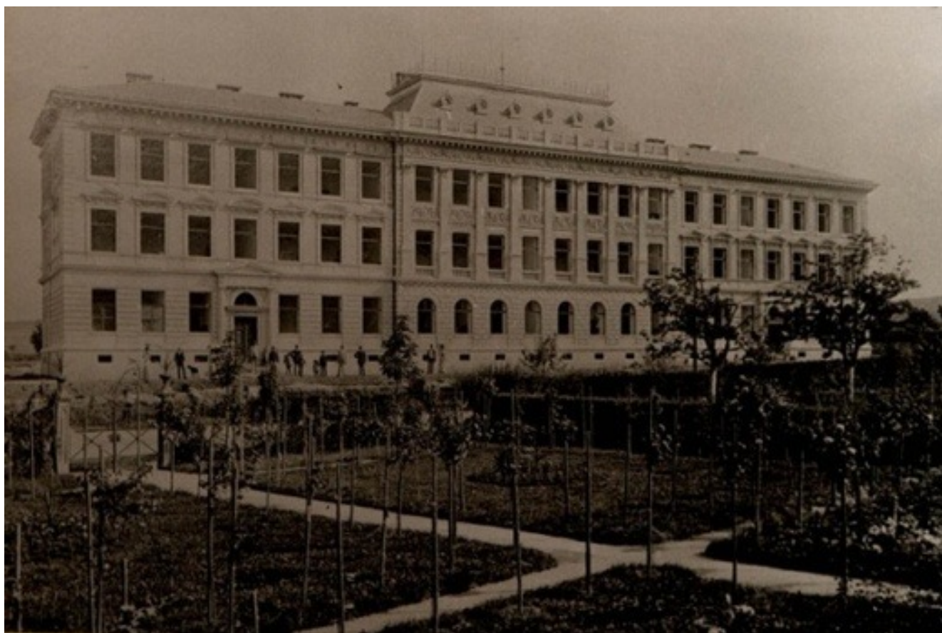
Obrázek č. 1: Budova školy v roce 1893