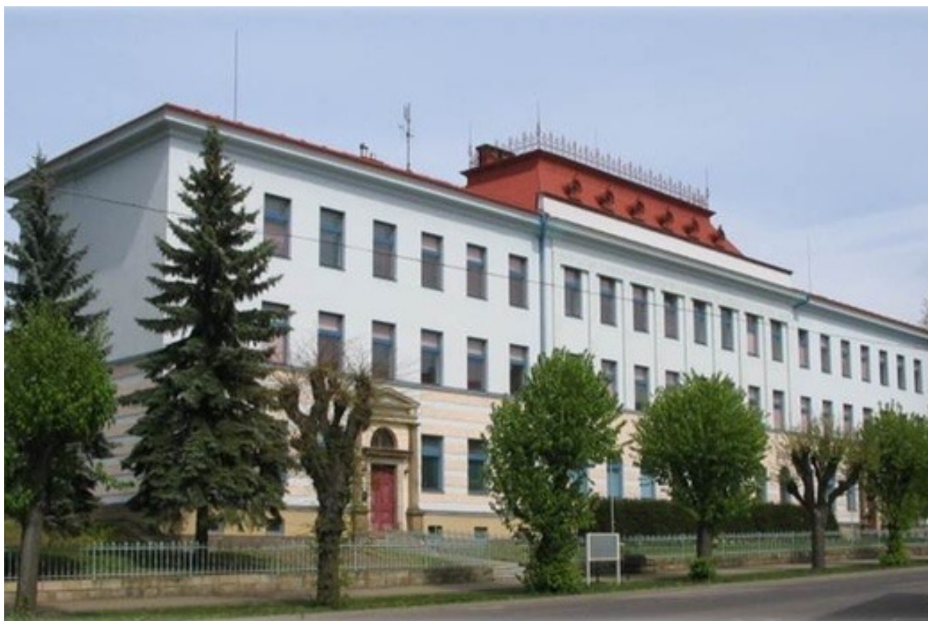
Obrázek č. 2: Budova školy po rekonstrukci z roku 1999