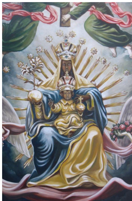
57. Neznámý malíř. Obraz Panny Marie Montserratské. 18. století. Město Doksy, kaplička Panny Marie Montserratské.