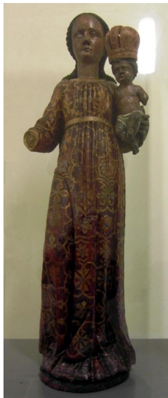
17. Socha Panny Marie Einsiedelské. 1709. Město Ostrov, Klášterní areál v Ostrově.