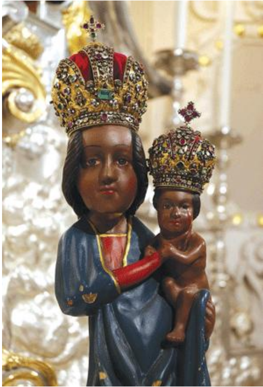
63. Lidová soška Panny Marie Svatohorské. Asi 1348. Bazilika Nanebevzetí Panny Marie na Svaté Hoře u Příbrami.