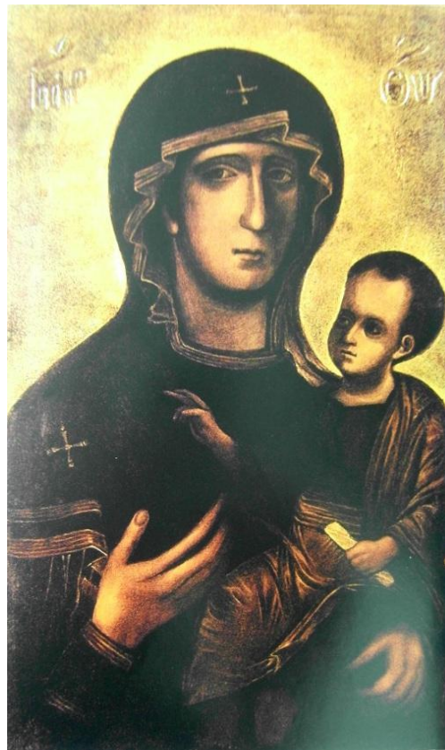
2. Ikona Madony Svatotomské (Brněnské). Snad 12. nebo 13. století. Kostel Nanebevzetí Panny Marie Staré Brno.