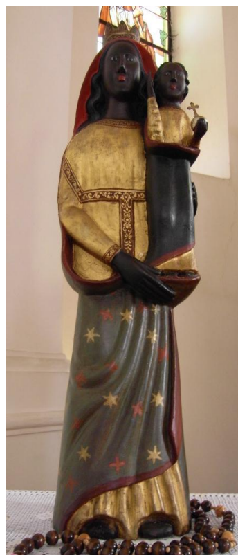
45. Lidová socha Loretánské Madony. Kolem 1699. Kostel Povýšení sv. Kříže v Pyšelích (původně v Loretě).