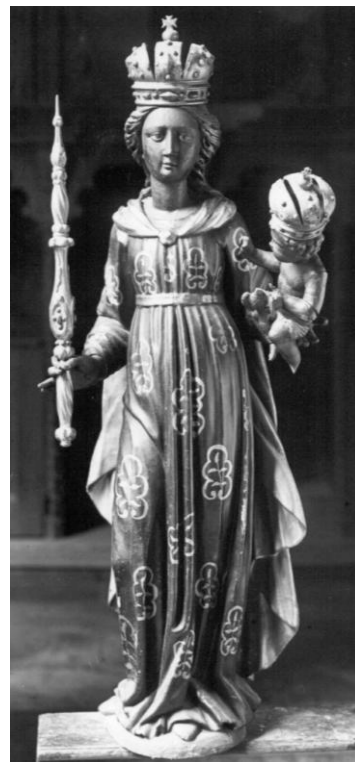
13. Socha Panny Marie Einsiedelnské. Pol. 17. století. Minoritský klášter v Českém Krumlově.