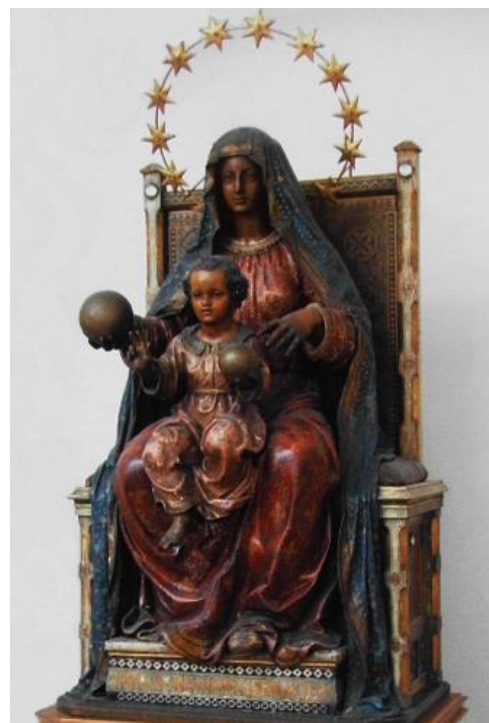
59. Socha Panny Marie Montserratské. Kolem 1635. Kostel Panny Marie, Benediktinské opatství Panny Marie a sv. Jeronýma v Emauzích.