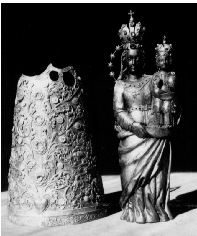
50. Socha Panny Marie Loretánské. Před 1665. Poutní místo Maria Loreto ve Starém Hrozňatově.