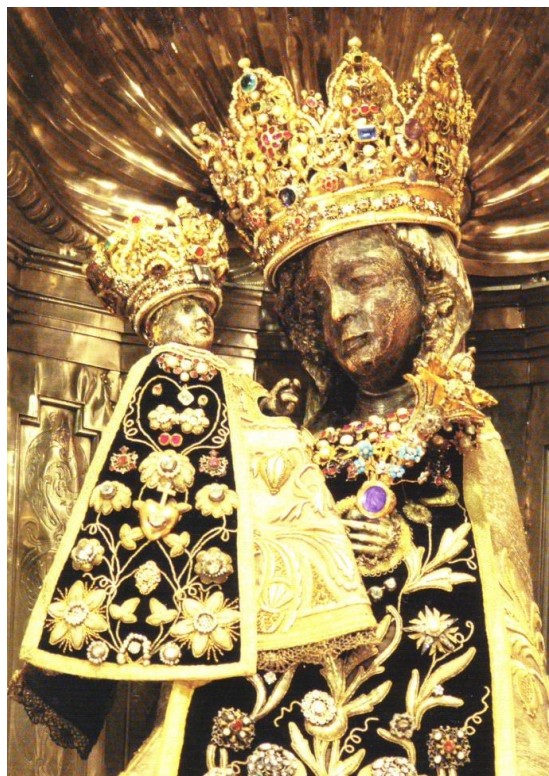
68. Panna Maria Altöttinská. Altötting, Bavorsko. Detail.