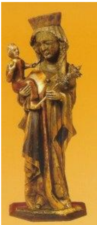
67. Panna Maria Altöttinská. Altötting, Bavorsko.