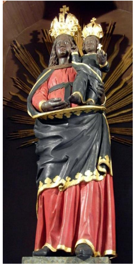
21. Socha Panny Marie Loretské. Před 1685. Loreta v Boru.