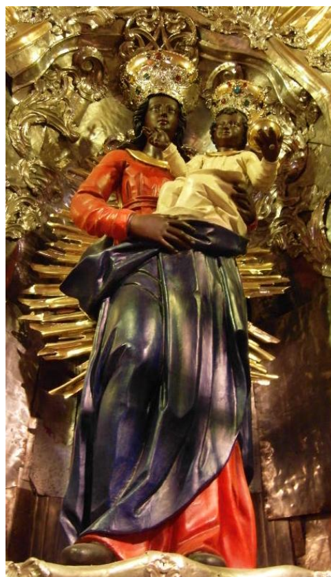
27. Socha Loretánské Madony. 50. léta 17. století. Loreta v kostele sv. Františka Serafinského