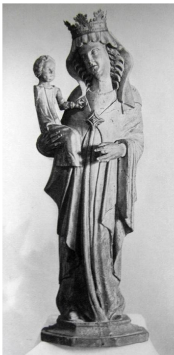
10. Soška Panny Marie Altöttinské. Prostějovský soukromý majetek.