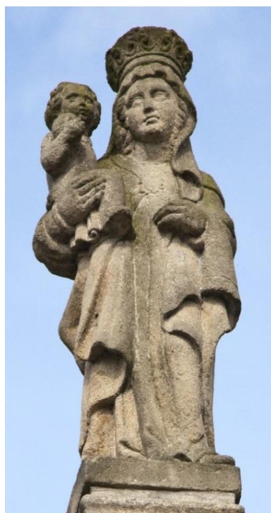
9. Socha Panny Marie Altöttinské. 1701. Kámen. Cca 100 cm. Nová Včelnice.