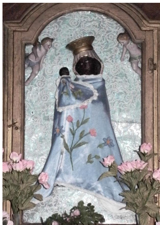
7. Soška Panny Marie Altöttinské. 2. pol. 18. století. Kaplička Panny Marie Altöttinské v Jáchymově na Novém městě.