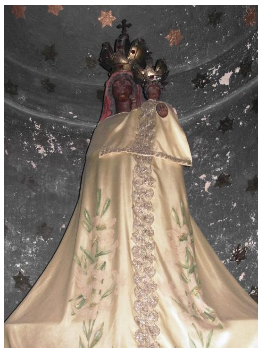
47. Socha Panny Marie Loretánské. Před 1828. Zámek Rychnov nad Kněžnou, Loretánská kaple v kostele Nejsvětější Trojice.