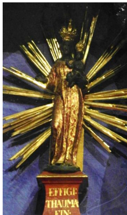
19. Soška Panny Marie Einsiedelské. Před 1732. Benediktinský klášterní kostel sv. Petra a Pavla v Rajhradě.