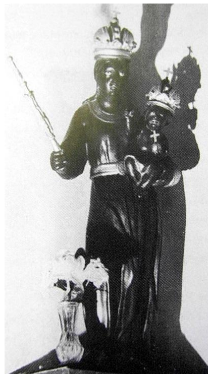
15. Socha Panny Marie Einsiedelnské. Asi 2. třetina 18. století. Neznámo kde (dříve kostel sv. Barbory v Komořanech, neznámý původ).