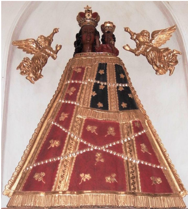
22. Socha Panny Marie Loretské. Kolem 1670. Kostel sv. Jakuba v Boskovicích.