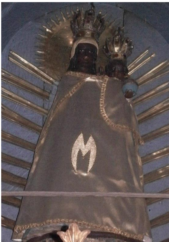
32. Socha Panny Marie Loretánské. Po 1621. Kostel sv. Vojtěcha v Jílovém u Prahy (ze zaniklého kostela Panny Marie Loretánské).