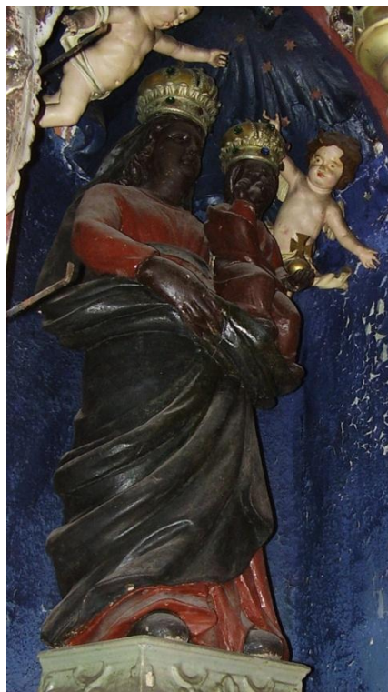
49. Socha Panny Marie Loretánské. 1. pol. 18. století. Loretánská kaple v kostele Božího těla ve Slavonicích (z Loretánské kaple ve Vratěnině).