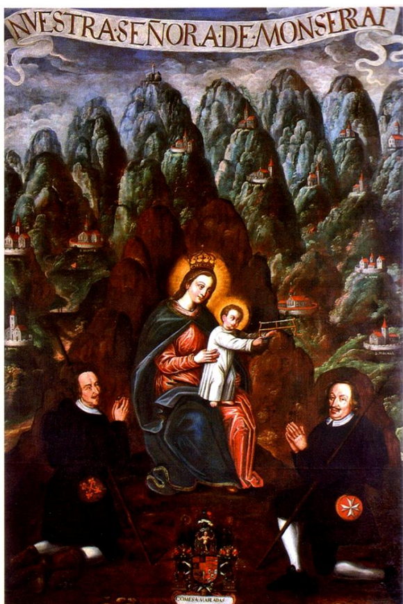
62. Neznámý jihoevropský malíř. Obraz Panny Marie Montserratské. Asi první třetina 17. století. Městské muzeum a galerie ve Vodňanech (původně hlavní oltář kostela Narození Panny Marie ve Vodňanech).