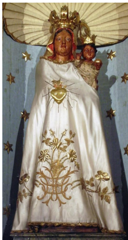
43. Socha Panny Marie Loretánské. Asi 2. čtvrtina 18. století. Kostel sv. Michala v Olomouci.