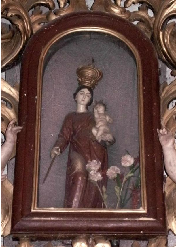
20. Soška Panny Marie Einsiedelské. 15. století? Kostel sv. Bartoloměje v Rejštejně.