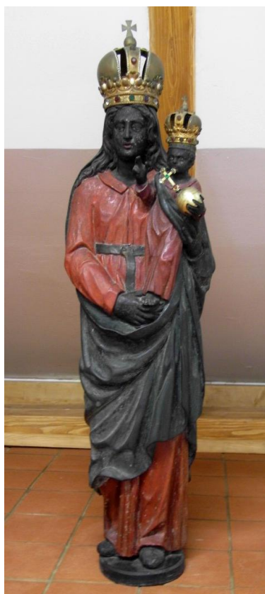
26. Socha Panny Marie Loretánské. 1683. Muzeum Oderska (z fulnecké Lorety).