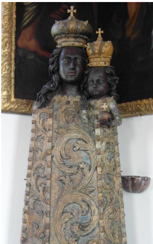
1. Socha Černé Matky Boží. 17. století. GHM, Trojský zámek.