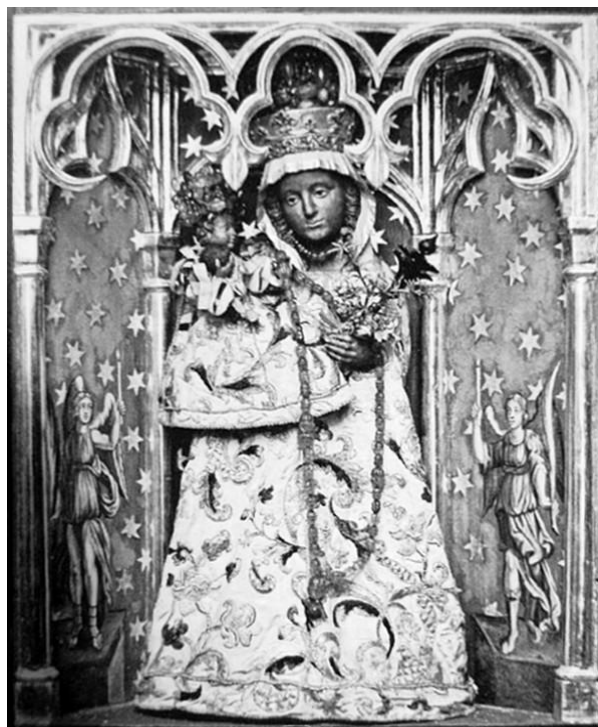
5. Soška Panny Marie Altöttinské. 1. pol. 17. století. Zámek Český Krumlov.