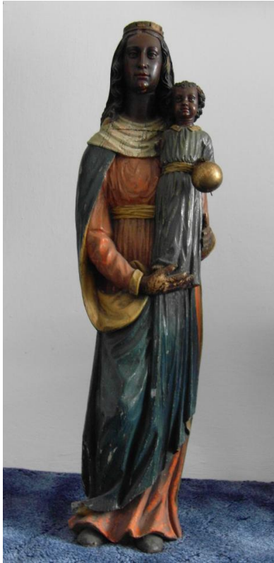
36. Socha Panny Marie Loretánské. Asi konec 17. století. Město Manětín (původně snad z Loretánské kaple v Rabštejně nad Střelou).