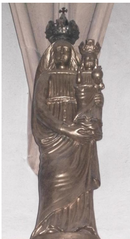
42. Socha Panny Marie Loretánské. 18. století. Kostel sv. Mořice v Olomouci.