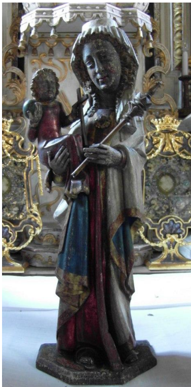
12. Soška Panny Marie Altöttinské. 15. století? Zámecká kaple ve Velkých Losinách.