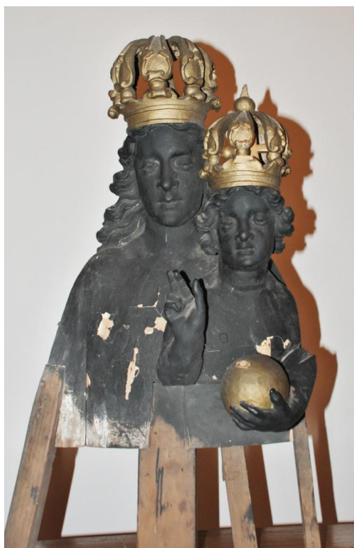
54. Soška Panny Marie Loretánské. Kolem 1750. Kostel Nesvětější Trojice v Žacléři.