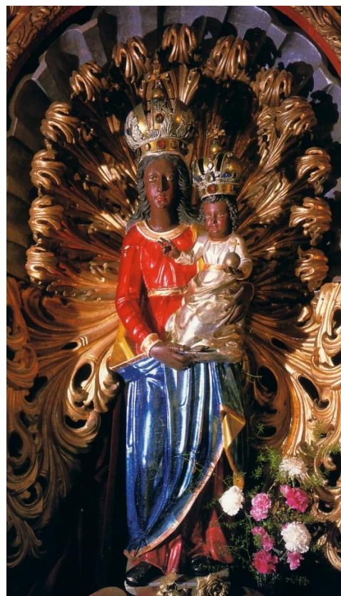
25. Socha Panny Marie Loretánské. 1679. Děkanský kostel sv. Ducha v Dolním Římově.