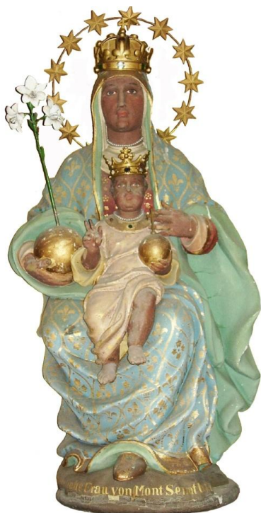
58. Socha Panny Marie Montserratské. Kolem 1634. Svatyně Matky Boží Montserratské u Cizkrajova.