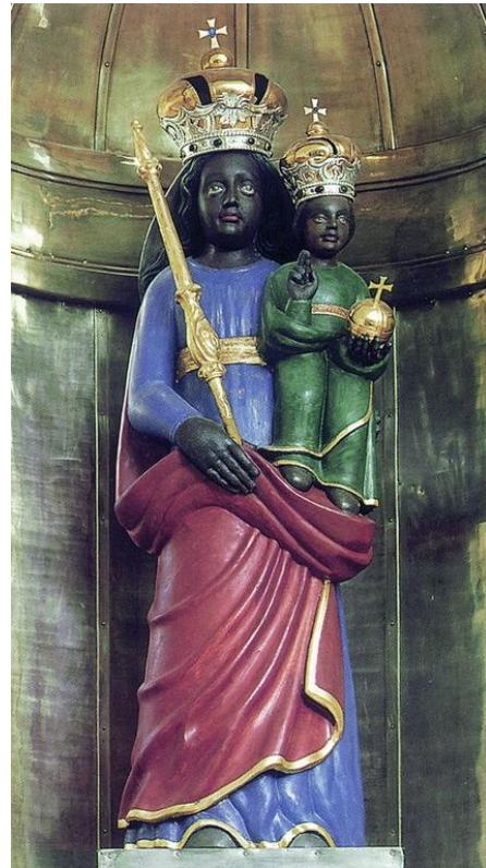
66. Panna Maria Loretánská. Vídeň, Rakousko.