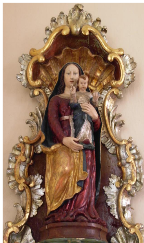
53. Socha Panny Marie Loretánské. Kolem pol. 18. století. Kostel sv. Václava ve Vranově (původně Loreta v Komorním Hrádku).