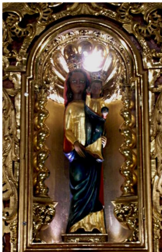
41. Socha Panny Marie Loretánské. Počátek 18. století. Dóm sv. Václava v Olomouci.