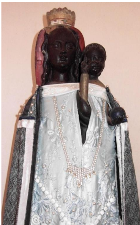
34. Lidová socha Panny Marie Loretánské. Asi 1831. Loreta