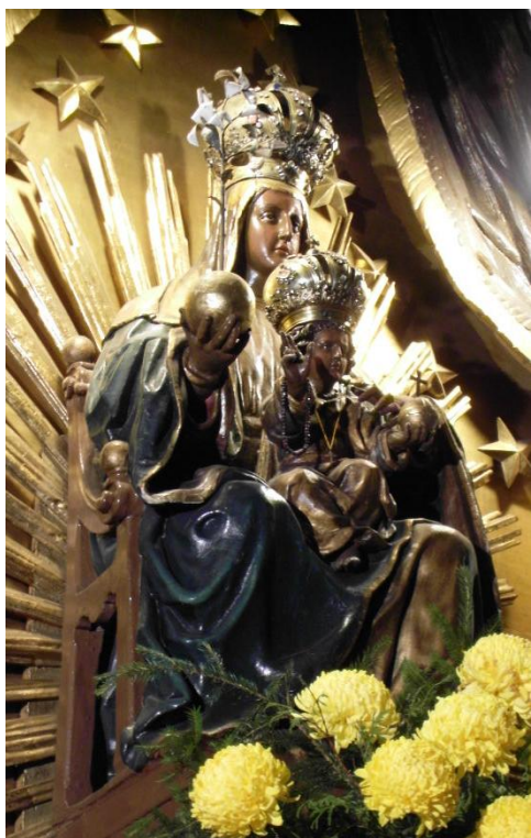
56. Socha Panny Marie Montserratské. Kolem 1635. Kostel sv. Bartoloměje a Nanebevzetí Panny Marie v Doksech (přenesená sem z hradní kaple na Bezděže).