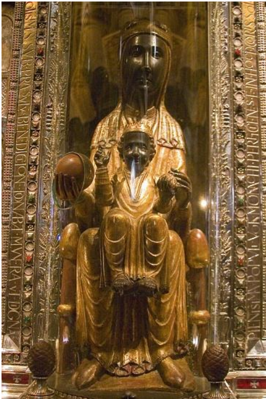
65. Panna Maria Montserratská. Montserrat, Španělsko.