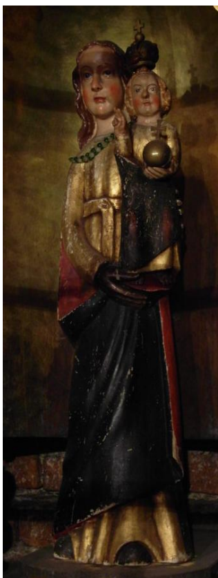
40. Socha Panny Marie Loretánské. Kolem 1680. Loretánská kaple, klášter Milosrdných bratří v Novém Městě nad Metují.