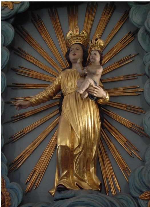
16. Socha Panny Marie Einsiedelské. 1773. Kostel sv. Václava v Lovosicích (původně z kaple Panny Marie Einsiedelské).