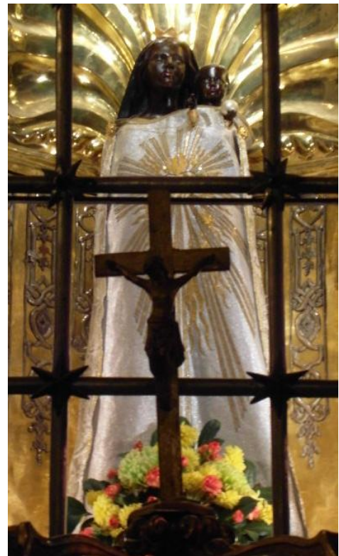
23. Socha Panny Marie Loretské. Před 1719. Kostel sv. Janů v Brně, v Loretě.