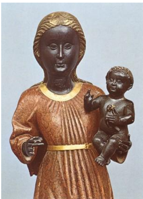
69. Panna Maria Einsiedelská. Einsiedeln, Švýcarsko.