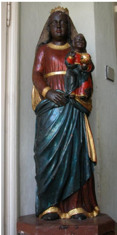
38. Socha Panny Marie Loretánské. Asi kolem 1623. Kolegiální kapitula u sv. Václava v Mikulově.