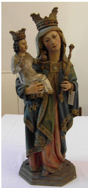
11. Soška Panny Marie (Altöttinské). Konec 16. století. Arcibiskupství pražské (z kostela sv. Prokopa ve Svěmyslicích).