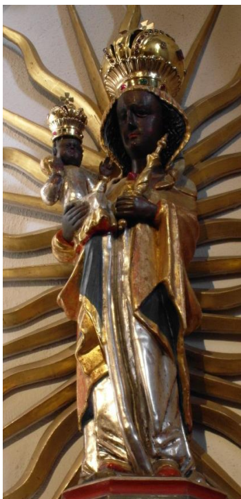
4. Soška Panny Marie Altöttinské. Asi 16. století. Farní chrám sv. Petra a Pavla v Bohnicích.