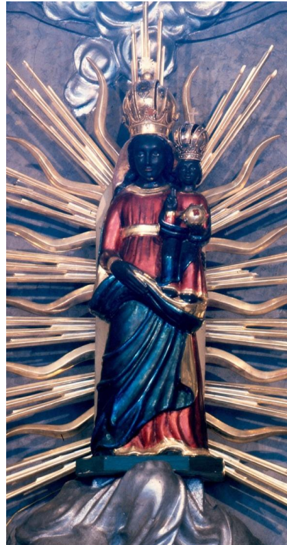
37. Socha Panny Marie Loretánské. Kolem 1623. Kostel sv. Václava v Mikulově (původně z mikulovské Lorety).