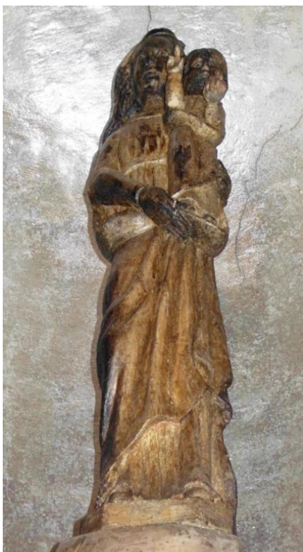
24. Socha Panny Marie Loretánské. Kolem 1698. Vlastivědné muzeum a galerie v České Lípě, Loreta.