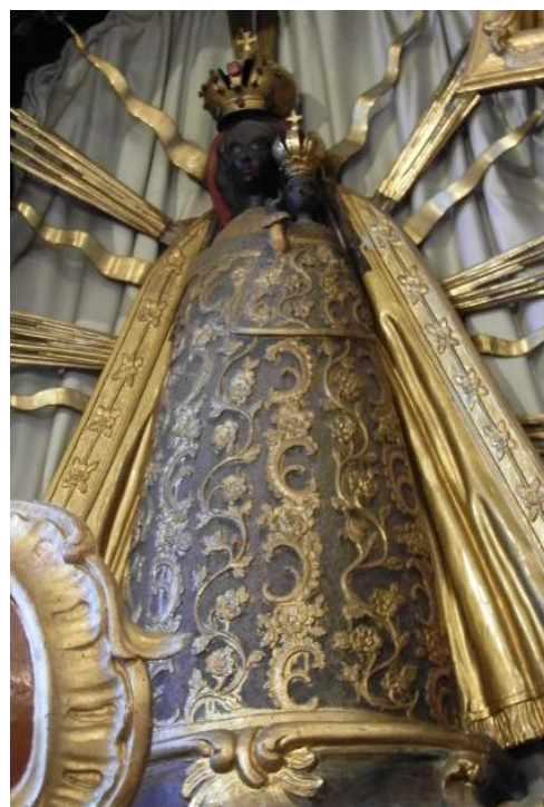
35. Socha Panny Marie Loretánské. Kolem 1659. Kostel sv. Marie Magdalény v Malém Boru (z Loretánské kaple u Horažďovic).