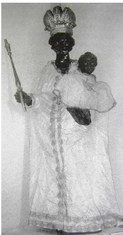
18. Socha Panny Marie Einsiedelské. Kolem 1680. Neznámo kde (z Einsiedelské kaple v Radíči).