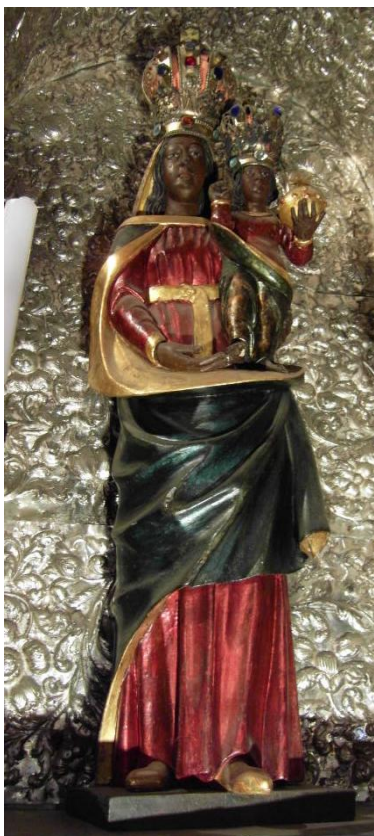
44. Socha Panny Marie Loretánské. Před 1627. Loreta Praha.