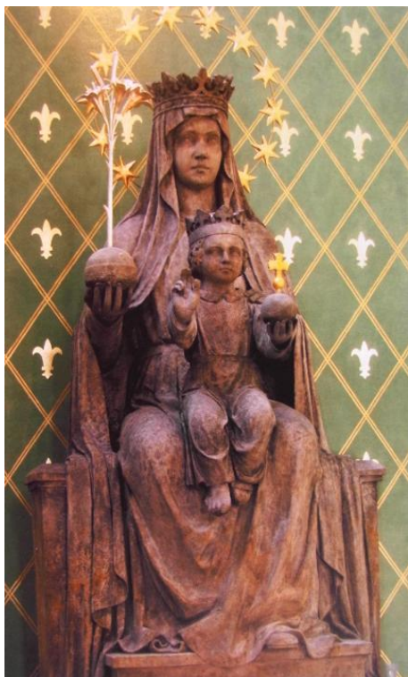
60. Socha Panny Marie Montserratské. 1712. Kostel Panny Marie, Benediktinské opatství Panny Marie a sv. Jeronýma v Emauzích.