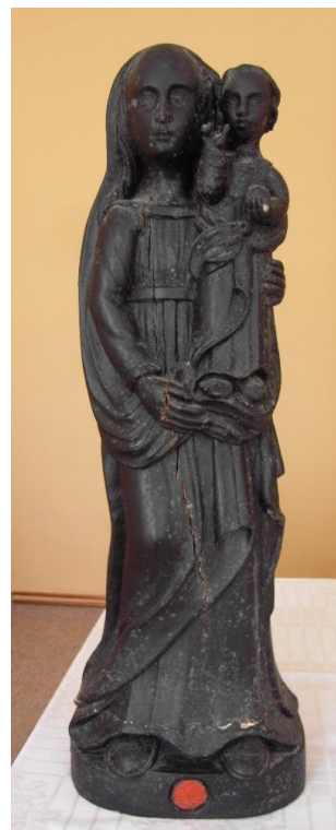
51. Soška Panny Marie Loretánské. Kolem 1749. Řk farnost Uherské Hradiště (původně z Loretánské kaple kostela sv. Jiří).