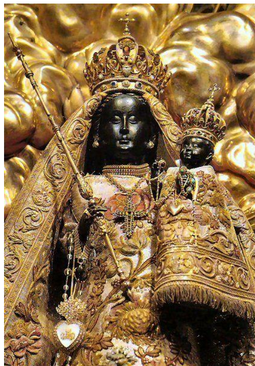
70. Panna Maria Einsiedelská. Einsiedeln, Švýcarsko. Oděná.