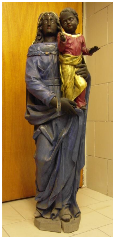
33. Socha Panny Marie Loretánské. Kolem 1711. Vlastivědné muzeum Dr. Hostaše v Klatovech (původně v Loretánské kapli v Týnci).