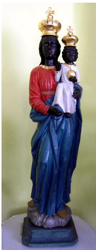
52. Socha Panny Marie Loretánské. Kolem 1703. Řk farnost Vlašim.