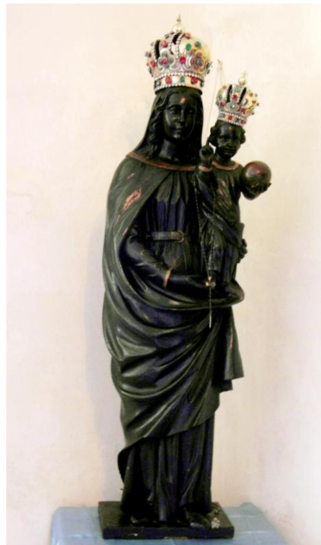
39. Socha Panny Marie Loretánské. Kostel sv. Petra a Pavla v Mimoni (původně Loreta ve Svěbořích).