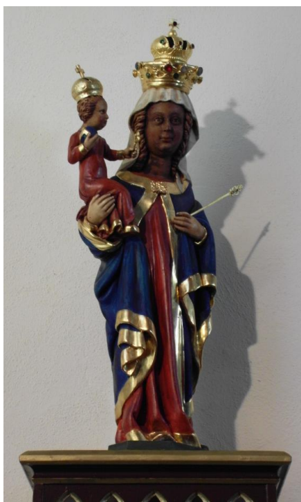
8. Soška Panny Marie Altöttinské. Před 1662. Farní kostel Nanebevzetí Panny Marie v Nové Včelnici.