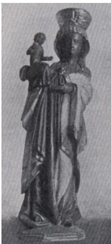
6. Soška Panny Marie Altöttinské. Asi 17. století. Neznámo kde (dříve na zámku Hrubý Rohozec).