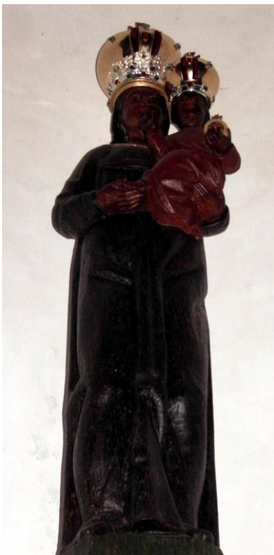
48. Socha Panny Marie Loretánské. 1870. Santa Casa v kostele Nejsvětější Trojice bývalého kláštera františkánů ve Slaném.