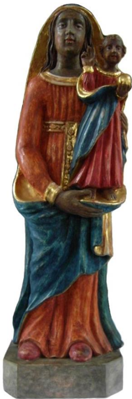
30. Soška Panny Marie Loretánské. 1. pol. 18. století. Loretánská kaple v Jaroměřicích u Jevíčka.