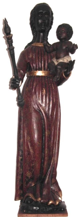
14. Socha černé Madony s Ježíškem. 2. třetina 18. století. Zámek Hrubý Rohozec (neznámý původ).