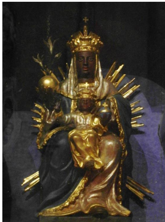
61. Soška Panny Marie Montserratské. Před 1732. Benediktinský klášterní kostel sv. Petra a Pavla v Rajhradě.