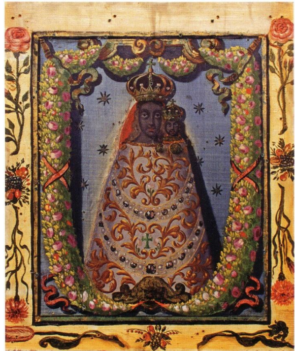
29. Obrázek Panny Marie Loretánské. Pravděpodobně polovina 17. století. Kaple sv. Jana Nepomuckého v Horosedlech.