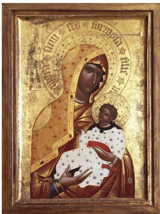
3. Madona Březnická. 1396. Biskupství českobudějovické, zapůjčeno do NG.