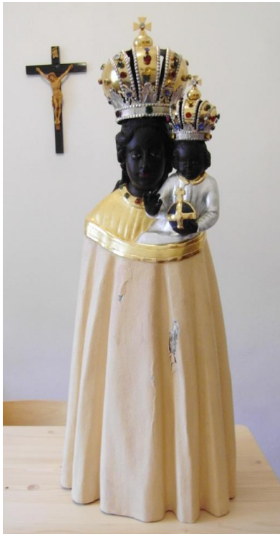
28. Soška Panny Marie Loretánské. 1. polovina 18. století. Klášter sv. Františka v Hájku.