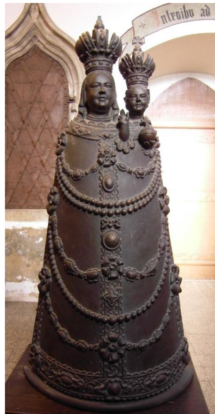
31. Socha Panny Marie Loretánské. Kolem 1723. Depozitář farnosti u kostela sv. Jakuba v Jihlavě (původně Loretánská kaple při kostele sv. Kříže).