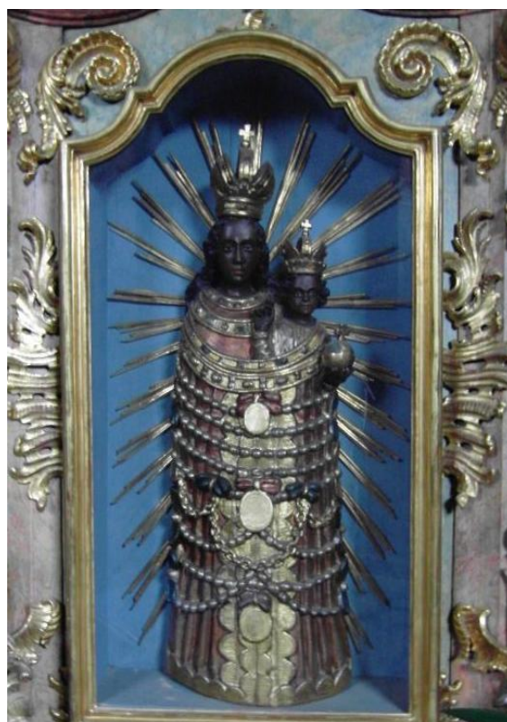
55. Socha Panny Marie Loretánské. Kolem 1740. Děkanský kostel sv. Václava v Žamberku.