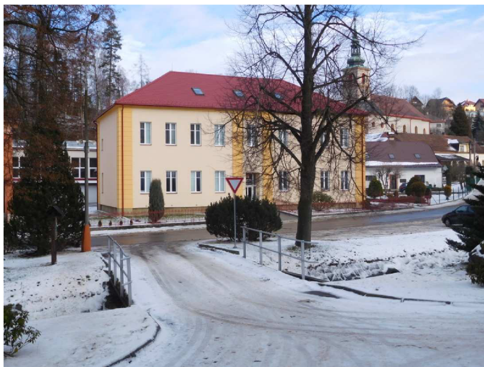
Budova ZŠ po rekonstrukci