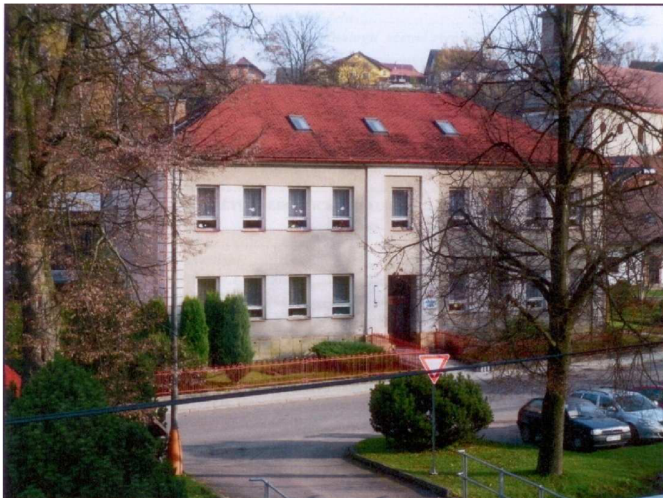
Budova ZŠ před rekonstrukcí