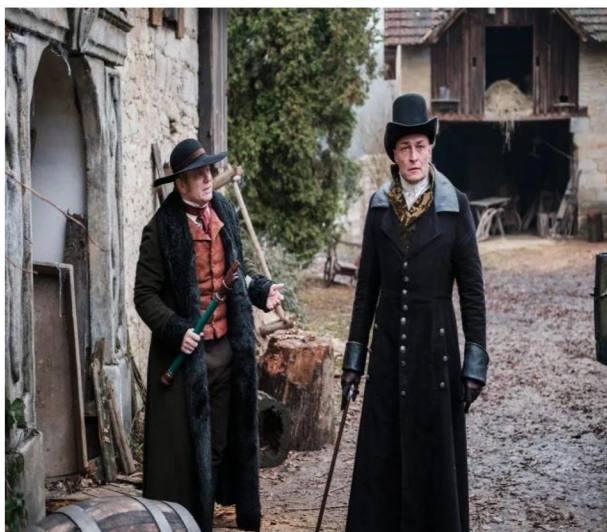
Příloha č. 5