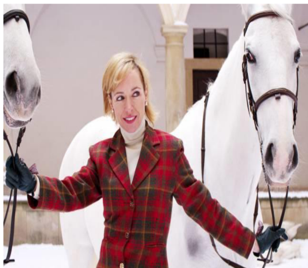
Příloha č. 7