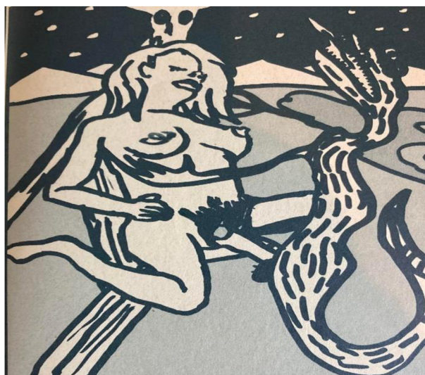
Příloha č. 4