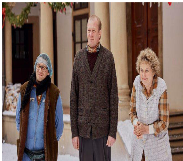
Příloha č. 8