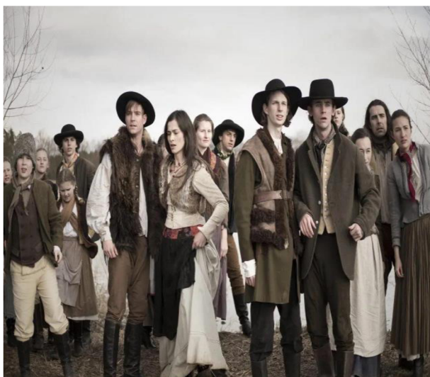
Příloha č. 3