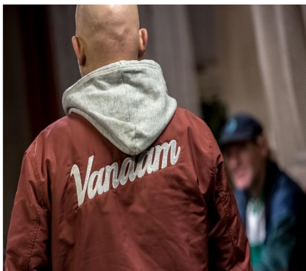
Příloha č. 6