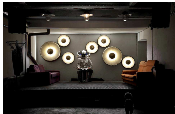
Obr. 11 Hospoda Schrott