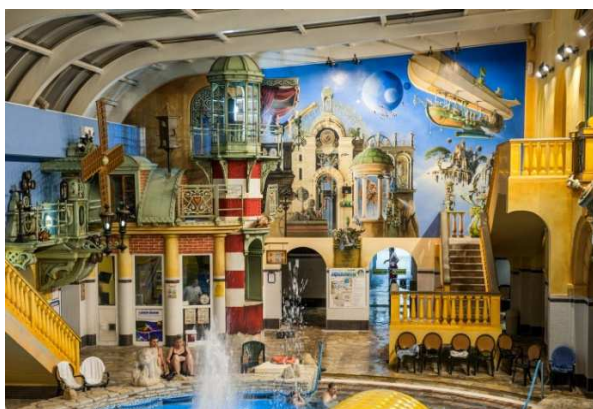
Obr. 7 Aquapark Babylon

V České republice zatím neexistuje mnoho míst, které by se pyšnily steampunkovým designem. V květnu 2015 se po odstávce znovuotevřel Aquapark Babylon v Liberci. Během odstávky bylo vylepšeno vzduchotechnické zázemí a filtrace zlepšující cirkulaci vody, ale zásadní změna se týkala hlavně designu interiéru. Dvojice autorů Rudolf Wronka a Iva Jirošová z uměleckého ateliéru Artklasik toto místo povýšili na katedrálu steampunku v Česku. (Pešek, 2015)