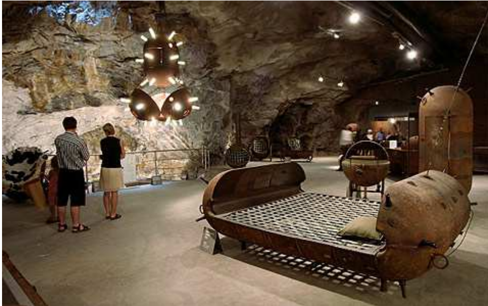
Obr. 27 Minový nábytek