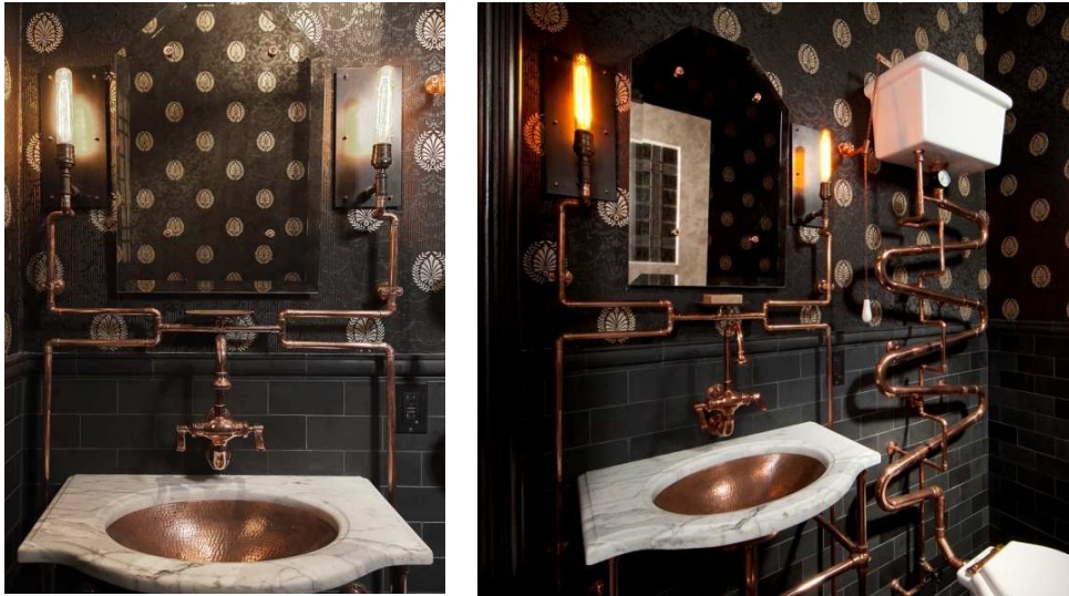
Obr. 19 Steampunková koupelna

Andre Rothblat je architekt ze San Francisca. V roce 2012 navrhl koupelnu pro steampunkové nadšence, jejichž dům je umístěn v Haight-Ashbury (centrální zóna v San Francisco). Architekt byl se steampunkem seznámen díky klientům, kteří ho s touto nabídkou oslovili. (Nightsdale, 2012)