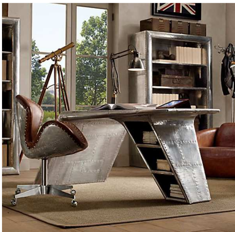
Obr. 22 Kolekce Aviator