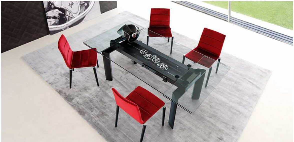
Obr. 20 Astrolab Dining Table

Jedná se o skleněný jídelní stůl světového distributora v oblasti designu Roche Bobis. Jedná se o rozkládací stůl s 12 mm tlustou skleněnou deskou, kterou lze po obou stranách rozšířit o 40 cm. Zajímavostí je že se rozkládá pomocí motorového mechanismu, který je zakombinován do konstrukce stolu a ovládá se pomocí dálkového ovladače. (Roche Bobois, 2016)