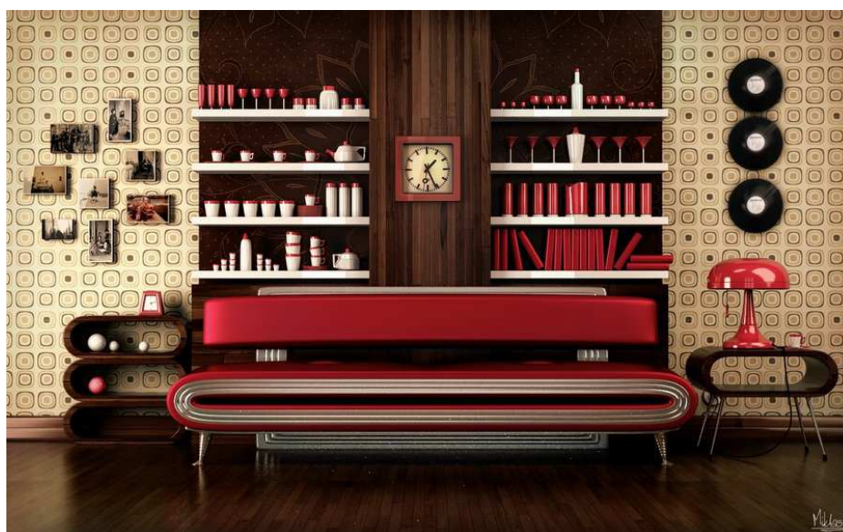
Obr. 14 Retro styl v interiéru

Retro styl ovšem spojuje výrazné barvy a tisky, nebo jemnější použití tapet s geometricky opakujícími se vzory. Na rozdíl od steampunku používá výraznější barvy a křivky, zejména pak kruhy a elipsy, kterými je inspirován i nábytek. Společné mají i používání repasovaných nábytků a doplňků v interiéru.