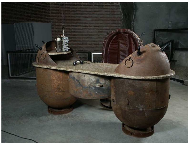
Obr. 3 Diesel punkový psací stůl

Třetím podžánrem steampunku je Diesel Punk, vycházející z meziválečného období až do roku 1950. Používá retro-futuristické prvky, jako například létající stroje a vzducholodě. Kombinuje hlavně estetiku dieslových technologií a postmoderní cítění. V roce 2001 ho vytvořil herní tvůrce a designér Lewis Pollak ve hře Children of the Sun, od té doby se objevuje v různých odvětvích umění, jako je hudba, filmy a hry. Dieselpunk v interiérech pak zastupují například staré miny ze začátku druhé světové války, které jsou použity jako krby, židle, nebo psací stoly. (Wikipedia, 2015)