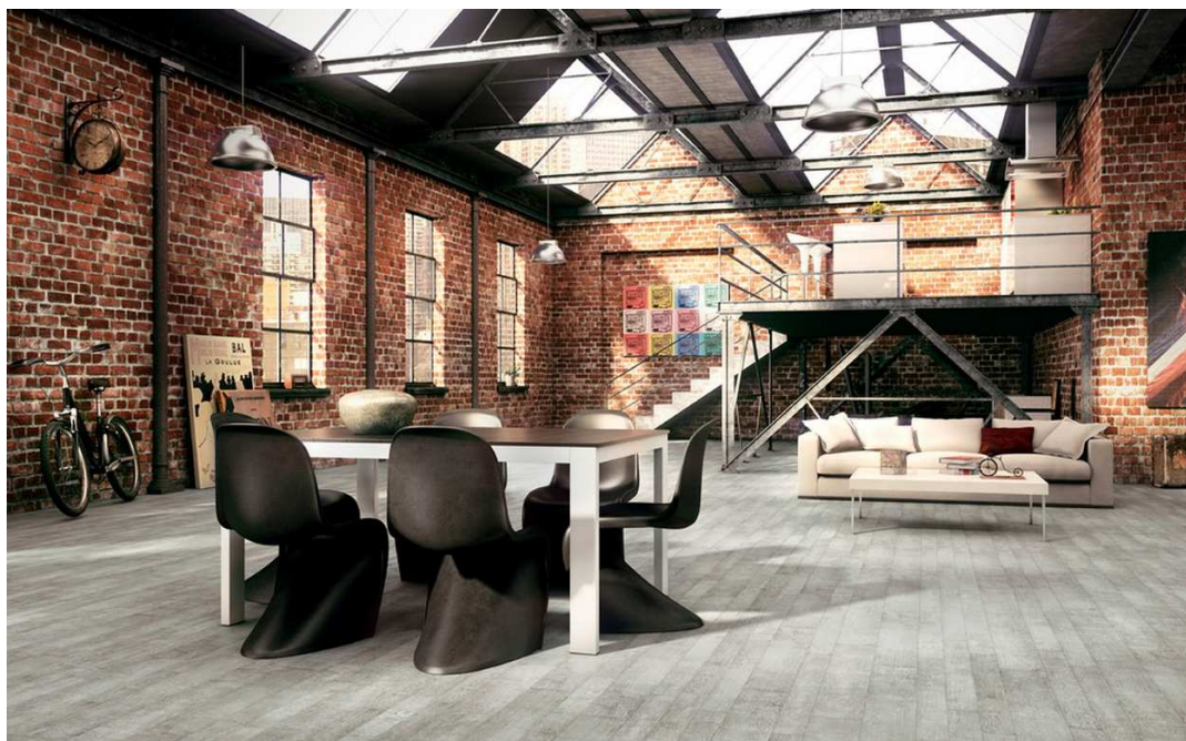
Obr. 12 Industriální interiér

Industriální styl je inspirovaný dobou pokročilé průmyslové revoluce v kombinaci s moderními designy. Na rozdíl od steampunku, páru a barevné kovy zde střídá elektřina a opotřebované strojní zařízení průmyslové výroby. Industriální interiéry se nechaly inspirovat průmyslovými provozy a továrními halami, proto se zde s oblibou používají loftové byty, nebo prostory s vysokými stropy.