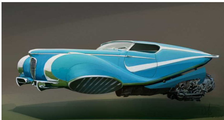
Obr. 1 Létající automobil

Mezi typické prvky steampunku patří parní a převodovková mechanika, dále viktoriánský styl oblékání, kutilství a romantika. Můžeme je nalézt v mnoha oblastech populární kultury, zejména jsou inspirací pro filmy, ale najdeme jimi inspirované i deskové hry, literaturu, či počítačové hry. (Donovan, 2013)