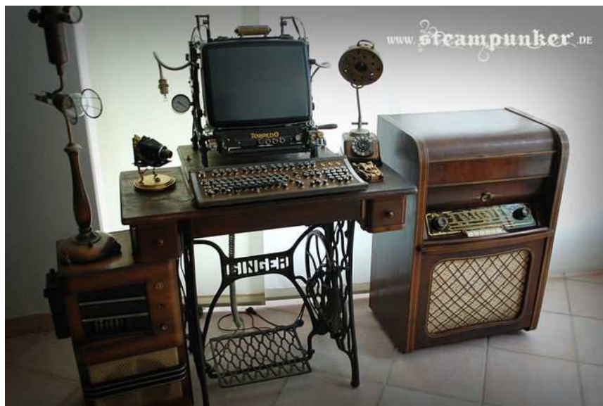
Obr. 25 Počítačový stůl od Alexander Schlesier

Alexander Schlesier je německý designér a CAD modelář, nadšenec steampunku. Narodil se v roce 1977 ve městě Plavno (Plauen, Německo). Vyrábí steampunkový nábytek, oblečení a nejrůznější doplňky a dekorace, které následně prodává na svém webu. Mimo tyto výrobky nabízí i zakázkovou výrobu, jako je například i výroba rekvizit pro filmovou a televizní reprodukci. (Steampunker, 2016)