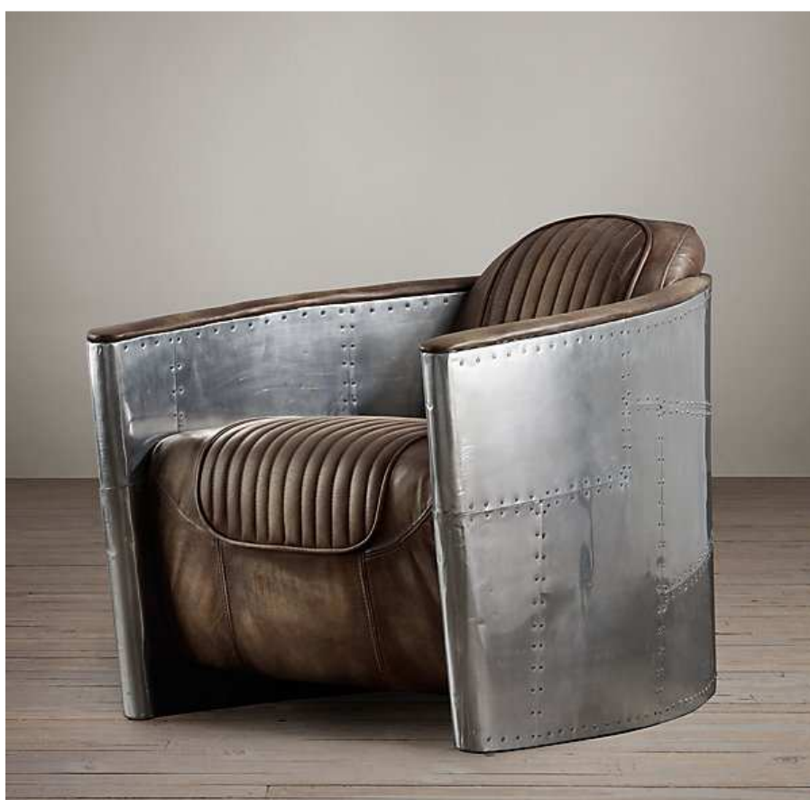
Obr. 21 Aviator chair

Toto křeslo s názvem Aviator chair (letecké křeslo) najdeme v sortimentu obchodního řetězce Restoration Hardware. Dirma byla založena roku 1979 v Kalifornii a v současné době působí na trhu v USA a Canadě.