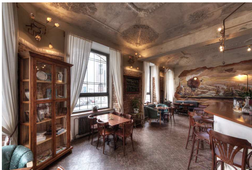
Obr. 9 Bar Progress

Tento bar a klub se nachází v Praze 3 na ulici Cimburkova. Podobně jako bar Stampunk Prague má i Progress bar dvě úrovně. Dominantou tohoto podniku jsou ručně malované prvky jako vzducholodě a převodková mechanika. Nachází se zde dřevěné stolečky a židle, kožené sedačky. Nad vrchní částí baru se po celé úrovni táhnou měděné trubky, které dokonale navazují na parní tematiku nakreslenou na zdech. Další zajímavostí tohoto baru je zdobený strop, který v kombinaci s cihlovými zdmi a malbami definitivně podtrhuje kouzlo tohoto baru.