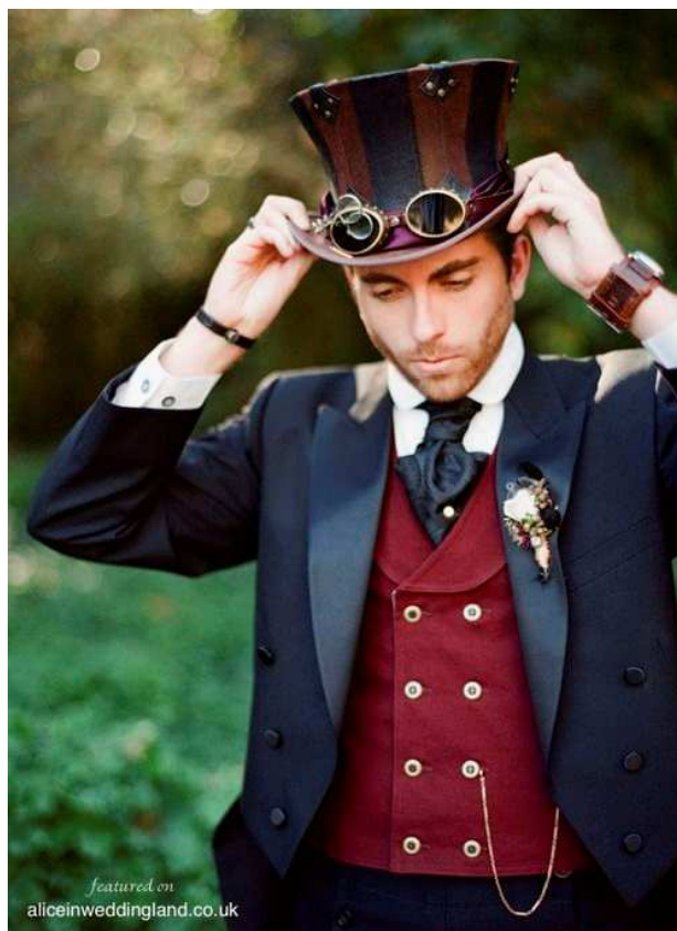
Obr. 5 Steampunková móda pro muže

Steampunk móda se vyvinula do nápaditého oblékání, které se inspiruje v estetice minulosti. Míchá dohromady moderní styly oblékání a oděvy z viktoriánské éry. Obvykle zahrnuje v dámském oblečení korzety, šaty a spodničky, nebo i halenky a sukně eliptického nebo kuželového tvaru. V pánském oblečení se objevují obleky a vesty, kabáty, cylindry, fraky a kamaše, nebo i vojensky inspirované oblečení.