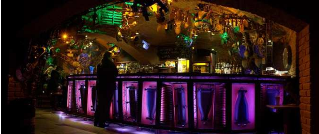
Obr. 10 Cross club

Klub se nachází v Praze na ulici Plynární. V klubu je trvalá expozice soch designéra Františka Chmelíka, jenž vznikly recyklací různých materiálů. Kouzlo jim dodává barevné osvětlení klubu ve výrazných barvách jako je zelená, červená a fialová. V horním patře klubu se nachází kavárna, která byla otevřená v roce 2009.