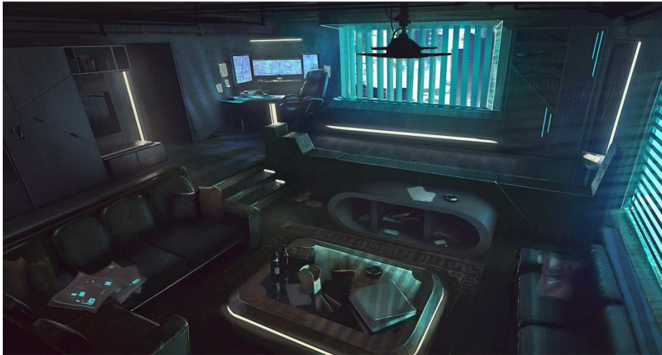
Obr. 13 Cyberpunk

Je podžánrem sci-fi, který vznikl dříve než steampunk. Je zde podobnost v názvu, která zároveň prvním slovem odlišuje oba dva styly. Zatímco steampunk klade důraz na převodovkovou a parní mechaniku v cyberpunku je místo páry použita kybernetika. Tento žánr je postaven na světě plném počítačů, přenosu informací a umělou inteligencí.