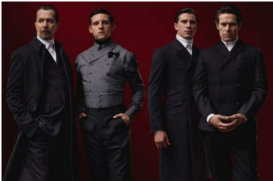
Obr. 6 Kolekce Prada

Obecně se o módě ví, že styly jsou cyklické. Co je populární v jedné z dekad je za nějaký čas z módy, a za několik let se opět vrací. V posledním desetiletí bylo velmi populární malé, krátké oblečení a nyní se začínáme vracet zpět ke konzervativnímu oblečení. Stále je to oblečení těsné, obepínající postavu, ale odhalování kůže už není tolik v módě, jako před několika roky. (Sirkin, 2013)