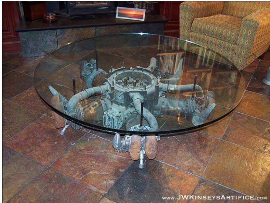
Obr. 16 Konferenční stůl od J.W.Kinsey

Dalším designérem, který navrhuje a vyrábí steampunkový nábytek a dekorace do interiéru je J.W. Kinsey. V současné době bydlí ve městě Silverton (Oregon) a steampunku se začal věnovat po roce 1990. V jeho portfoliu nalezneme řadu svítidel, cryptexů a různého nábytku.