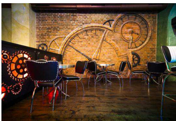
Obr. 8 Steampunk Prague

Je jedním ze tří steampunkových barů nacházejících se v Praze - Staré Město, vznikl v roce 2015 a jedná se o restauraci, bar a klub. Bar je rozdělený na dvě patra.