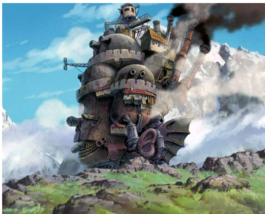
Obr. 4 Zámek v oblacích

množství magie a démonů. Miyazaki zde zobrazuje své technologické fantasy téměř okamžitě pochodujícím zámek. Stroj, který vypadá jako loděnice z 19. století, je jakoby transformován do tvaru různých zvířat, kráčejíci přes krajinu na kuřích nohách.