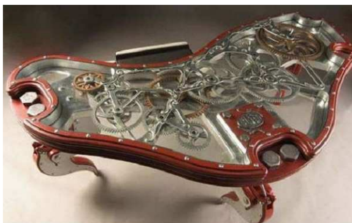
Obr. 2 Steampunkový konferenční stůl

Vyskytuje se zejména jako beletrie. Převládají zde převody a ozubená kola, která se objevují ve všech strojích nebo přenosných zařízeních, od toho je i odvozen název stylu Clock = hodiny. Vizuální styl čerpá zejména z renesanční a barokní éry, což znamená složité zdobení a řezbářské práce, jenž se vyskytují na strojích. Narozdíl od steampunku jsou jako další zdroje energie kromě páry použity i větrné a vodní mlýny. Často se uchyluje i k použití výstředních sil, jako je střelný prach, nebo dokonce funkční magie a alchymie. (VanderMeer, 2011)