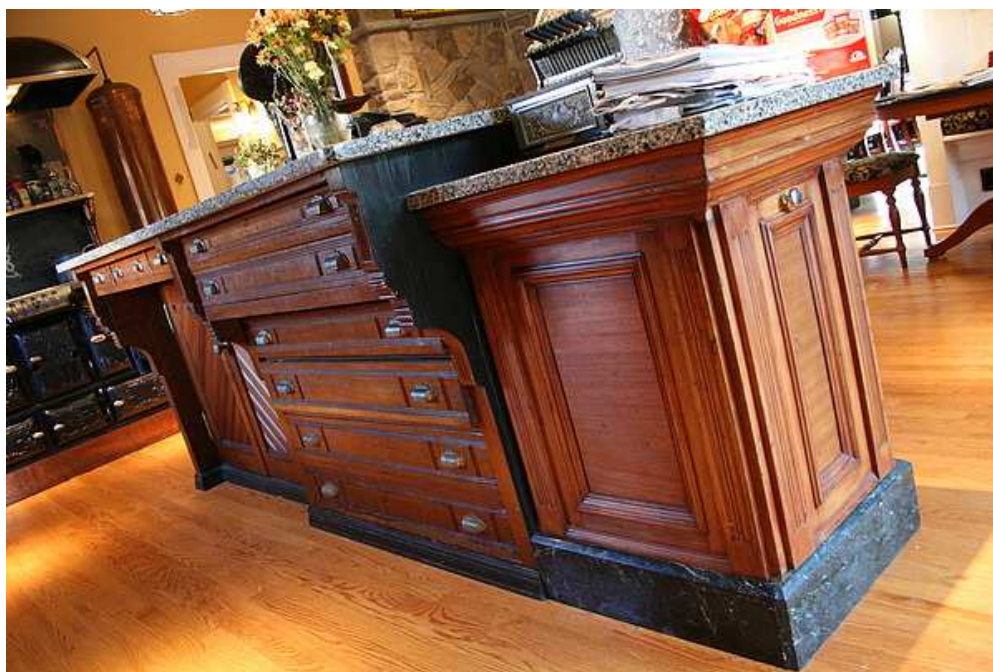
Obr. 18 Kuchyňský pult z tiskařského stolu

Bruceův dům byl postaven v roce 1901 a rekonstrukci ve steampunkovém stylu začali v roce 2007. V současné době obsahuje několik steampunkových doplňků a nábytku. V jídelně se nachází opravený viktoriánský ohřívač, v kuchyni starý sporák, který byl vyčištěn a natřen. Dominantou kuchyně je starožitný tiskařský stůl, jelikož nebyl tak široký aby vyplnil prostor doplnili jej o podstavec z dívčí školy poblíž Bostnu. V obývacím pokoji instalovali do křbové vložky moderní elektroniku jako je televize a DVD přehrávače. (Slatt, 2010)