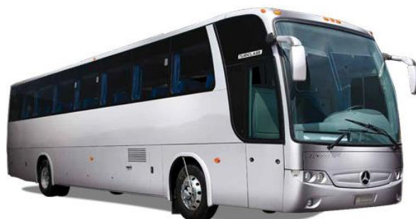
Obrázek 9 Autobus

pro druhého řidiče. Ceník společnosti za dopravu je uveden níže v tabulce č. 12. A na obrázku č. 9 je obrázek autobusu. (Charous, 2016)