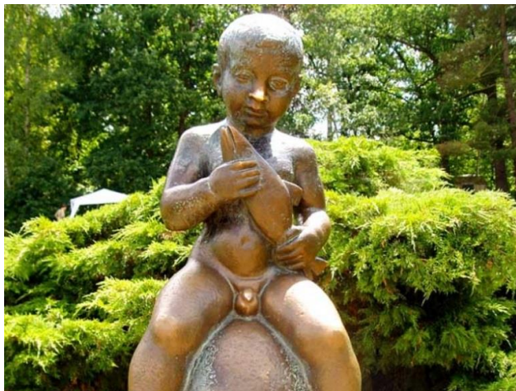
Obrázek 4 František, Františkovy Lázně

zobrazeno na obrázku č. 4, o které se praví, že když se ho žena dotkne na intimních partiích, do roka otěhotní. Bohužel originál sochy je dnes umístěn v muzeu, protože byl několikrát poničen. U Františkova pramene dnes stojí pouze kopie. V lázních se tedy kromě ženských chorob léčí i onemocnění srdeční, cévní a pohybové. Nejznámější je Františkův pramen, o kterém jsou dochovány zmínky již od roku 1406. Lidé se tedy k pramenu sjíždí od této doby, ale první stavení bylo u pramene postaveno až kolem roku 1650.