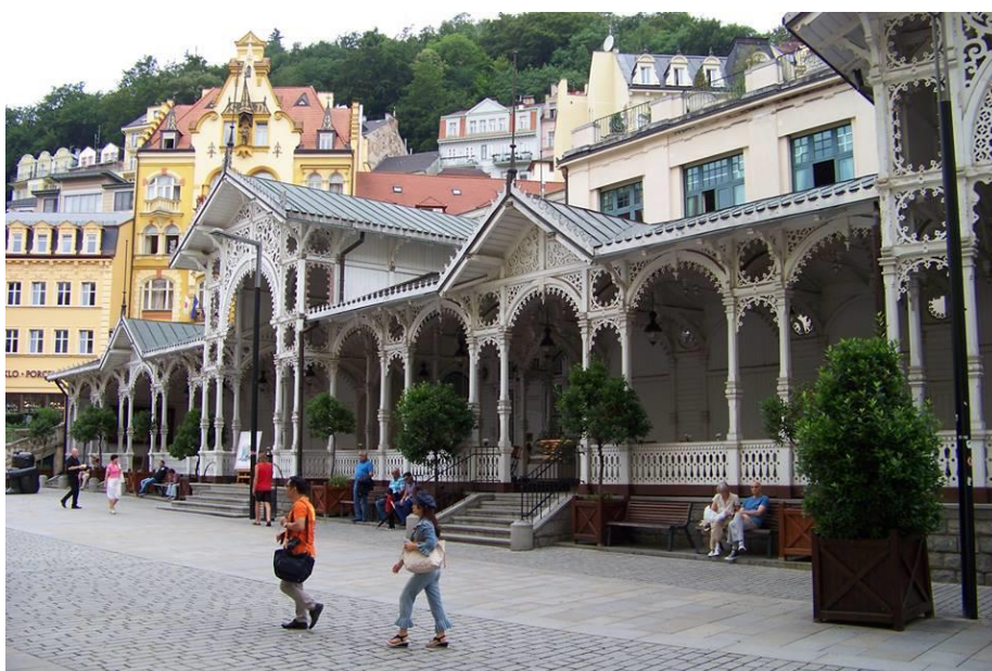
Obrázek 1 Tržní kolonáda, Karlovy Vary

Tržní kolonáda. Druhá ze třech kolonád, postavena ve švýcarském stylu. Tato řezbami bohatě zdobená kolonáda byla postavena v letech 1882 – 1883 v přesných místech, kde se kdysi léčil Karel IV. Kolonáda byl projekt vídeňských architektů Fellnera a Helmera. V letech 1904 – 1905 byla kolonáda prodloužena nad vývěr Tržního pramene. Dnes tedy kolonáda kryje tři léčivé prameny. Pramen Karla IV., Dolní zámecký pramen a Tržní pramen. Pramen Karla IV. se dříve jmenoval pramen Žrout. Po vyléčení nohy Karla IV. byl přejmenován. Tržní kolonáda je zobrazena na obrázku č. 1. (Infocentrum města Karlovy Vary, 2015)