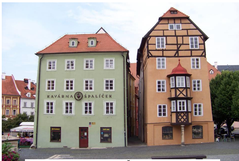
Obrázek 8 Špalíček

Špalíček. Jedná se o soubor 11 – ti domů ze 13. století. Dříve byly domy dřevěné, ale zničené požárem. V roce 1320 byly nahrazeny domy zděnými s gotickými, renesančními a barokními rysy. Špalíček zobrazuje obrázek č. 8. (Homolová, Karásek, 2005)