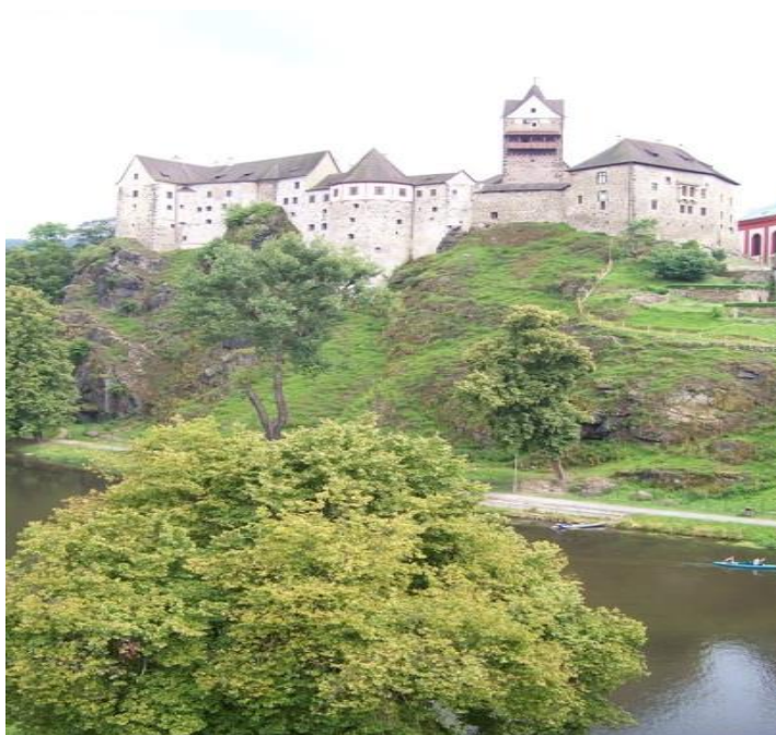
Obrázek 5 Loket

V roce 1319 se hrad Loket stal domovem Elišky Přemyslovny s králevicem Václavem, tehdy tříletým Karlem IV. Karel IV se sem později vracel jako panovník. Za jeho vlády byl hrad rozšířen. Úpadek hradu nastal po 30 – ti leté válce a v roce 1725 zde byl veliký požár. Gotický objekt byl tedy renesančně přestavěn. Části zdí připomínají původní opevnění města. Součástí je také barokní radnice, kostel sv. Václava nebo kaple sv. Anny zachována z roku 1745. Hrad Loket je zobrazen na obrázku č. 5. (David, Soukup, 1999)