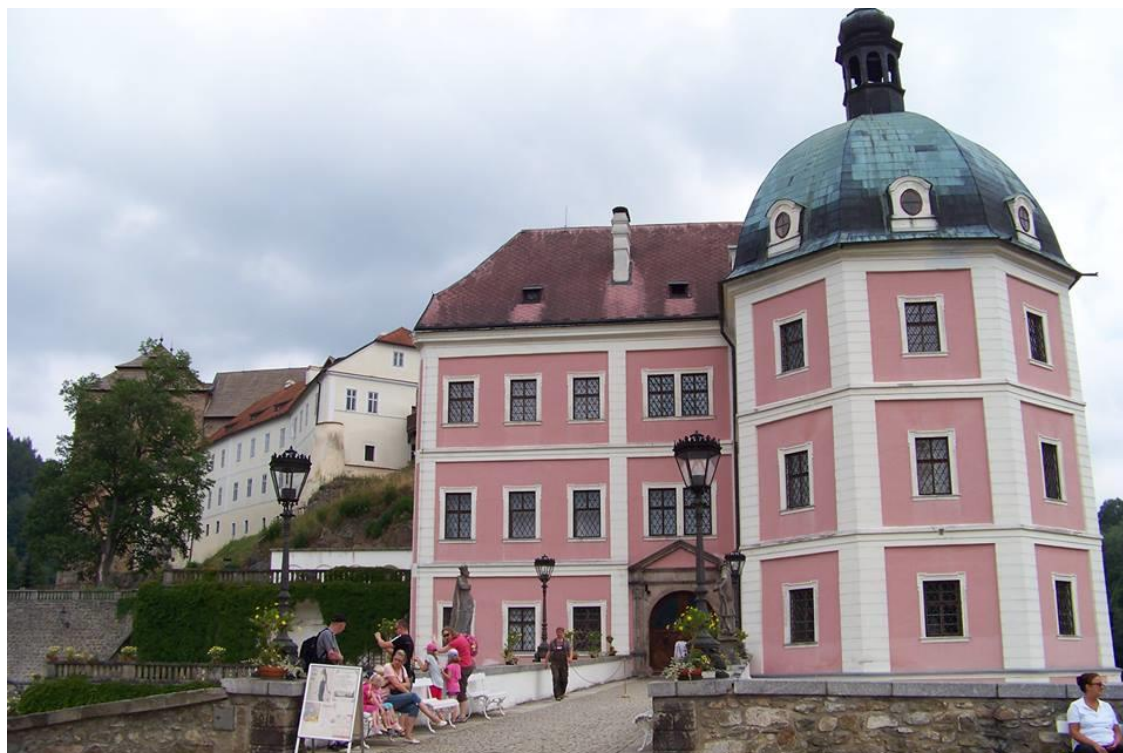
Obrázek 6 Zámek Bečov nad Teplou

První dohledatelná zmínka o hradu je z roku 1349. Hrad byl tedy stavěn ve 14. století a to ze dřeva. Pánové na hradě získávají jmění z těžby cínu ve Slavkovském lese. Na hradě se ale za celá léta vystřídal mnoho rodů. Zámek vznikl až v 18. století za vlády rodů Questenberků. V roce 1838 byl zakoupen Relikviář sv. Maura, díky kterému je celý komplex v Bečově nad Teplou znám. Relikviář zakoupil Alfred Beaufort-Spontin. Dále také nechal opravit bečovské sídlo a také zámeckou kapli sv. Petra. Zámek později sloužil jako škola, a hrad jako muzeum. V roce 1969 celý hrad a zámek získal plzeňský památkový ústav a pustil se do rekonstrukce. Práce byly dokončeny v roce 1996, kdy byl barokní zámek zpřístupněn veřejnosti. Celé první patro je věnováno románskému relikviáři sv. Maura a druhé patro je použito pro zámeckou expozici. Zámek Bečov nad Teplou je zobrazen na obrázku č. 6. (Zámek Bečov nad Teplou, 2015)