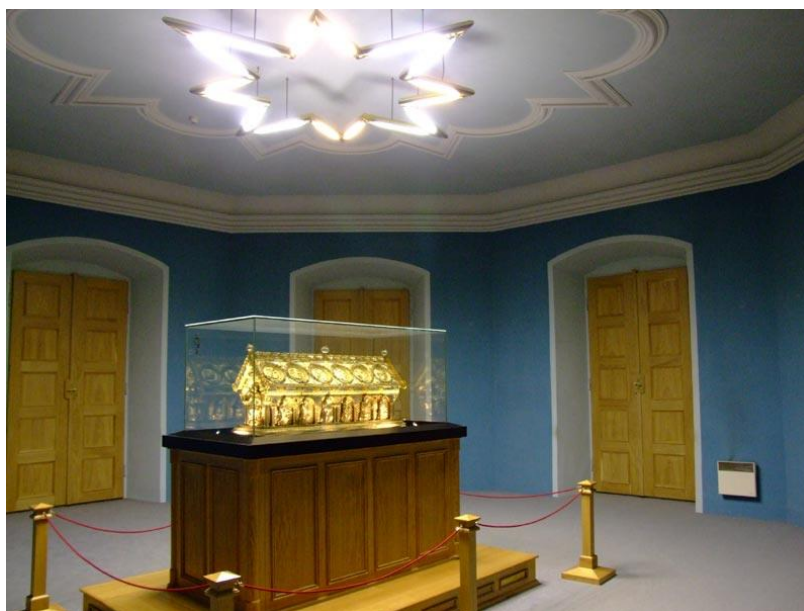
Obrázek 7 Relikviář sv. Maura

Relikviář sv. Maura. „Relikvirář sv. Maura je vynikající památkou středověkého zlatnického umění a zároveň velkým projevem křesťanské víry a úcty ke svatým ostatkům.“ (Šidlovský a kol., 2014) Za relikvií se považuje pozůstatek těla zemřelého světce. Relikvie jsou vystavovány na obdiv ostatním a je třeba vytvářet důstojné schránky pro ně. Dříve se schránky vyráběli třeba ze dřeva, ale později z drahých látek, zdobené drahými kameny a perlami. Nejkrásnější schránky vznikali ve 12. a 13. století, ze které pochází i relikviář sv. Maura. Přesněji vznikl těsně před rokem 1220. Relikviář byl zhotoven pro ostatky sv. Jana Křtitele a svatých mučedníků Maura, Timoteje a Apolináře. Dřevěné jádro relikviáře je zdobeno zlacenou mědí, zlaceným stříbrem, filigrány a drahými kameny. V čele relikviáře je postava Ježíše Krista. Druhou dominantní postavou je sv. Maur. Po obou stranách relikviáře jsou sošky apoštolů. Relikviář je zobrazen na obrázku č. 7. (Šidlovský a kol., 2014)