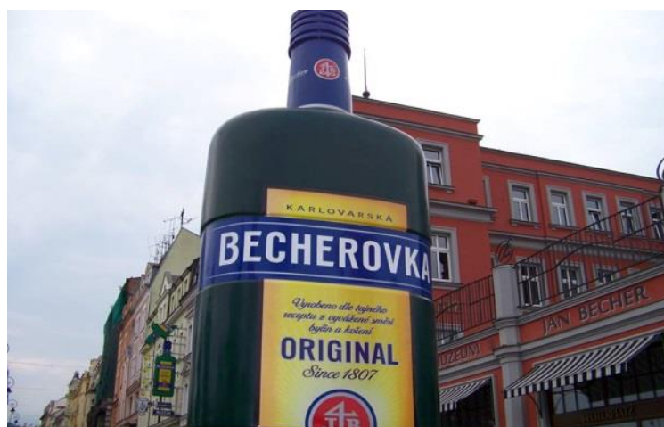
Obrázek 2 Muzem Jana Bechera

Jan Becher Muzeum. Během prohlídky muzea je možné navštívit výrobní a sklepní prostory muzea. Muzeum je postaveno na místě odkud Becherovka více, než sto let pramenila. Původní továrna odkud byla Becherovka rozvážena do celého světa, byla postavena roku 1867. Na obrázku č. 2, je k vidění zvětšená velikost lahve Becherovky, která stojí před muzeem. (Infocentrum města Karlovy Vary, 2015)