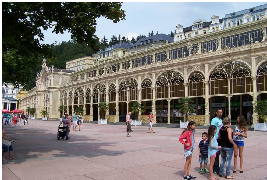
Obrázek 3 Litinová kolonáda Mariánské lázně

lichou hodinu jednu z osmi skladeb. Ve večerních hodinách navíc s doplňujícím osvětlením. Ve městě se dále nachází kolonáda Karolinina pramene, Lesního pramene a Ferdinandova pramene. Litinová kolonáda je zobrazena na obrázku č. 3. (David, Soukup, 2005)