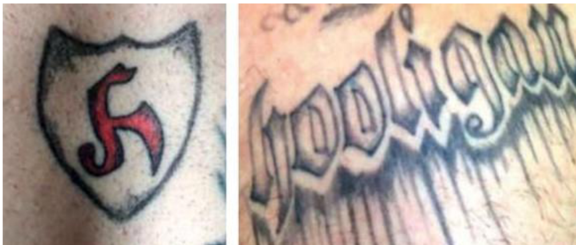
Obrázek č. 4 - symbolika znaků Hooligans 4

zdroj: VEGRICHTOVÁ B., Symbolika kriminálního tetování, 2. vyd. Plzeň: Vydavatelství a nakladatelství Aleš Čeněk s.r.o., 2018. 234 s. ISBN 978-80-7380-693-4, s 154