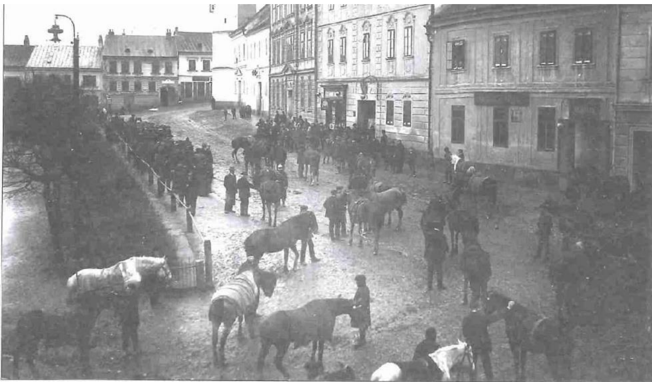
Klasifikace koní v Dačicích 344