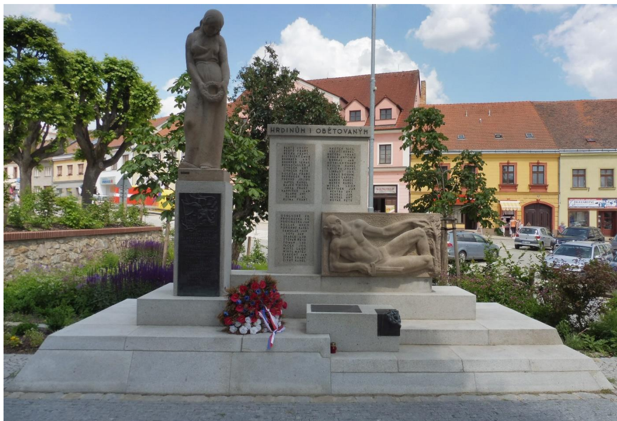
Pomník obětem válek v Dačicích 348

(vlevo deska obětem okupace, v pozadí pomník obětem 1. světové války, v popředí pamětní deska obětem holokaustu)