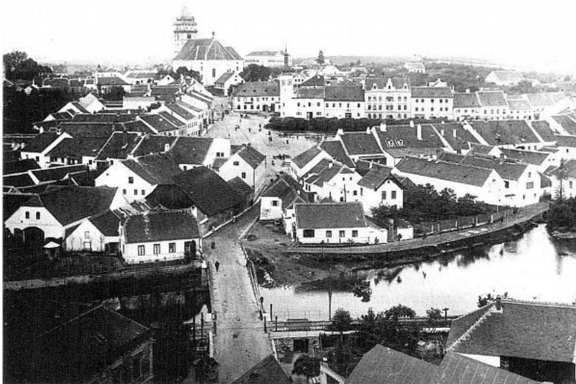
Pohled na Dačice po roce 1910 343