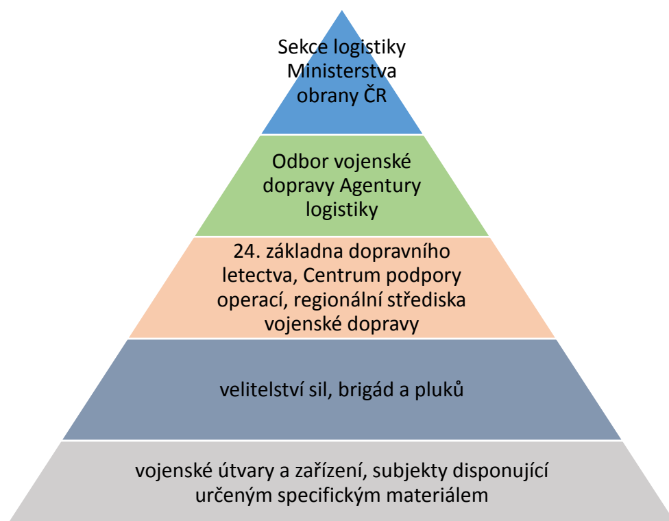
Graf 4. 1 Přehledová struktura orgánů vojenské dopravy

V následujícím grafu je znázorněna navrhovaná struktura orgánů vojenské dopravy z hlediska úrovně odborného řízení (Graf 4.1 Přehledová struktura orgánů vojenské dopravy). Z grafu vyplývá, že nejvyšší úroveň v systému představuje Sekce logistiky Ministerstva obrany ČR, jíž je podřízen Odbor vojenské dopravy Agentury logistiky. Další úroveň představují 24. základna dopravního letectva, Centrum podpory operací, a regionální střediska vojenské dopravy. Následují velitelství sil, brigád a pluků a v jejich podřízenosti určené útvary a zařízení.