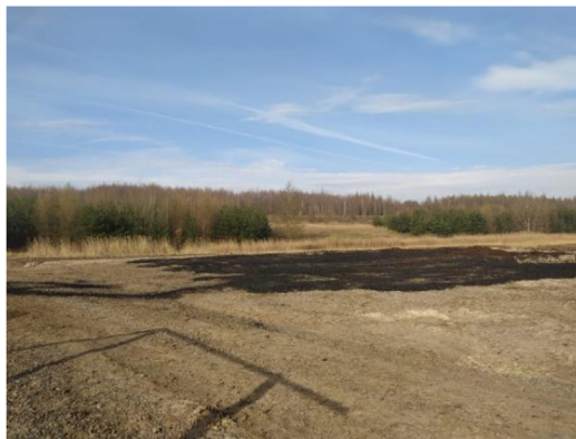
Obrázek č. 5: Aplikace aditiv