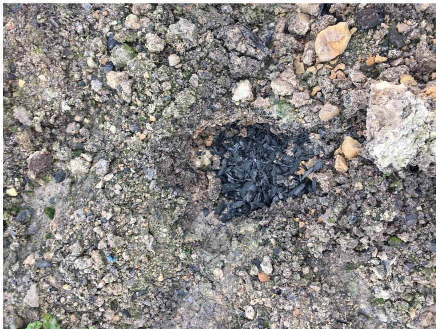
Příloha č. 5: Aplikace biouhlu do jamek v rámci lesnické rekultivace.