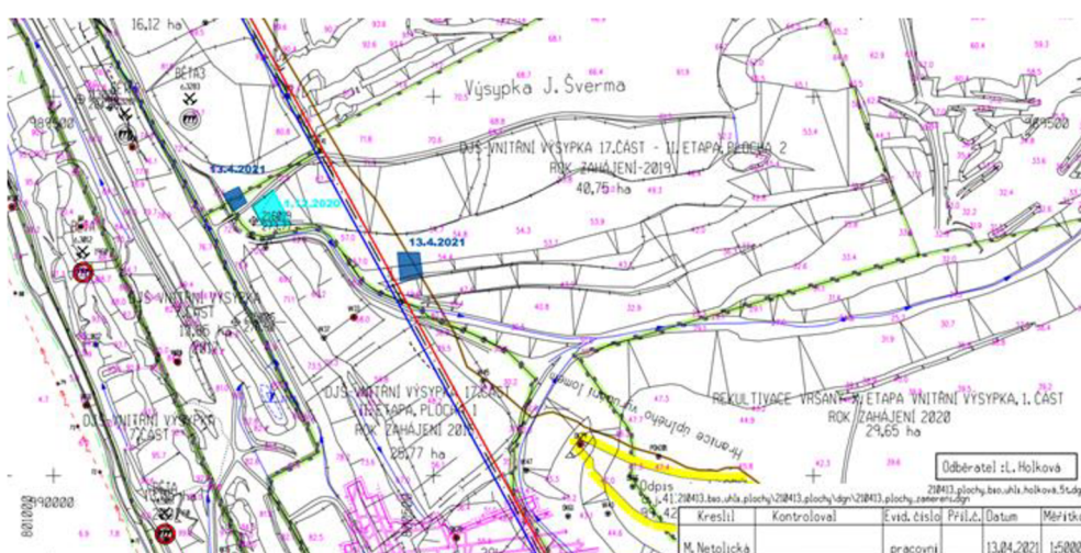
Obrázek č. 1: Vymezení studijních ploch v terénu výsypky DJŠ (Vršanská uhelná, 2021).

Na studijní lokalitě hnědouhelného lomu Vršany byly za koordinace techniků Vršanské uhelné a.s. vybrány budoucí studijní plochy, které byly projektově připraveny k zahájení biologické rekultivace. Součástí této diplomové práce jsou dvě studijní plochy. Jejich vymezení prezentuje obr. č. 1 a 2.