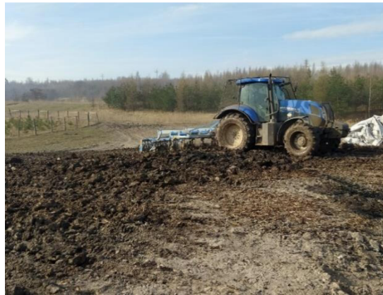
Obrázek č. 7: Použitá agrotechnika