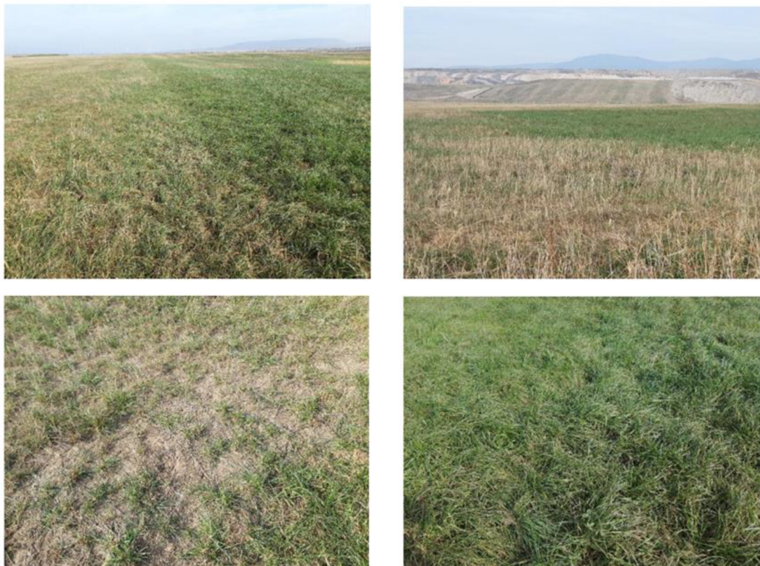
Obrázek č. 10: Dokumentace stavu travního porostu v prvním roce osevního systému. Vpravo nahoře zřetelná hranice mezi studijní (tmavě zelená – vpravo) a kontrolní lokalitou.

zachycuje také hustší porost na studijní ploše (fotografie vpravo dole) ve srovnání s neošetřenou plochou, kde již biomasa usychá. Lze tak usuzovat na nižší vlhkost v půdě.