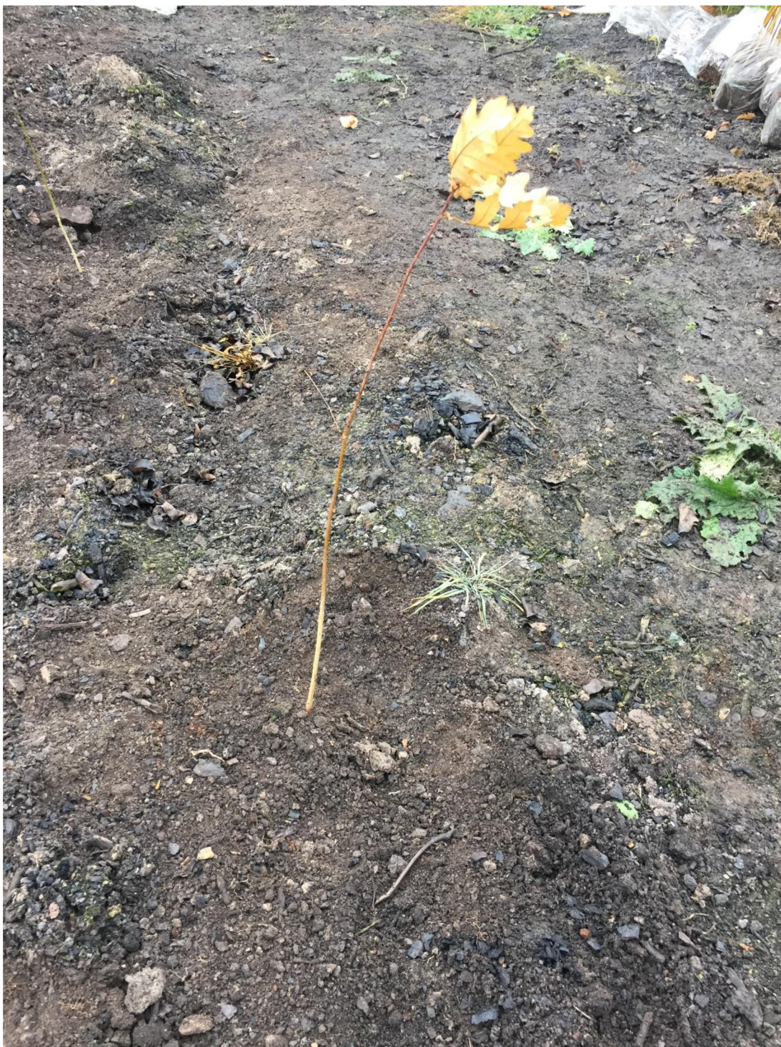
Příloha č. 7: Zasazení sazenice do jamky s biouhlem.