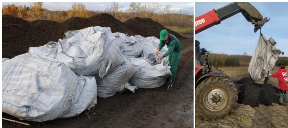
Obrázek č. 3: Dopravení biouhlu do lomu v bigbecích.

Aplikace biouhlu byla náročná. Prozatím s velkoplošnou aplikací neměl u nás nikdo příliš doporučující zkušenost. Panovala obava, aby nebyl při roztrhnutí vaků jemný a ještě suchý materiál odvanut. Nakonec se ale vše zdárně vydařilo.