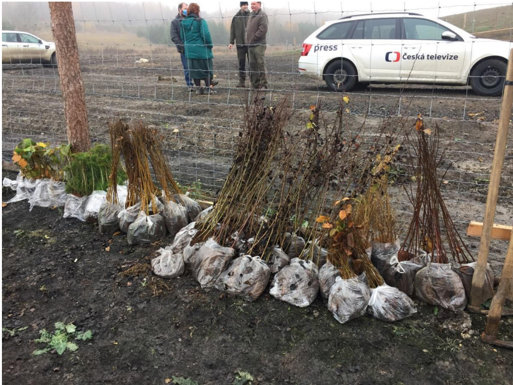
Příloha č. 4: Připravené sazenice listnatých stromů.