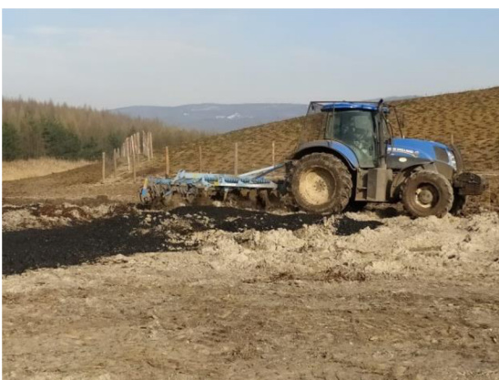
Obrázek č. 6: Použitá agrotechnika