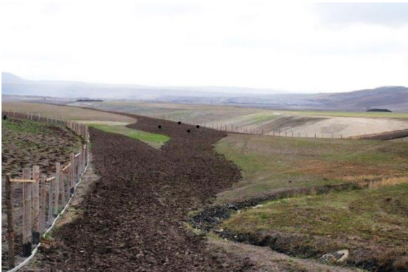
Obrázek č. 4: Aplikace aditiv na studijní plochu