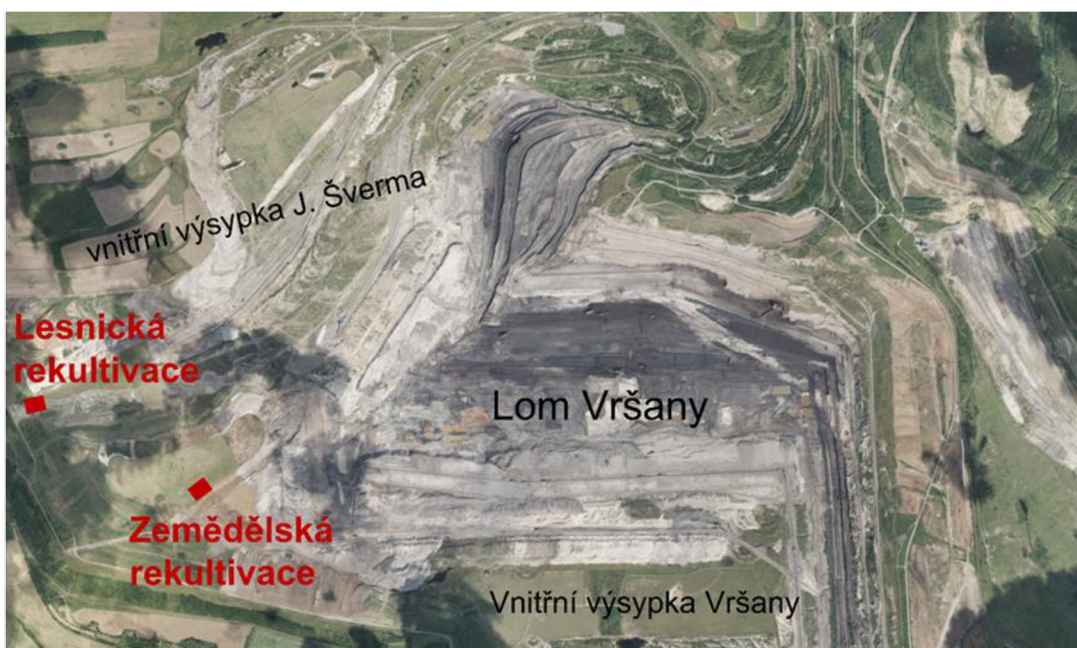
Obrázek č. 2: Zákres studijních ploch ve vazbě na provedené rekultivace výsypek lomu Vršany/Šverma, ortofoto ze srpna 2021 (Vršanská uhelná, 2021).

Terénní úpravy byly provedeny již během roku 2019. Připraveny byly dvě půdní aditiva, jejichž efekt měl být posuzován: biouhel a kompoChar. Podmínkou experimentu bylo, aby veškeré práce byly prováděny na studijních plochách shodně jako na kontrolních studijních plochách, co se času a péče týče. Studijní plochy měly rozlohu cca 900 m 2 (cca 30x30 m).