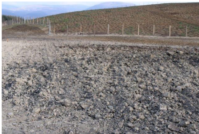
Obrázek č. 8: Výsledek postupu aplikace aditiv na studijní plochu