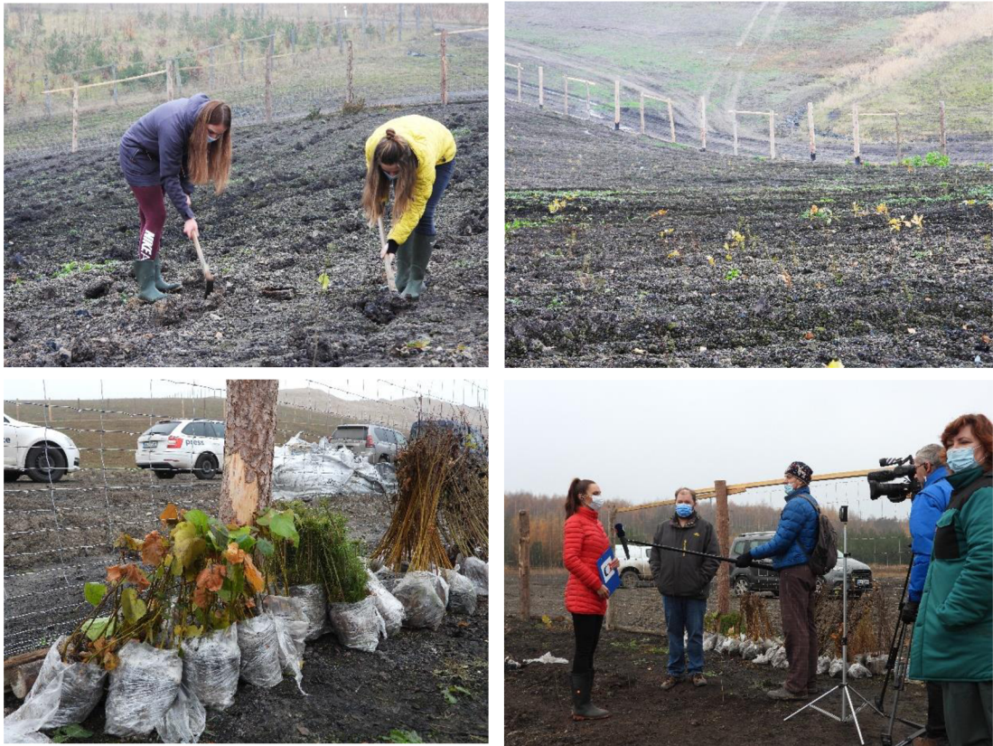
Obrázek č. 9. Výsadba sazenic v rámci lesnické rekultivace za účasti štábu České televize.