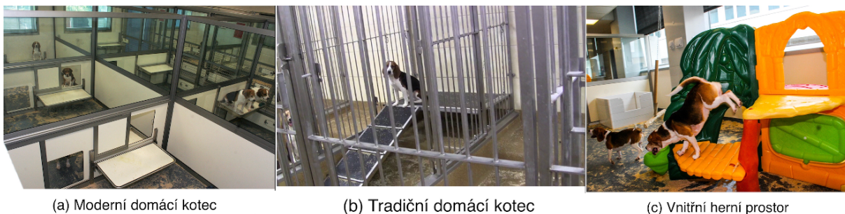
Obr. 1: Design psích (a) moderních domácích kotců, (b) tradičních domácích kotců a (c) vnitřních herních prostor v laboratorních podmínkách. Převzato z Scullion Hall et al. (2017)

Samostatným typem ustájení je chov psů v chovatelských stanicích, útulcích nebo laboratořích (Obr. 1). Nejčastějším typem ustájení těchto psů jsou kotce, buď vnitřní nebo venkovní. V obou případech se jedná o budovu rozdělenou mřížemi či pevnými zástěnami na jednotlivé kotce. Venkovní a vnitřní část bývá oddělena gilotinovými dveřmi (Obr. 2). První model může mít propojenou venkovní a vnitřní část. V těchto případech má každý kotec svoji oplocenou venkovní část. Druhý model má pouze vnitřní část a venku bývá oplocený společný prostor pro všechny psy (Stafford 2007; Cavill 2008; Wagner et al. 2014; Walker et al. 2014; Clark 2021).