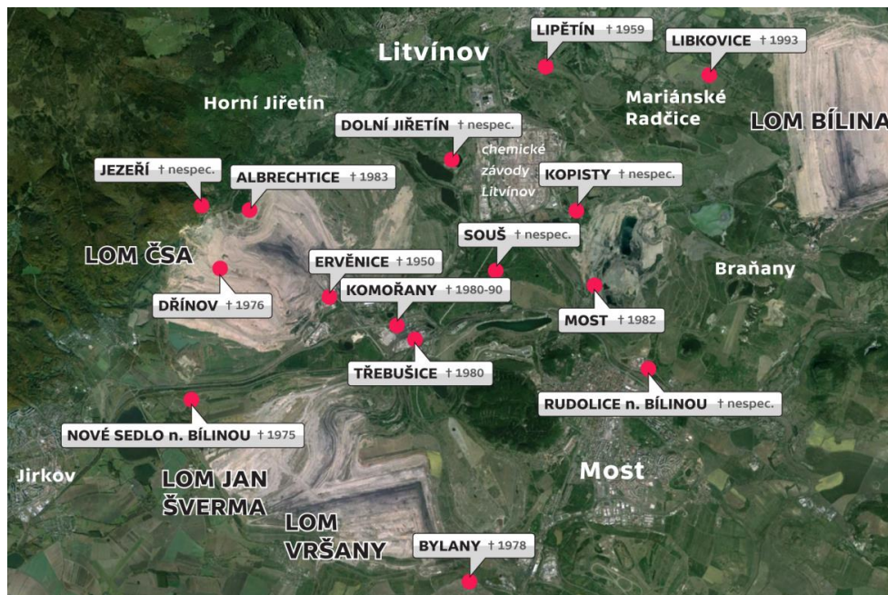
Obrázek 3 Zaniklé obce v důsledku těžby uhlí