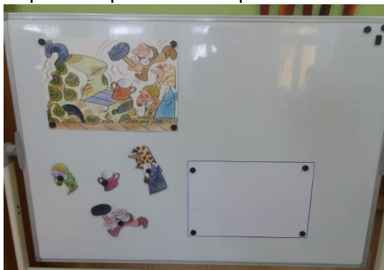
Připravená předloha k doplňování