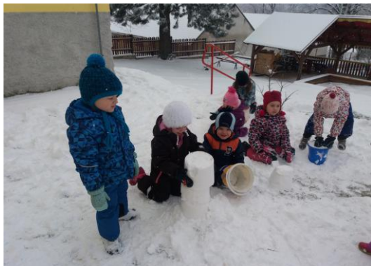
Stavba pecí ze sněhu