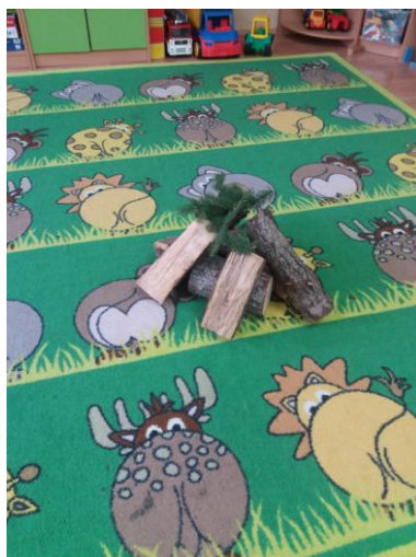
Připravená hromádka dřeva