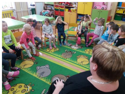
Hra: „Běží liška...“