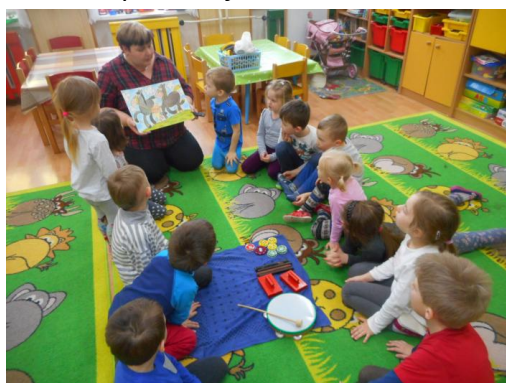
Co potřebuje zvíře k životu?