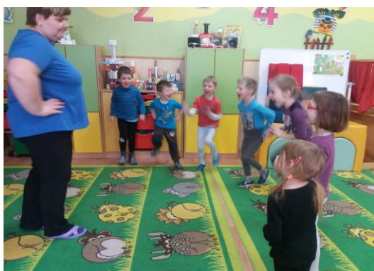
„Navaděč“ – kolektivně