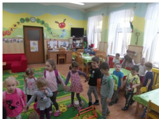
„Přiznání“ v kruhu