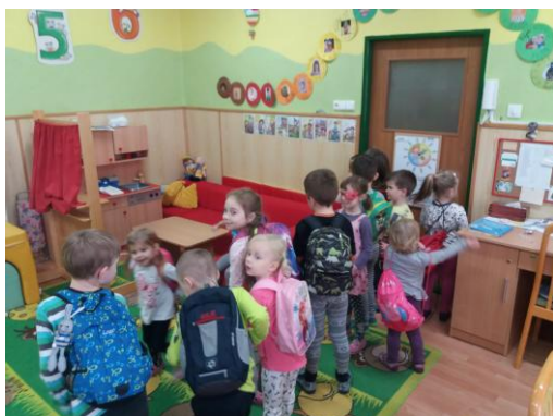
Zpívání po divadélku