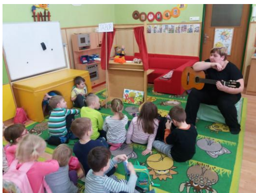
„Lišce bych řekl...“