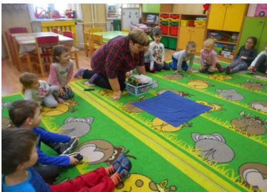
Koš s překvapením