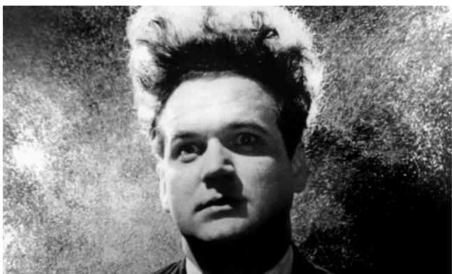
Obrázok 6: Jack Nance, Eraserhead