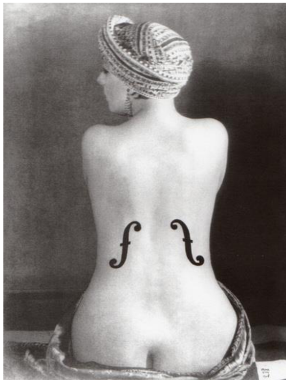
Obrázok 3: Le Violon d'Ingres , Man Ray 1924

Man Ray vo svojej tvorbe ukázal experimentálny prístup k fotografii, ktorý odzrkadľoval záujem surrealistov o porušovanie pravidiel. Bol tiež vynikajúcim spolupracovníkom, ktorý pracoval po boku svojich priateľov a kolegov umelcov. Jeho vášnivé vzťahy so ženami viedli k vytvoreniu niektorých z najironickejších portrétov a štúdií aktov v histórii fotografie. Okrem toho bol maliarom, sochárom a tvorcom asambláží. Jeho diela sú charakteristické neustálou kreativitou. 18