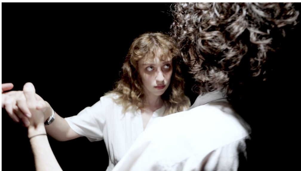
Obrázok 9: Finálna scéna

Ďalšia z techník ktorú som zvolil boli symbolické kostýmy a make-up. Neprirodzený make-up postáv, v prípade mojej práce kruhy pod očami, ktoré boli nereálne pretiahnuté, vytvárali výzor postáv ako keby boli slabé alebo choré. Využíval som taktiež udržiavanie nejasných motivácií postáv, aby divák bol zahrnutý do faktoru nepredvídanosti čo spôsobuje nepríjemný pocit až strach.