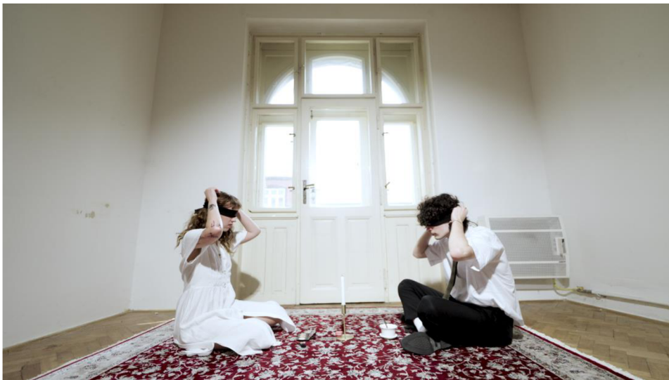
Obrázok 7: Scéna 1

díváka mätúco až nepríjemne. Rôzne príklady som si zobral z filmov od režisérov ako je napríklad David Lynch. Využíval som techniky ako je použitie dramatického osvietenia, kde v obraze máme viac tieňov než svetla. V 1. scéne som využíval kombináciu denného svetla s žiarovkovým. V 2. scéne som svetlo umiestnil priamo nad hercov aby sa im vytvorili kruhy pod očami z tieňu svetla. Výrazné kontrasty medzi svetlom a tmou môžu prispieť k nepríjemnému pocitu, ktorý to môže evokovať. Dôležité bolo taktiež dodržať čistú tmú v pozadí, čo som dosiahol izoláciou svetla skrz odrazové alebo tmavé dosky. Bolo dôležité aby lúče svetlá nedopadali na pozadie.