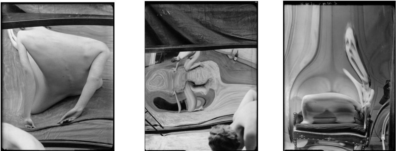
Obrázok 4: Distortions , André Kertész

V roku 1933 André Kertész vytvoril sériu s názvom “Distortions of the human body,” kde vytvoril celkovo 200 fotografií ženských aktov pomocou deformujúceho sa zrkadla, pričom experimentoval s rôznymi kompozíciami.