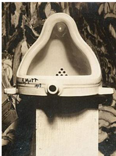
Obrázok 1: Fountain, Marcel Duchamp 1917

barónka Elsa von Freytag-Loringhoven bola pôvodnou autorkou tohto diela. Hoci veľká časť "dôkazov" podporujúcich tieto tvrdenia bola vyvrátená, toto zostáva predmetom diskusie. 10