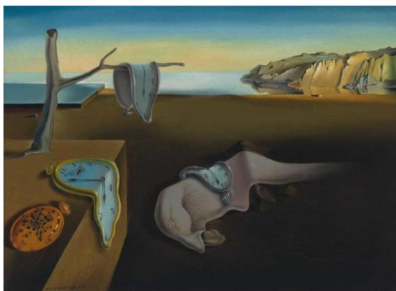
Obrázok 2: La persistència de la memòria , Salvador Dalí

Salvador Dali je asi najznámejší surrealistický umelec, známy podľa jeho bizarných a úchvatných obrazov. Daliho precízny, realistický maliarsky štýl kombinovaný s fantastickými prvkami stelesňuje cieľ surrealizmu spojiť realitu so svetom snov. Daliho hlavný teoretický príspevok k surrealizmu bol v 30. rokoch jeho rozpracovanie "paranoicko-kritickej metódy" – procesu, ktorým chcel "systémovo vytvárať zmätok a tým prispievať k úplnému diskreditovaniu reality." Metóda popisovala úmyselne dezorientovaný stav mysle, ktorý umožnil jednotlivcovi spájať nesúvisiace veci a otvárať nové cesty myslenia a tvorby. V tom istom čase tiež publikoval niekoľko esejí, kde pomenoval a definoval tzv. "surrealistický objekt." 12