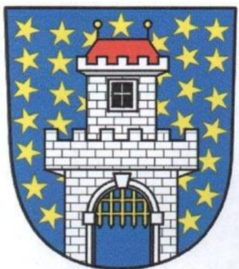
Obrázek č. 3 – Znak města Borohrádek