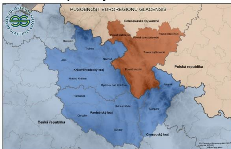
Obrázek č. 1 – Mapa Euroregionu Glacensis