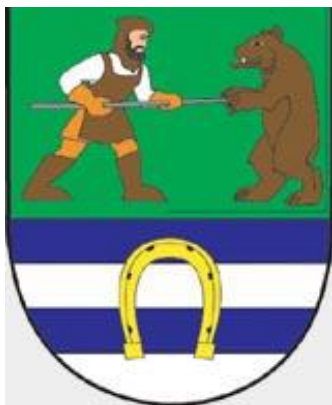
Obrázek č. 5 – znak města Lánov