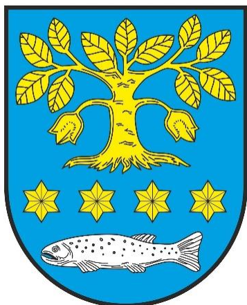
Obrázek č. 7 – Znak městyse Mladé Buky