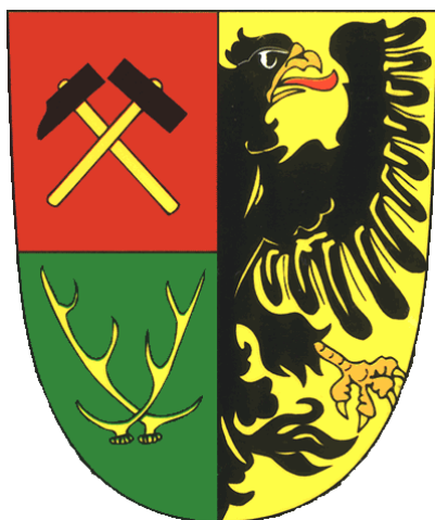
Obrázek č. 8 – Znak města Svoboda nad Úpou