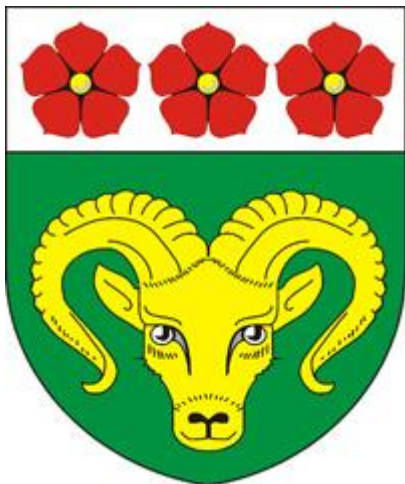
Obrázek č. 6 – Znak města Meziměstí