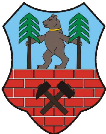
Obrázek č. 9 – Znak města Žacléř