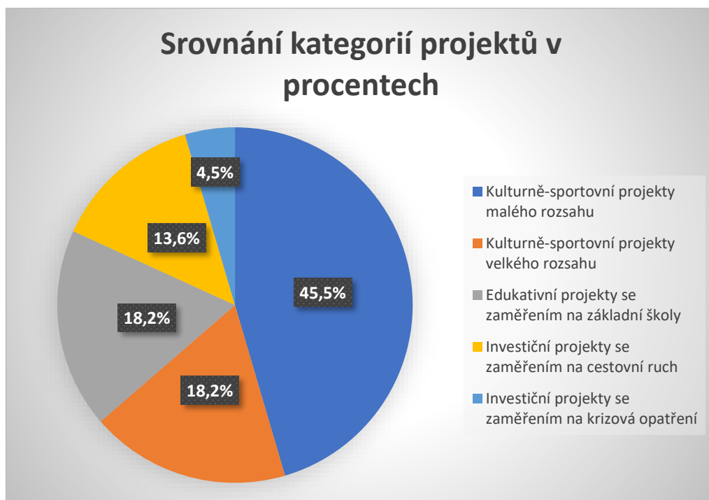
Graf č. 1 – Srovnání kategorií projektů v procentech