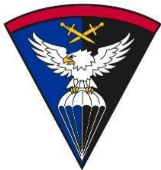
Obrázek č. 1 – Znak ÚRN 1

S rozumem a odvahou. To je motto ÚRN, které vystihuje potřebné vlastnosti příslušníků útvaru.