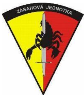
Obrázek č. 2 – Znak Zásahové jednotky KŘP Hl. m. Prahy 6

Sucus intra leges – v rámci zákona. Takto zní motto zásahové jednotky KŘP hl. m. Prahy. S tím jak se vyvíjela kriminalita na území hlavního města Prahy, tak se musela vyvíjet i PČR. Je bez pochyb, že na území hlavního města Prahy je zvýšená hustota obyvatel na daném území, kdy třeba na sídlištích je vysoká anonymita osob a i z těchto důvodů je těžší odhalovat protiprávní jednání pachatelů. Na teritoriu hlavního města Prahy se vyskytuje vysoká migrace obyvatel, kdy lidé často do Prahy dojíždí za prací anebo za sportovními/kulturními událostmi. Z těchto důvodů je kriminalita na území hlavního města velmi vysoká a zásahová jednotka KŘP hl. m. Prahy je kvůli výše zmíněným faktorům často nasazována.