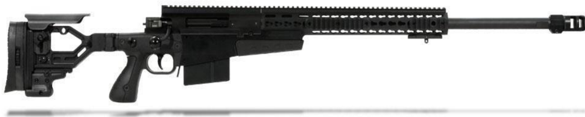
Obrázek č. 11 - Accuracy International AXMC 338 Lapua Magnum 35

Opakovací odstřelovací puška od britské firmy Accuracy International, model AXMC 338, ráže 338 Lapua Magnum je puška určená pro přesnou střelbu. Ke zbrani existuje mnoho příslušenství. Tyto odstřelovací pušky byly zařazeny do výzbroje u ÚRN v posledních letech v souvislosti s teroristickou hrozbou.