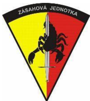
Obrázek č. 2 – Znak Zásahové jednotky KŘP hl. m. Prahy 6

Sucus intra leges – v rámci zákona. Takto zní motto zásahové jednotky KŘP hl. m. Prahy. S tím jak se vyvíjela kriminalita na území hlavního města Prahy, tak se musela vyvíjet i PČR. Je bez pochyb, že na území hlavního města Prahy je zvýšená hustota obyvatel na daném území, kdy třeba na sídlištích je vysoká anonymita osob a i z těchto důvodů je těžší odhalovat protiprávní jednání pachatelů. Na teritoriu hlavního města Prahy se vyskytuje vysoká migrace obyvatel, kdy lidé často do Prahy dojíždí za prací anebo za sportovními/kulturními událostmi. Z těchto důvodů je kriminalita na území hlavního města velmi vysoká a zásahová jednotka KŘP hl. m. Prahy je kvůli výše zmíněným faktorům často nasazována.