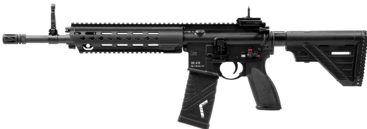
Obrázek č. 9 - Heckler & Koch 416 A5 14.5" 31

Je útočná puška vyráběná německou firmou Heckler & Koch, kterou používá řada ozbrojených složek po celém světě. Je také ve výzbroji většiny speciálních jednotek. Často bývá zaměňována s americkou puškou M16/M4. Používá náboje 5.56 mm x 45 NATO. Konstrukčně se jedná o kombinaci dvou útočných pušek G36 a AR15. V současné době HK416 u ÚRN patří do běžné výzbroje jednotlivce.