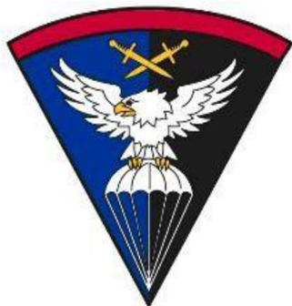
Obrázek č. 1 – Znak ÚRN 1

S rozumem a odvahou. To je motto ÚRN, které vystihuje potřebné vlastnosti příslušníků útvaru.