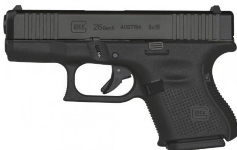
Obrázek č. 5 – Pistole Glock 26 gen. 5, ráže 9mm luger 23

Jedná se o menší provedení pistole, které je vhodné pro skryté nošení. Zbraň se tedy často využívá při zákrocích v civilním oděvu. Policisté si můžou vybrat zda, na zákrok vyžijí toto menší provedení pistole, anebo zda dokážou skrytě nosit větší pistol například jako Glock 17.