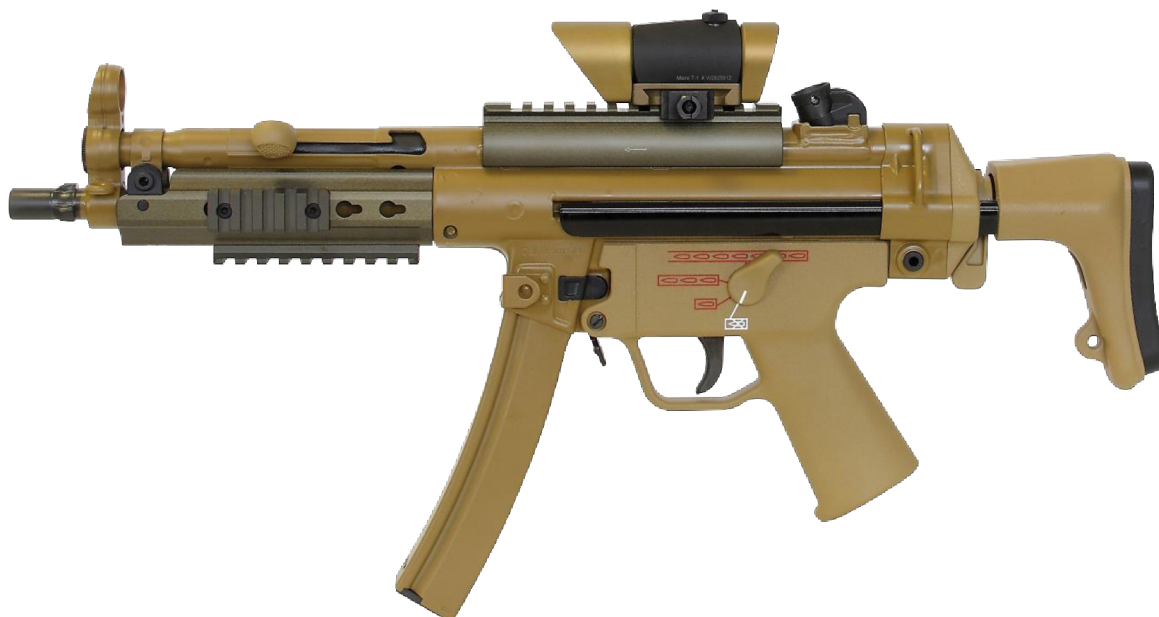
Obrázek č. 6 - Samopal Heckler & Koch MP5 MLI 25

jednotlivými ranami, tří rannou dávkou nebo dávkou plnou a je možné na něj připevnit například svítilnu, či kolimátor.