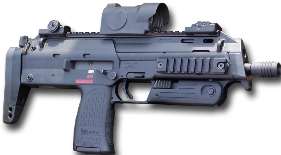
Obrázek č. 7 - Samopal Heckler & Koch MP7 A1 27

Weapon PDW). Je malá a lehká díky použití polymerů a proto je vhodná při pohybu v menších prostorech.