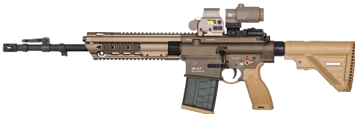
Obrázek č. 10 - Heckler & Koch 417 A2 16.5" 33

Útočná puška od německé firmy Heckler & Koch 4, v ráži 7,62 mm x 51 NATO, je náhražkou za dnes již vyřazené, nebo vyřazované, zbraně československé výroby, samopaly vzor 58. Tato puška je moderní kombinací pušek M4 a G36, kde spojuje výhody obou zbraní. Vzhledem k typu střeliva je tato puška vhodná ke střelbě na větší vzdálenost, a proto u ÚRN ji nejčastěji používají odstřelovači jako doplňkovou odstřelovací pušku v otevřeném terénu, a to hlavně na zahraničních operacích.