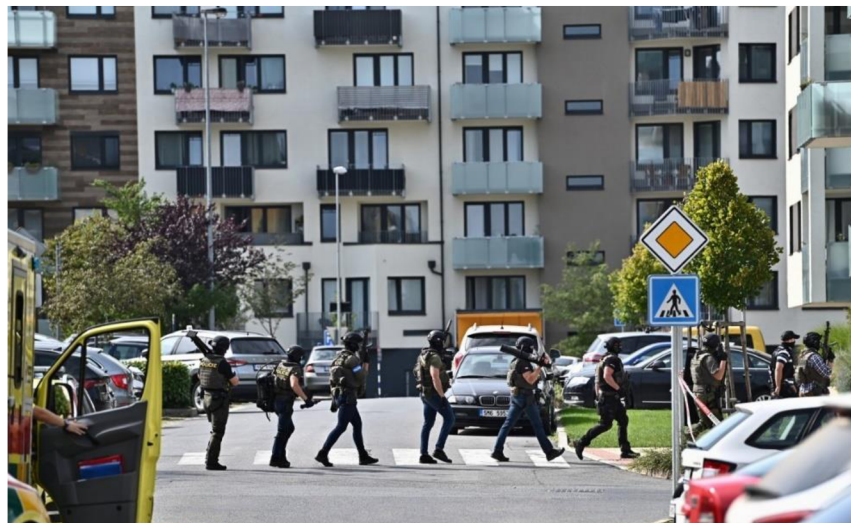
Obrázek č. 12 – Zásahová jednotka KŘP hl. m. Prahy na pražském Barrandově 37

ohrožoval. Celý zákrok zásahové jednotky KŘP hl. m. Prahy proběhl během několika vteřin a obešel se bez jakéhokoliv zranění.