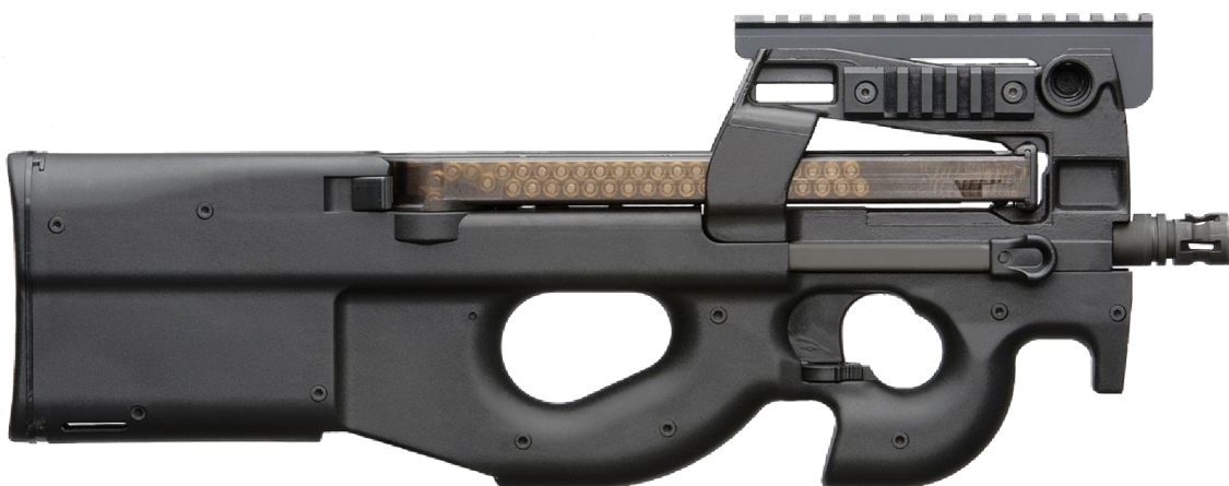
Obrázek č. 8 – Samopal FN P90 29

pravák i levák a má mířidla po obou stranách. Samopal má velice atypický tvar, aby s ním bylo možné se pohybovat v malých prostorách. Používá náboje 5,7 x 28 mm a má unikátní podávání nábojů ze zásobníků, kdy náboj se otáčí o 90 stupňů a následně má výhozné okénko směrem dolů, aby vyhozené nábojnice nepřekáželi ani levákovi, či pravákovi a aby se ve stísněných prostorách například neodráželi od zdí zpět na střelce.