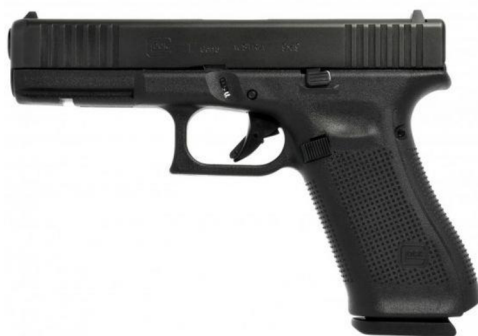
Obrázek č. 4 – Pistole Glock 17 gen. 5, ráže 9mm luger 21

osvědčila svojí dlouhodobou životností. V posledních letech PČR systematicky přezbrojuje ze služebních zbraní CZ 75D Compact právě na pistole Glock 17. V současné době je na trhu nepřehledné množství vhodného příslušenství, jako jsou mimo jiné svítilny, tlumiče výstřelu a kolimátory. Toto příslušenství usnadňuje příslušníkům využití zbraně v určitých podmínkách.