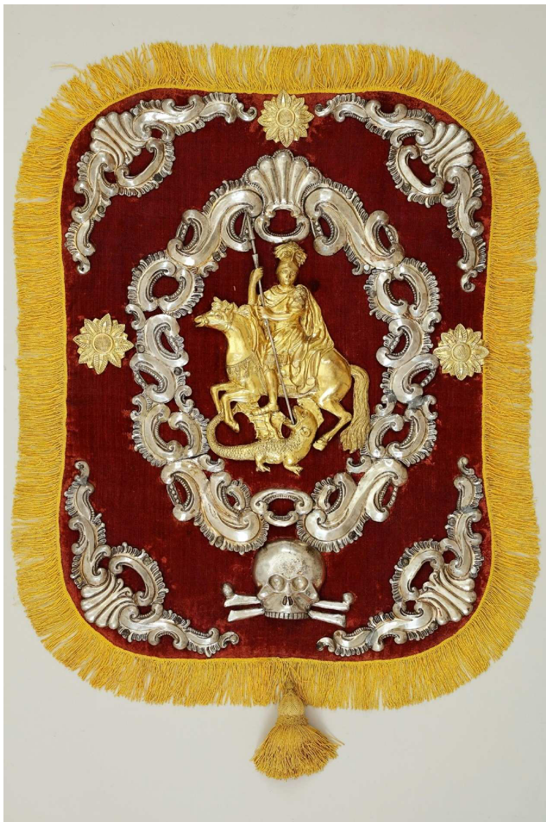
Krkonošské muzeum v Jilemnici, sbírka Historie, inv. č. H 884