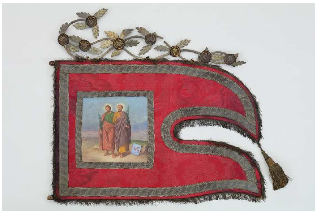
Krkonošské muzeum v Jilemnici, sbírka Historie, inv. č. H 926