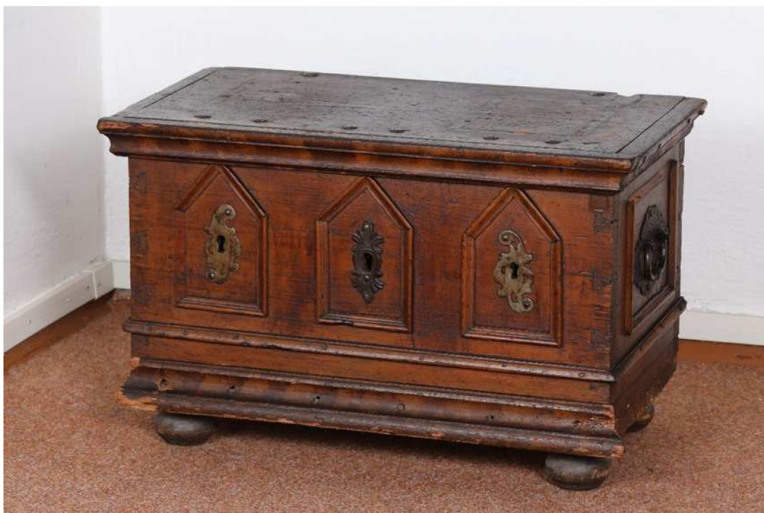
Krkonošské muzeum v Jilemnici, sbírka Historie, inv. č. H 908