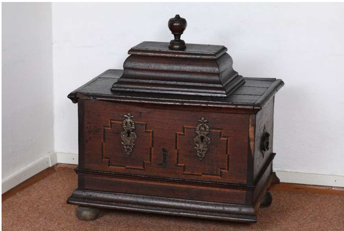
Krkonošské muzeum v Jilemnici, sbírka Historie, inv. č. H 911, foto Pavel Kraus