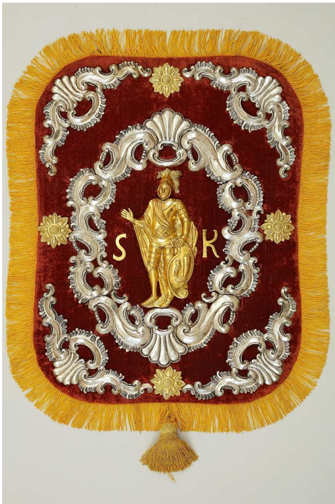
Krkonošské muzeum v Jilemnici, sbírka Historie, inv. č. H 881, foto Pavel Kraus