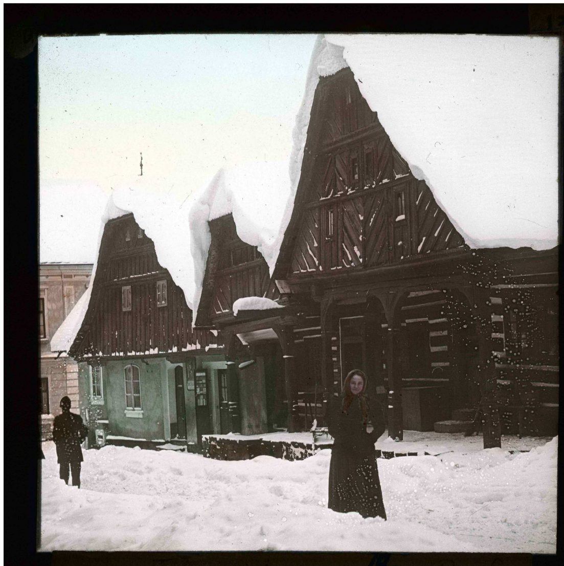
Krkonošské muzeum v Jilemnici, sbírka Negativy a diapositivy, inv. č. Nd 3796, autor Josef Vejnar

Pohled do dnešní Kavánovy ulice, kolem roku 1900