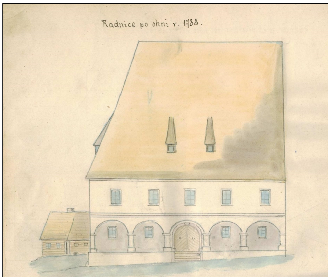
Krkonošské muzeum v Jilemnici, fond Město Jilemnice , dosud nezpracován