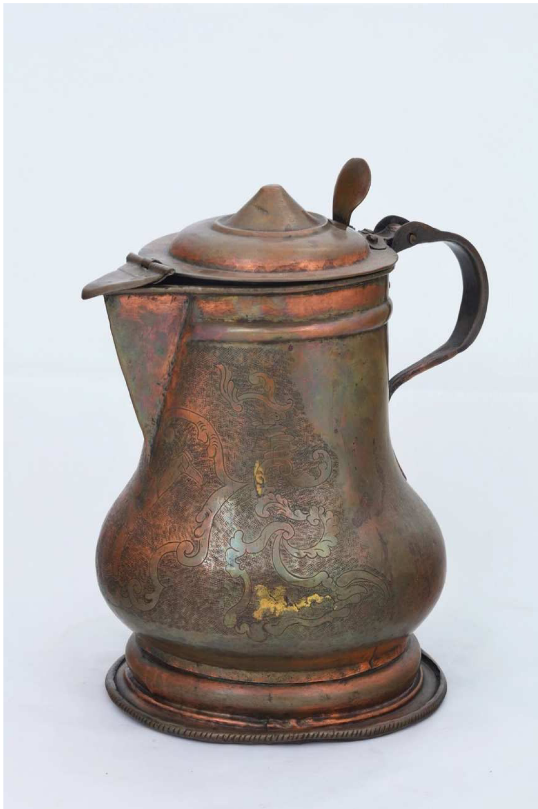
Krkonošské muzeum v Jilemnici, sbírka Historie, inv. č. H 906