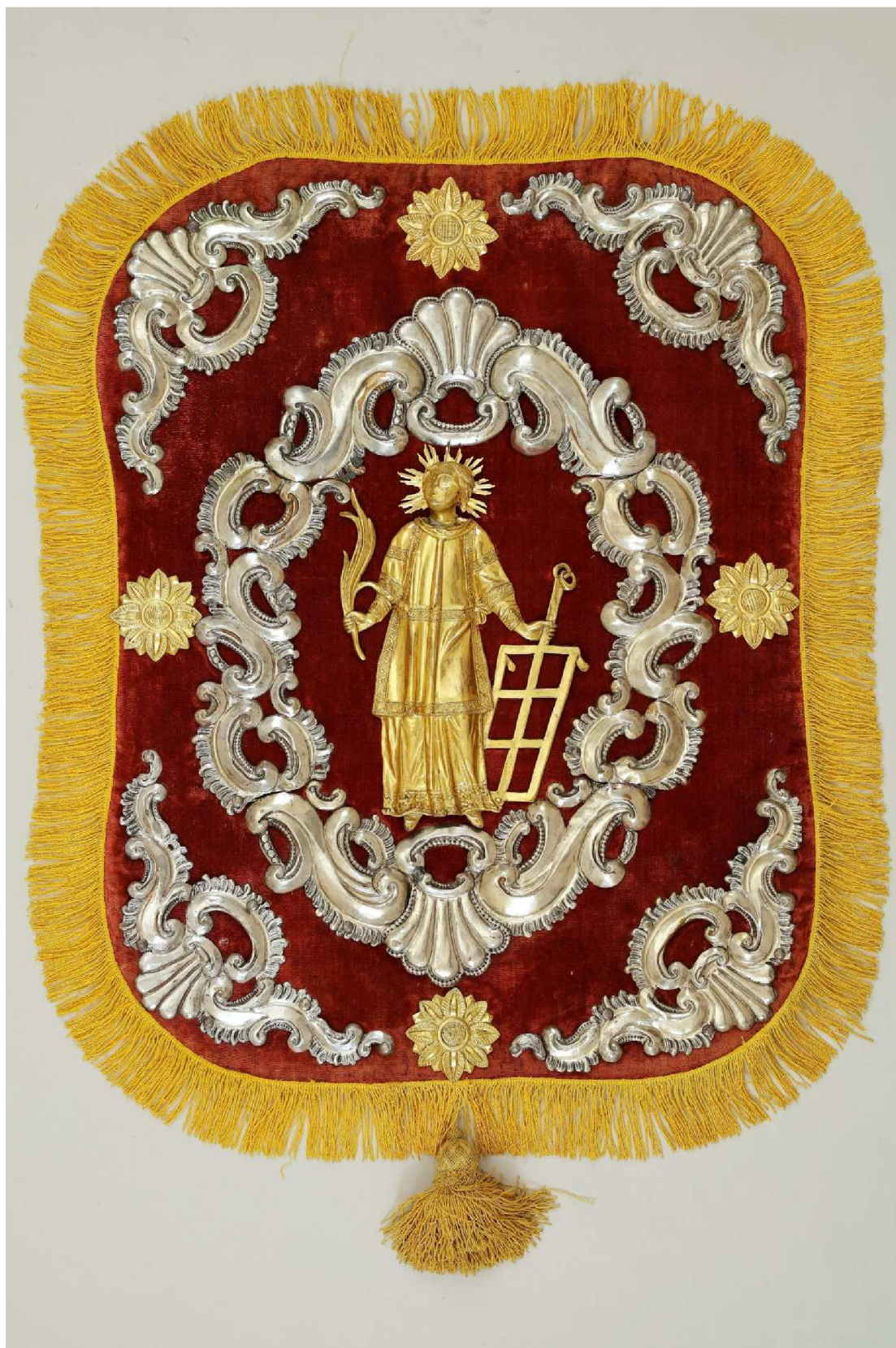
Krkonošské muzeum v Jilemnici, sbírka Historie, inv. č. H 883, foto Pavel Kraus