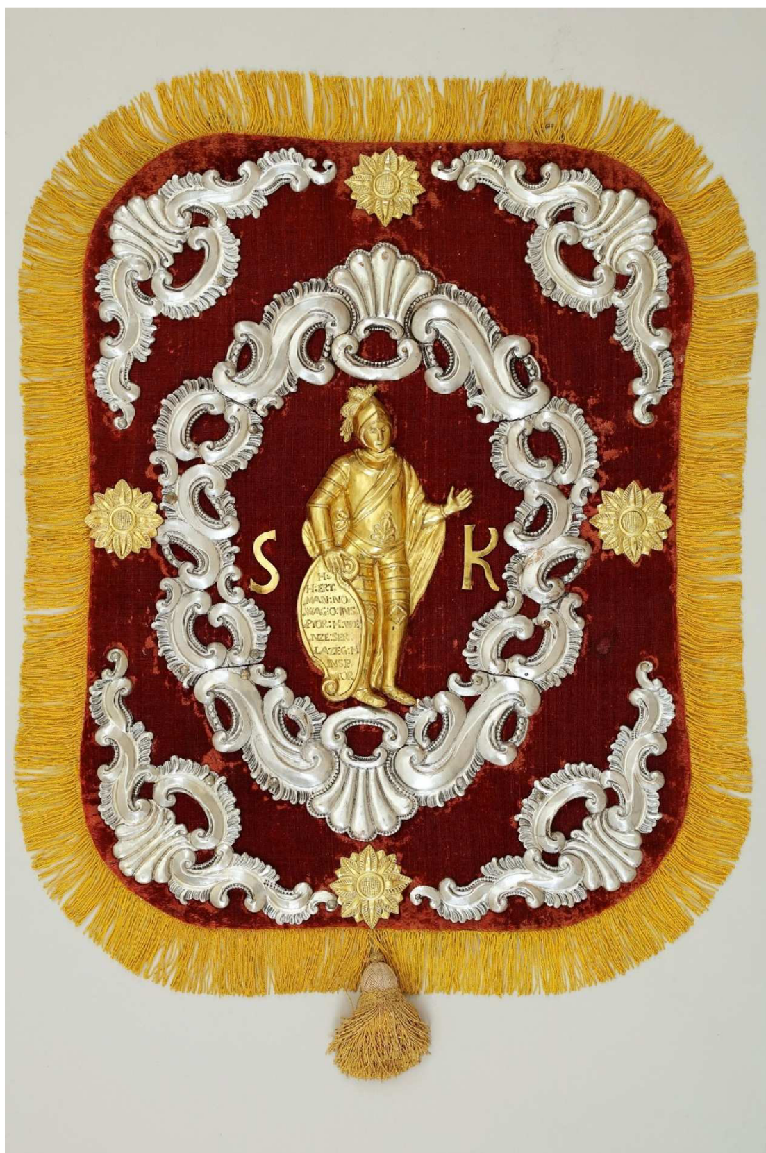
Krkonošské muzeum v Jilemnici, sbírka Historie, inv. č. H 882