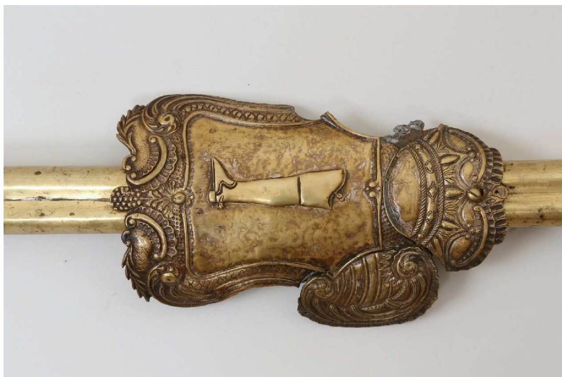
Krkonošské muzeum v Jilemnici, sbírka Historie, inv. č. H 915