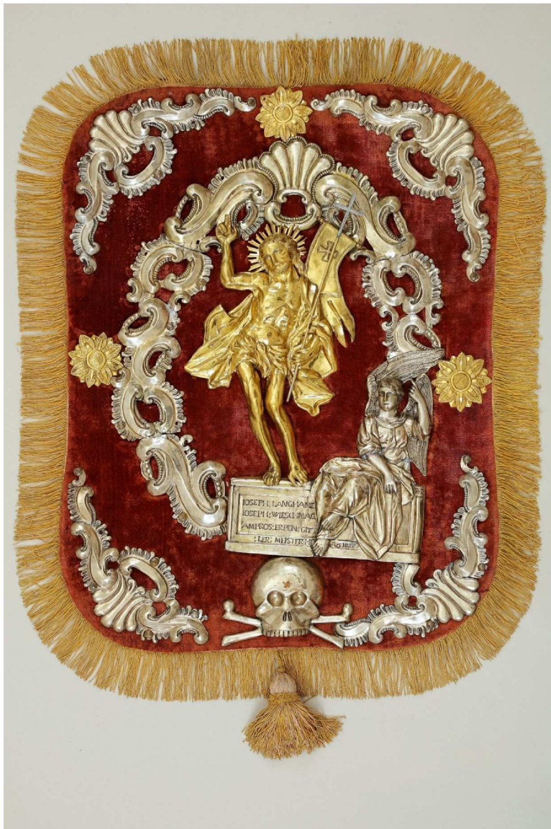
Krkonošské muzeum v Jilemnici, sbírka Historie, inv. č. H 880