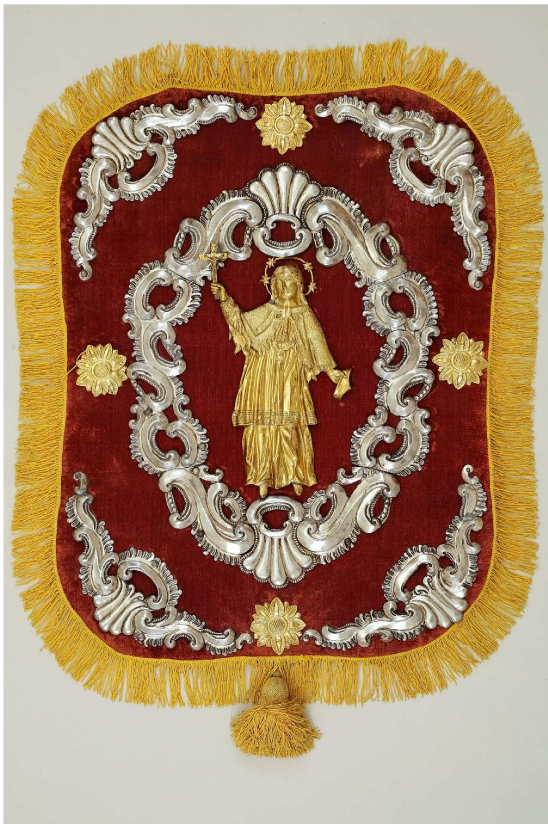
Krkonošské muzeum v Jilemnici, sbírka Historie, inv. č. H 885, foto Pavel Kraus