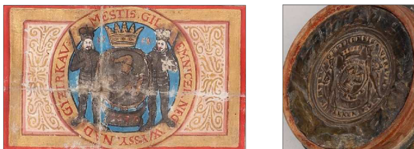
Obr. č. 1 Výřez obrazu z cechovních artikulí (1658), detail otisku pečetidla jičínského cechu. 152