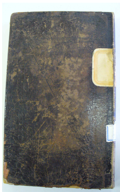
Zadní strana pamětní knihy č. 2