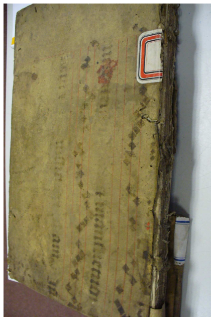
Zadní strana pamětní knihy č. 1