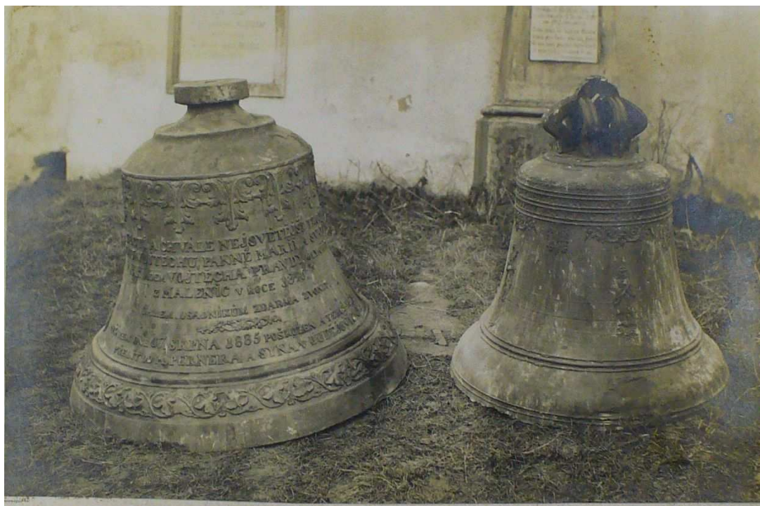
malenické zvonů Vojtěch a Marie