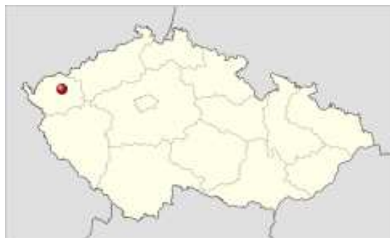
Obrázek č. 2 - Poloha města Karlovy Vary 18

Toto královské město leží na soutoku řek Ohře, Teplé a Rolavy. Nedaleko se nachází zalesněná oblast CHKO Slavkovský les s charakteristickou faunou a florou a vojenský újezd Hradiště. Tato oblast je také bohatá na mineralogické nálezy.