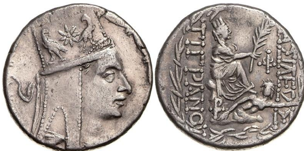
Obrázek 4 - Tetrachma Tigranés II.

Arménská říše (mincovna Antiochie): Tigranés II., tetrachma Ag, (83-69 př. n. l). Ident.Nr. 18204038