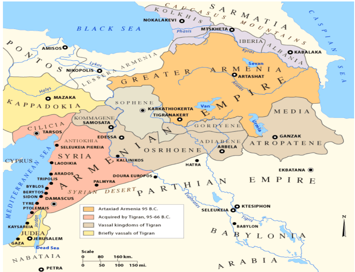
Obrázek 2 - Arménská říše v 1. stol. př. n. l.

http://www.armenica.org/cgi-bin/armenica.cgi?489681413005204=1=3=Armenia=nada=1=3=AAA [cit. 18. 7. 2014]