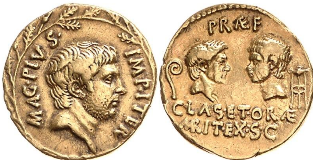
Obrázek 6 - Aureus Pompeius

Římská rep. (Sicílie) – Pompeius Magnus, aureus Au (42-40 př. n. l.), Ident. Nr. 18215719