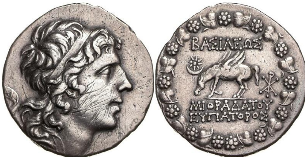
Obrázek 3 - Tetrachma Mithradatés VI.

Pontos: Mithradatés VI. Eupátor, tetrachma Ag, (95 př. n. l), Ident.Nr. 18204034