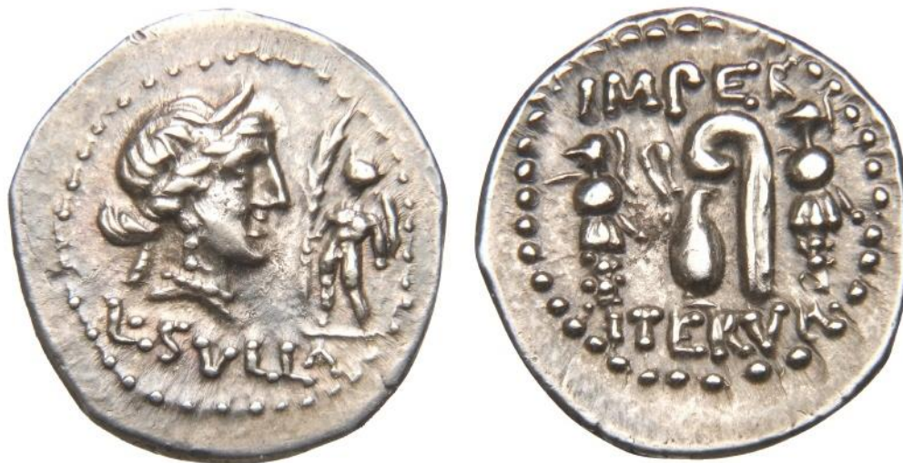
Obrázek 5 - Denár Sulla

Římská rep. (mincovna Atény?): L. Sulla, denár Ag (84-83 př. n. l.), Ident.Nr. 18206086.