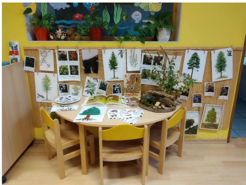
Obrázek 1: Lesní koutek