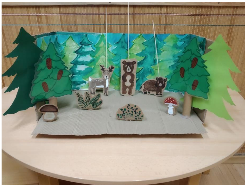
Obrázek 2: Lesní divadélko

Tuto aktivitu se mi podařilo uskutečnit ve třídě Broučků u dětí 3-5 let v MŠ Hněvotín během omezeného provozu. Aktivita dětí velice bavila, a tak nám sloužila po celý týden v ranních hrách. Z počátku jsem děti nechala vymýšlet příběhy samovolně, kdy vznikaly opravdu zajímavé scénáře. Nejdříve se nám všechna zvířátka otrávil díky muchomůrce a pak zase zázračně ožila, když snědla borůvky. Na začátku si děti do příběhů často zasahovaly a vstupovaly do nich. Často také děti nosily do divadélka plastová zvířata, která do lesa nepatří (lev, tygr, klokan), a chtěly s nimi taktéž hrát divadlo. Dodatečně musela být zavedena pravidla pro herce a diváky, doba pro střídání a také jak s divadélkem pracovat. Ve středu jsem dětem do mateřské školy přinesla i karty, jak se chovat a nechovat v lese. S dětmi jsme si v komunitním kruhu karty ukázali a vysvětlili dané chování. Druhý den děti karty využívaly ke hře a samy určovaly správné a nesprávné chování v lese. V pátek se ovšem vrátily zpět k vymýšlení vlastních příběhů, které je bavily nejvíce. Aktivitu lesní divadélko hodnotím velice kladně, jelikož se do role diváků zapojily i mladší děti, které si jindy hrají odděleně. Tato aktivita byla přínosná pro rozvoj fantazie a také komunikace mezi dětmi, jelikož samovolně příběhy komentovaly, hodnotily a doplňovaly.