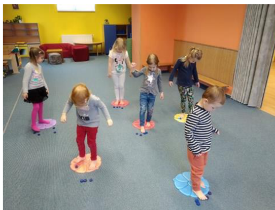
Obrázek 3: Jak kořeny sbírají vodu

Hodnocení: Tuto aktivitu jsem si vyzkoušela v MŠ Hněvotín s šesti dětmi ve věku 3–5 let, kdy byl omezený provoz mateřských škol. Děti měly za úkol posbírat čtyři kapičky vody z okolní půdy pomocí kořenů. Aktivita děti bavila a všechny děti dokázaly posbírat vršky pomocí dolních končetin. Mladší děti ze začátku manipulovaly s vršky pomocí horních končetin, takže jsem musela znovu připomenout pravidla hry. Všechny děti se snažily stát jednou nohou na podložce.