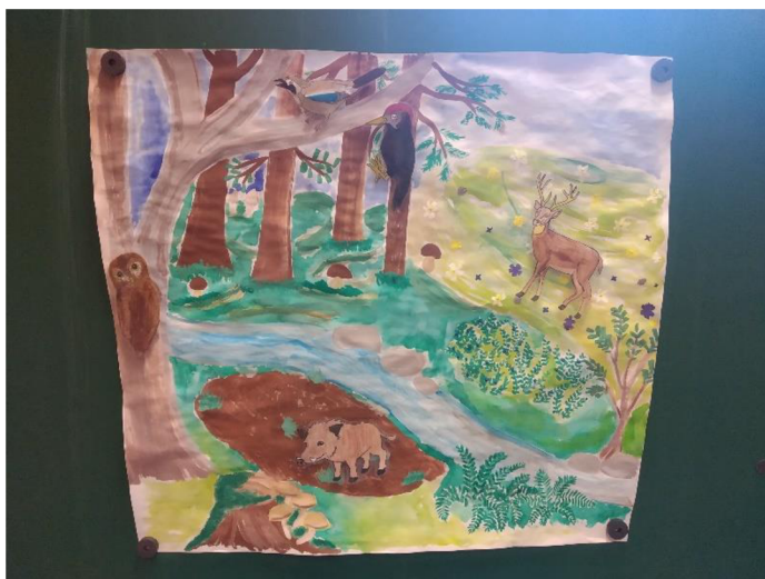
Obrázek 5: Život v lese

Aktivitu jsem si ověřila v MŠ Hněvotín ve skupině devíti dětí ve věku 3-5 let při omezeném provozu mateřské školy. Děti aktivita opravdu bavila a některé zvuky zvířat jim přišly velice legrační. Zvolila jsem divoké prase, jelena, sovu, datla a sojku. Děti pojmenovaly všechny zvířátka správně a následně z nich volila podle hudební ukázky. Děti z počátku zmátla zvuková ukázka sojky, ale logickým uvažováním z nabídnutých zvířat vybraly správnou možnost. S dětmi jsme se pokusily zvuk zvířat napodobit.