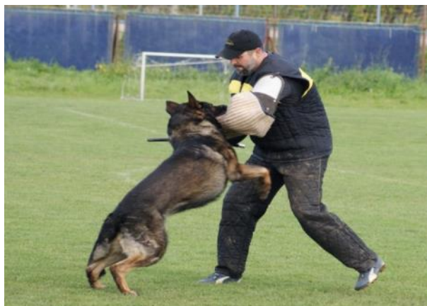
Obr. 2 Zákus do ochranného rukávu při zkoušce odvahy a bojovnosti

Při měření velikosti a hmotnosti psa zjišťuje krajský poradce chovu nebo pověřený okresní poradce chovu hmotnost psa, hloubku hrudníku a obvod hrudníku. Rozhodčí změří kohoutkovou výšku psa a současně provede kontrolu tetování [25].