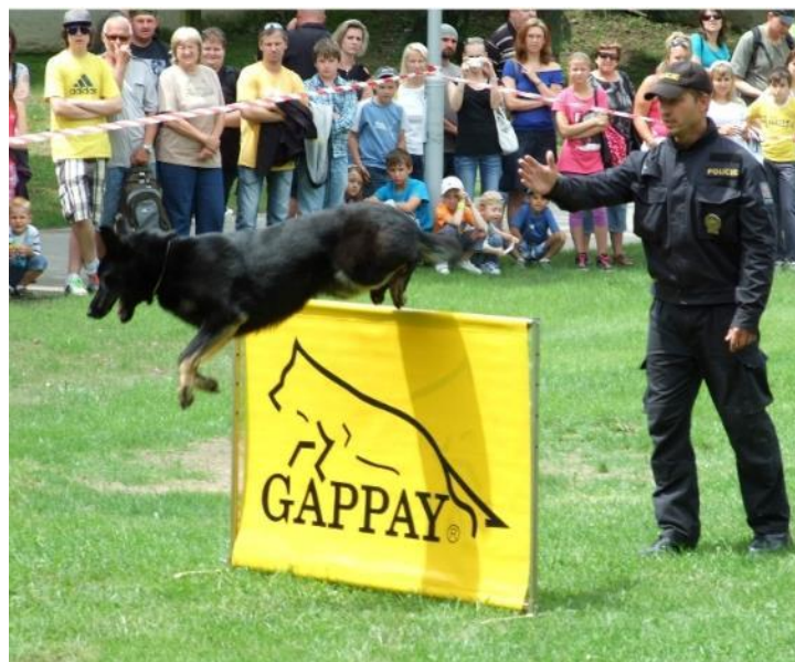
Obr. 1 Služební fena Galla při překonávání překážky – skok vysoký

Pes musí rovněž zvládnout na povel zdolat různé druhy a typy překážek různou pohybovou mechanikou. K hodnocení takových dovedností slouží soubor cviků, nazvaný překonání překážek [32]. Patří sem skok vysoký , při kterém se požaduje, aby pes bez dotyku a oběma směry překonal překážku (plnou pevnou stěnu) o výšce 80 cm (obr. 1). Dále je to skok šplhem , který se provádí v jednom směru na tzv. „áčku“, což je překážka složená ze dvou stěn, nahoře spojených a dole rozevřených, tak že kolmá výška překážky činí 1,8 m. Na stěnách jsou v horní polovině umístěny tři stoupací latě. Další překonávanou překážkou je nízká kladina (o šířce 30 cm a délce 5 m) ve výšce 1 m nad zemí, která má na obou koncích náběhová prkna, 3,5 m dlouhá.