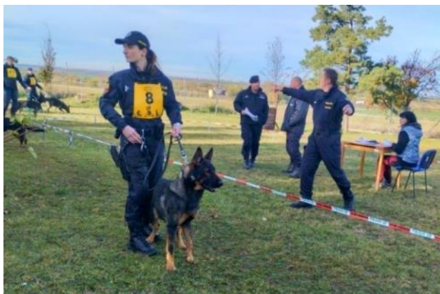
Obr. 5 Chování psa při posuzování jeho exteriéru