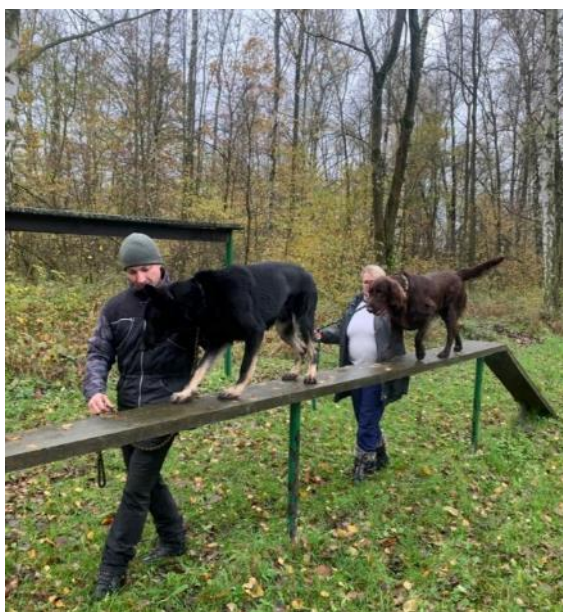
Obr. 12 Výcvik napodobovací metodou - překonávání kladiny s dalším psem

Výcvik napodobovací metodou se provádí v přítomnosti dalšího, již vycvičeného psa, kterého méně vycvičený pes napodobuje. Metoda je využívána např. při nácviku překonávání překážek (obr. 12) nebo při nácviku obranných prací.