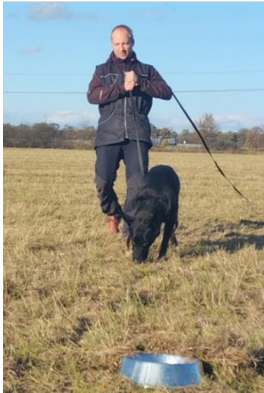
Obr. 10 Pes Adonis při nácviu sledování pachové stopy

v podmínkách s rušivými vlivy (obr. 11). Při této metodě nedochází k narušování kladného vztahu mezi psovodem a psem.