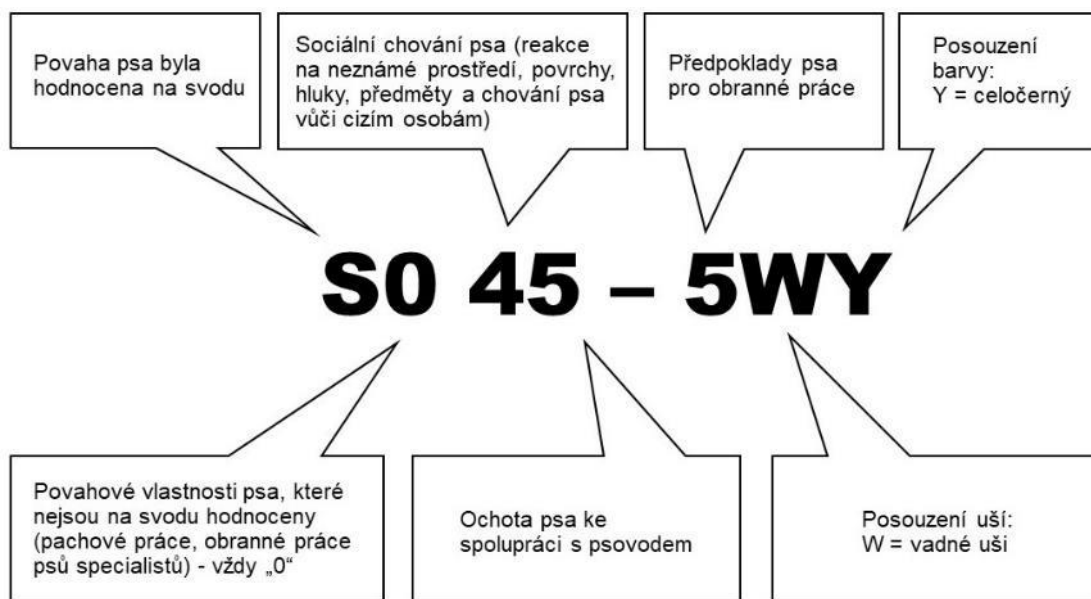
Obr. 9 Konkrétní příklad povahového kódu psa

Hodnocení povahového testu zapisuje chovatelská stanice do Evidenční knížky služebního psa.