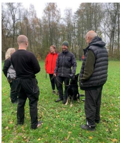
Obr. 6 Test reakce psa na skupinu osob – pes uprostřed skupiny