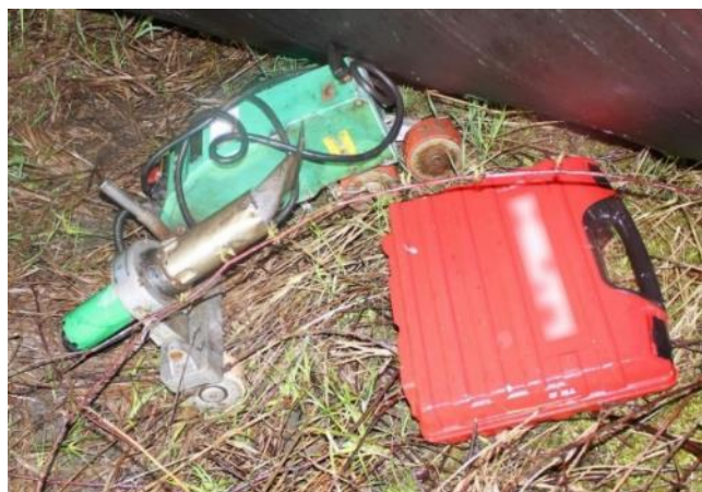
Obr. 16 Věci odcizené ze skladu firmy v Ostravě v roce 2016 [36]