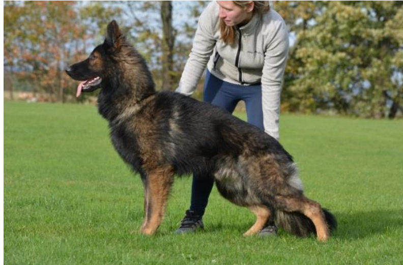
Obr. 3 Předvedení psa v postoji

Rozlišujeme dva druhy chovu: výběrový a kontrolovaný [26]. Splnění bonitace není podmínkou chovnosti, posouvá však psa do výběrového chovu. Pes bez bonitace, který splnil podmínky chovnosti (popsané v předcházejících kapitolách) spadá do chovu kontrolovaného.