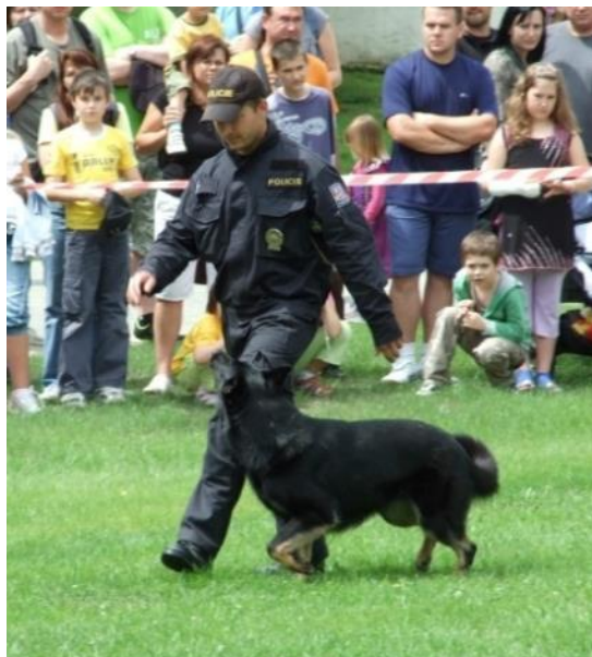
Obr. 11 Služební fena Galla při chůzi u nohy psovoda – ukázka poslušnosti v prostředí s rušivými vlivy