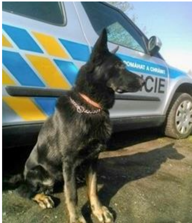
Obr. 151 Služební fena Galla [36]

místě, aby střežil nalezené předměty, a já jsem s Gallou pokračoval ve sledování pachové stopy. Do toho okamžiku byla stopa sledována po travnatém a hliněném povrchu, dále však pokračoval povrch zpevněný. Po několika minutách dalšího sledování stopy Galla ztratila jistotu, poté přestala pachovou stopu sledovat a začala se točit v kruzích. Fena také vykazovala zjevnou únavu, a proto jsem se rozhodl práci na pachové stopě ukončit.