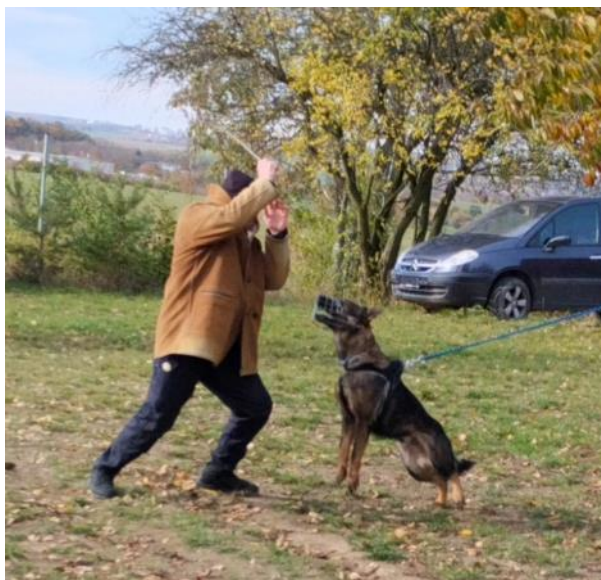
Obr. 8 Přepadení psa

svůj útok a schová se do úkrytu. V případě, že po útoku figuranta má pes snahu ze stanoviště utéct, figurant ihned zastaví svůj útok a schová se do úkrytu (obr. 8). Hodnotící kritéria jsou uvedena v tabulce 11. Tento test se neprovádí u psů určených na speciální použití.