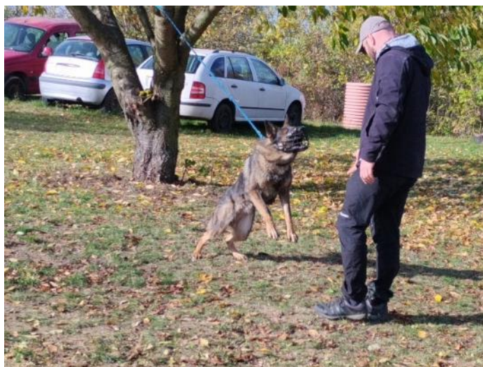
Obr. 7 Reakce psa na cizí osobu