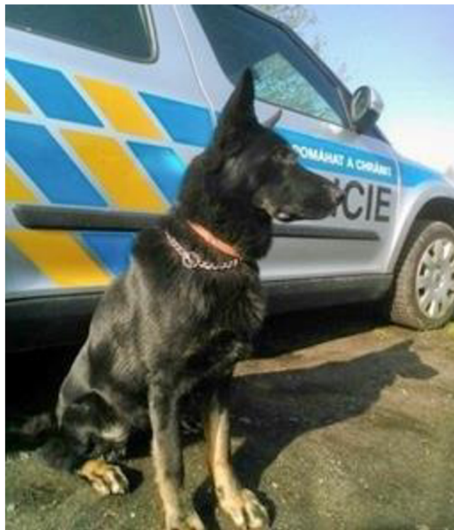
Obr. 151 Služební fena Galla [36]

místě, aby střežil nalezené předměty, a já jsem s Gallou pokračoval ve sledování pachové stopy. Do toho okamžiku byla stopa sledována po travnatém a hliněném povrchu, dále však pokračoval povrch zpevněný. Po několika minutách dalšího sledování stopy Galla ztratila jistotu, poté přestala pachovou stopu sledovat a začala se točit v kruzích. Fena také vykazovala zjevnou únavu, a proto jsem se rozhodl práci na pachové stopě ukončit.