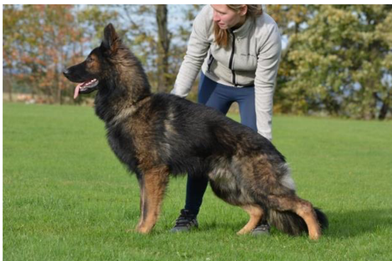
Obr. 3 Předvedení psa v postoji

Rozlišujeme dva druhy chovu: výběrový a kontrolovaný [26]. Splnění bonitace není podmínkou chovnosti, posouvá však psa do výběrového chovu. Pes bez bonitace, který splnil podmínky chovnosti (popsané v předcházejících kapitolách) spadá do chovu kontrolovaného.