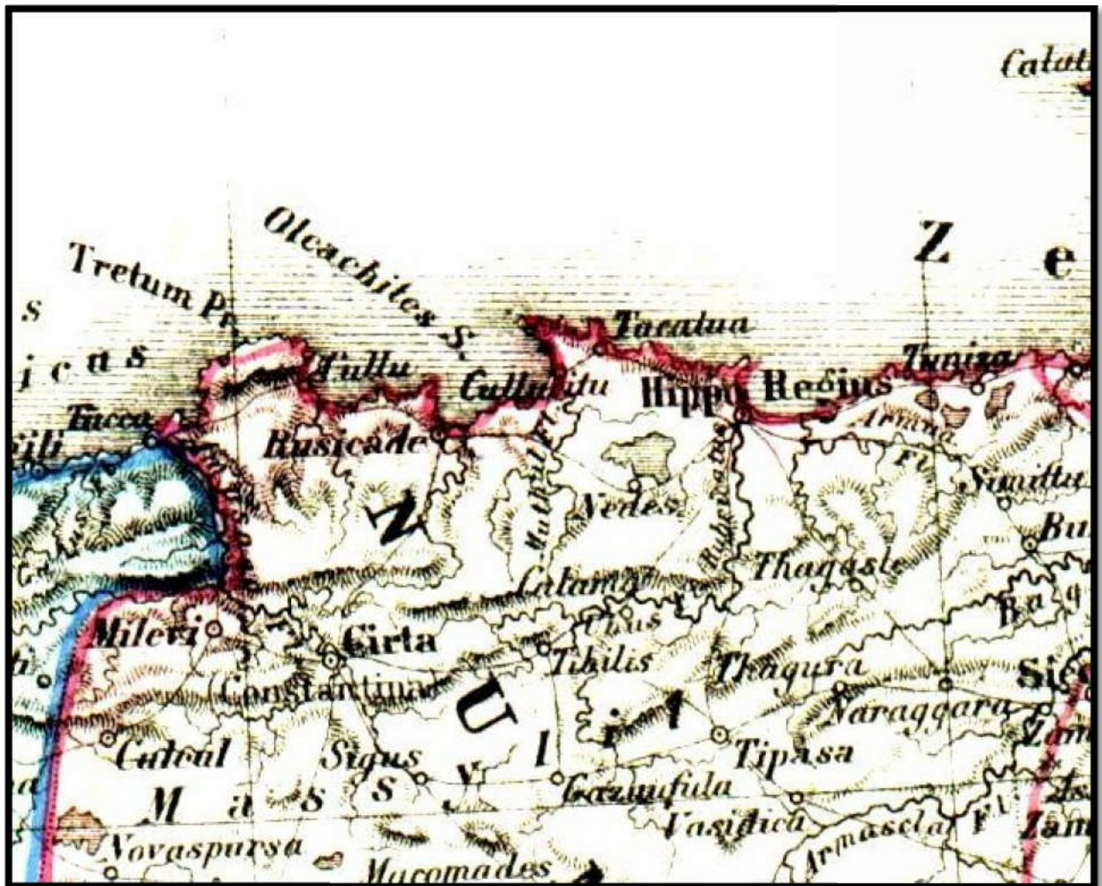
Príloha 3: Dobová mapa - Mapa severnej Afriky, rodisko Aurelia Augustina.