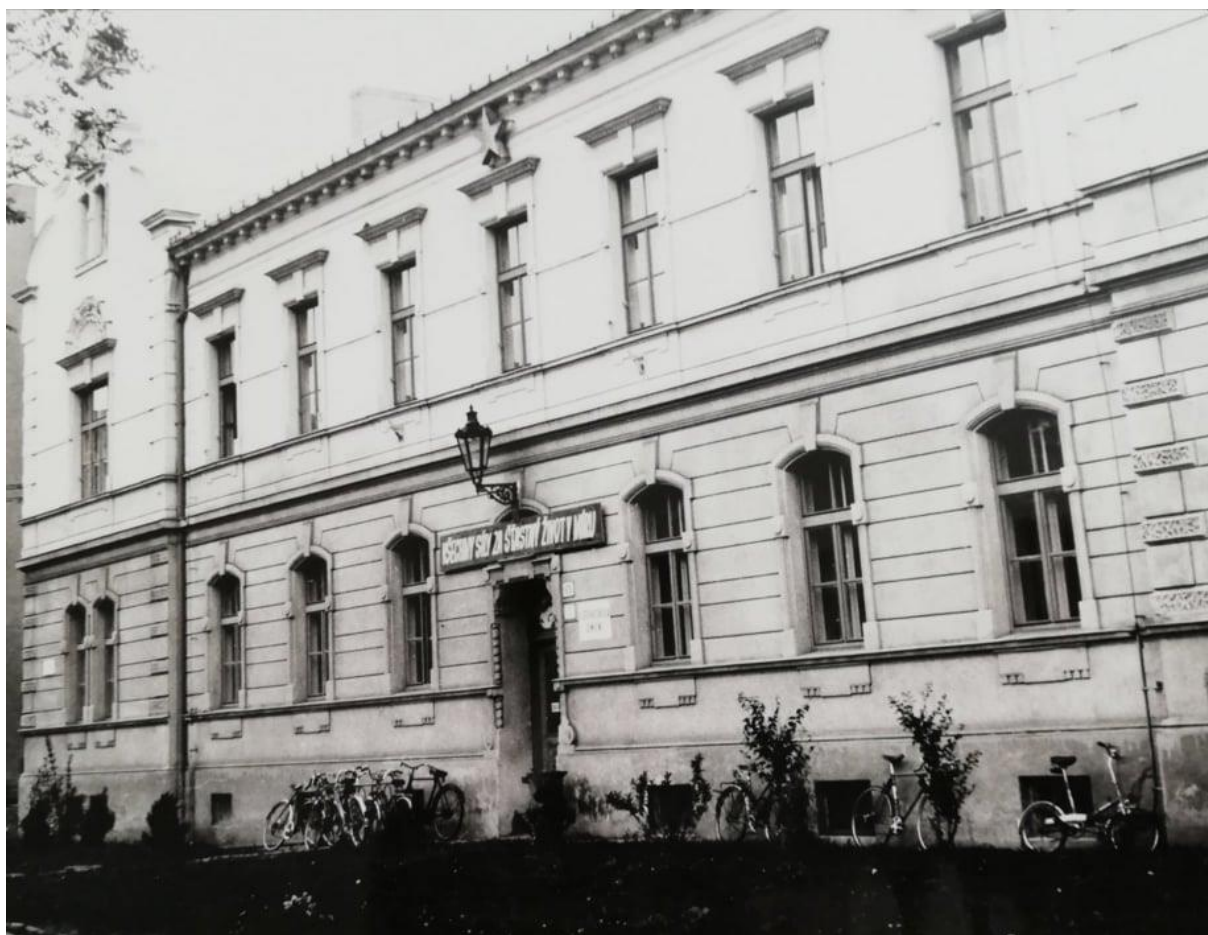
Obr. 6: Nová budova MHÚP v ulici Petra Bezruče 71