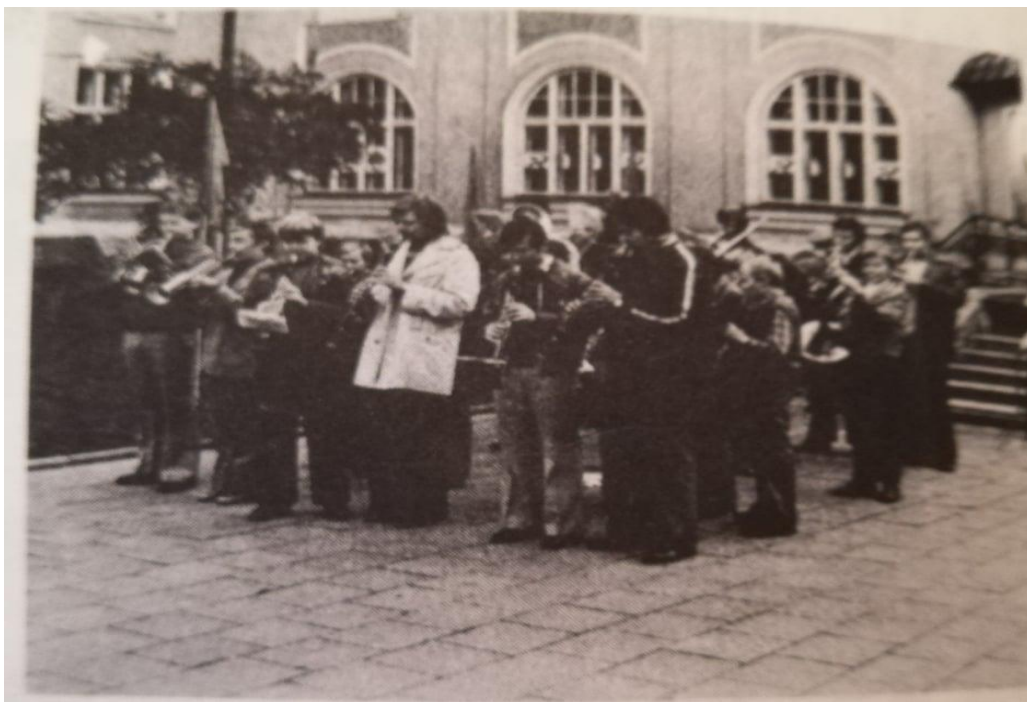
Obr. 12: Žákovská dechovka LŠU v Holešově 98

Rokem 1977/1978 započala příprava na významné jubileum školy, 30 let od jejího založení. Současně si celý pedagogický sbor dal za úkol zvýšit požadavky na všechny žáky, což souviselo i se zvýšením iniciativy učitelů, důsledným plněním osnov a plánů. Výsledky tohoto snažení se projeví zejména na veřejných vystoupeních žáků a učitelů školy a nanejvýš odpovědným přístupem v jejich přípravě. I nadále se pracovalo na zvýšení kvality všech žákovských besídek. Byly prováděny každý měsíc a tematicky se vázaly k významným nebo památným dnům daného období. Potěšitelné bylo, že se od začátku jejich uvedení se velmi zvýšila návštěvnost rodičů a přátel školy. 99