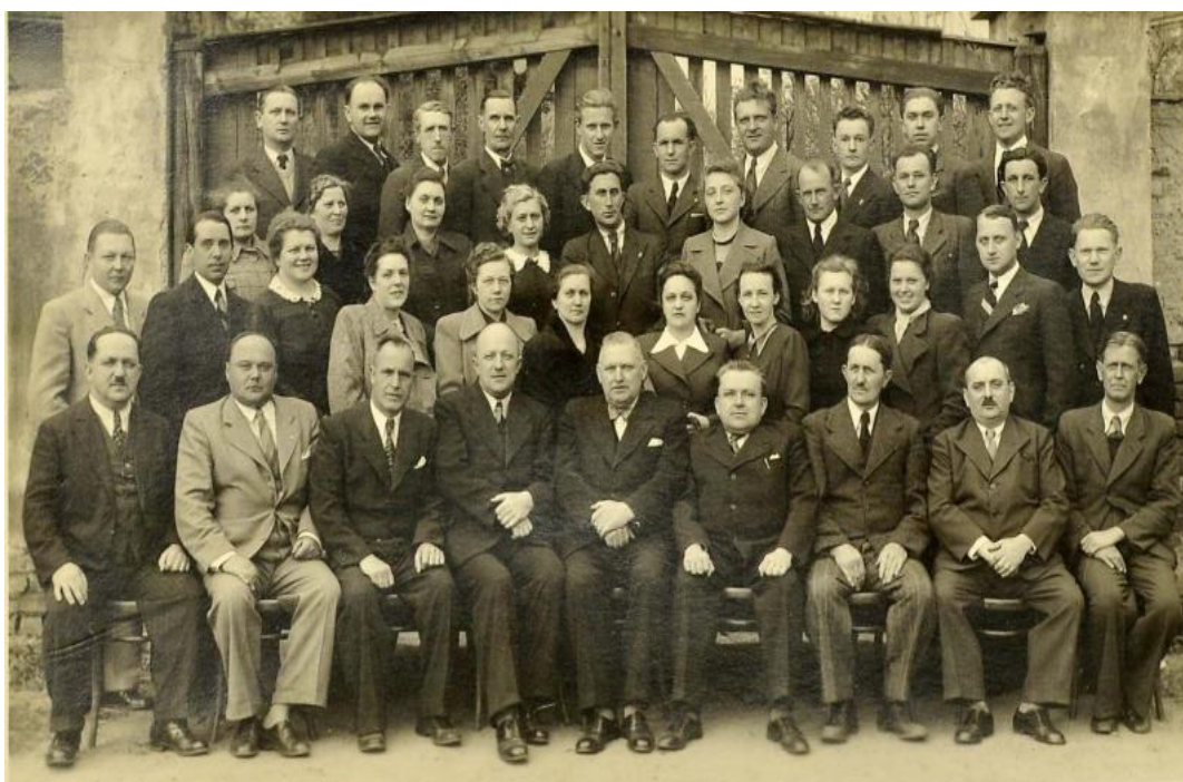
Obr. 2: Obsazení spolku Podhoran v roce 1941 37