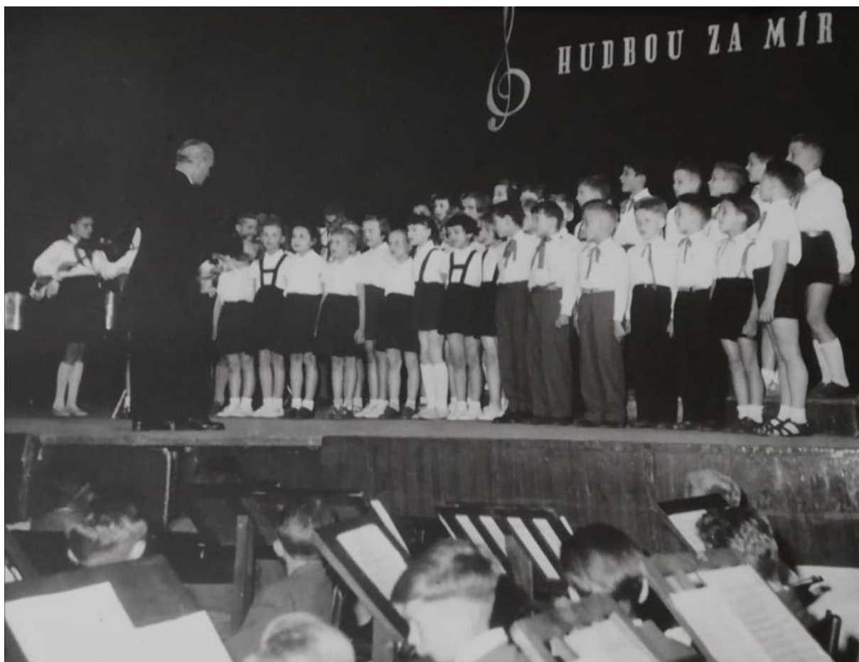
Obr. 5: Žákovská hudební besídka 25. června 1952 59