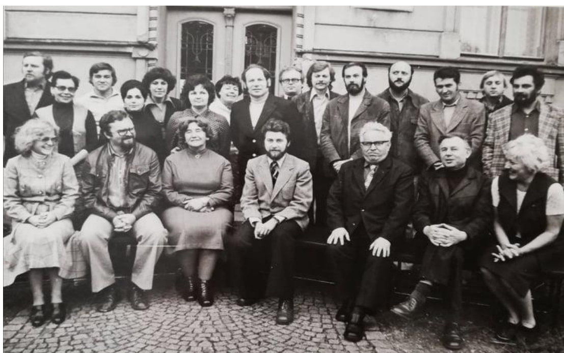
Obr. 13: Učitelský sbor LŠU v roce 1978 během oslav 30. výročí založení školy 101

následně odebrali k prohlídce školy a na závěr oslav byl uspořádán koncert komorního orchestru učitelů LŠU v okrese Kroměříž. Oslavy pokračovaly ještě několika dalšími koncerty, které se v průběhu října odehrály. Na těchto akcích se postupně představila všechna oddělení LŠU. Nejprve žákovský koncert věnovaný oslavám 30 let od založení školy, ale také 60. výročí vzniku samostatného československého státu. Dále pak koncert pěveckého sboru a žákovského dechového tria ve velkém sále holešovského zámku. Další významnou akcí tohoto roku byl koncert na počest oslavy k 75. narozeninám hudebního skladatele Jana Schneeweise, holešovského rodáka, který se konal 26. ledna 1979. Vedle sólových vystoupení, kteří zde tento večer vystoupili, přednesl učitelský sbor několik písní s doprovodem orchestru z tvorby umělce. 100