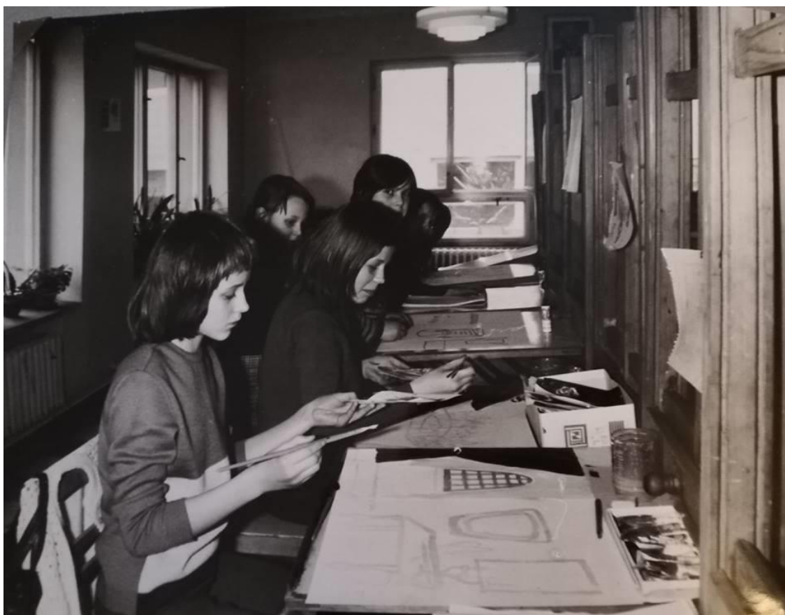
Obr. 8: Výtvarný obor na LŠU v Holešově 83