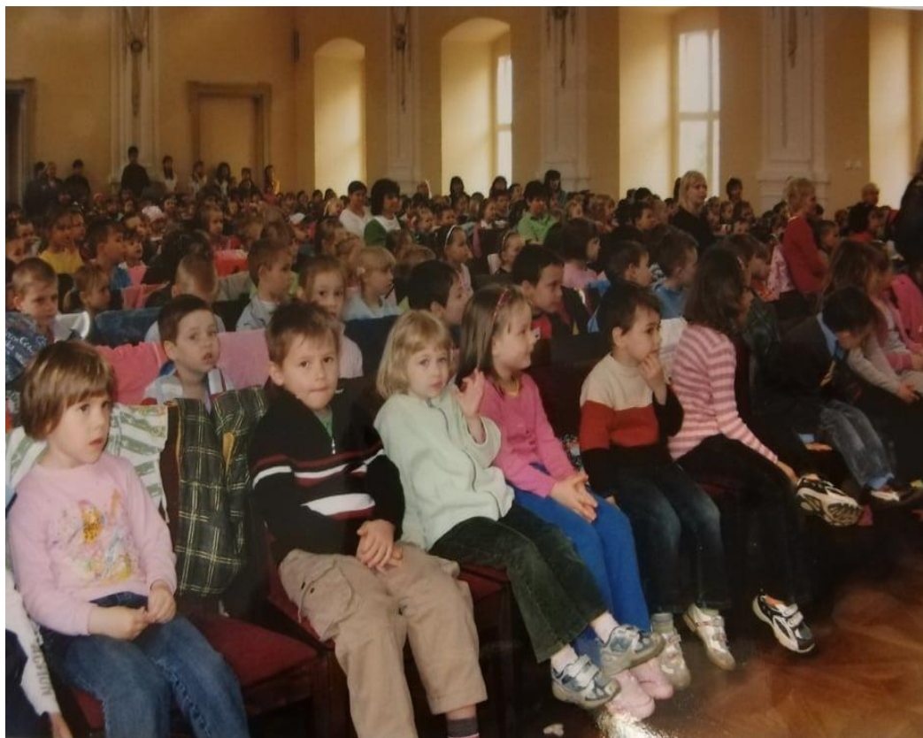
Obr. 15: Beseda pro děti z MŠ v roce 2010 123

V roce 2010/2011 byla v Žeranovicích zřízena doposud poslední pobočka ZUŠ v Holešově. Výuka až dodnes probíhá ve zdejší základní škole a vyučuje se hra na flétnu, housle a hudební nauka. Jak bylo již tradicí, každoročně pořádané besídky pro děti z mateřských škol se rozrůstají a ZUŠ v Holešově jich celoročně pořádá hned několik. Vždy mají svá tematická zaměření, která mají mladší žáky seznámit s běžnými každodenními činnostmi v rámci hudby. Vždy jsou dětem představovány všechny nástroje, na které se ve škole vyučuje.