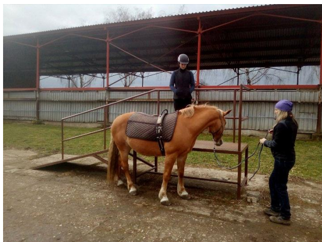
Obrázek 14. Návuk nasedání na koně z nájezdové rampy