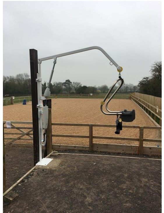
Obrázek 2. (hydraulický zvedák)