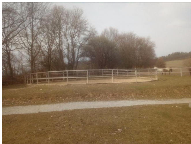
Obrázek 11. Kruhová jízdárna