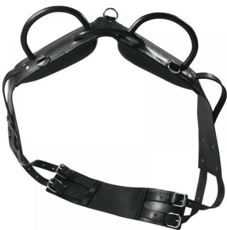
Obrázek 3. madla