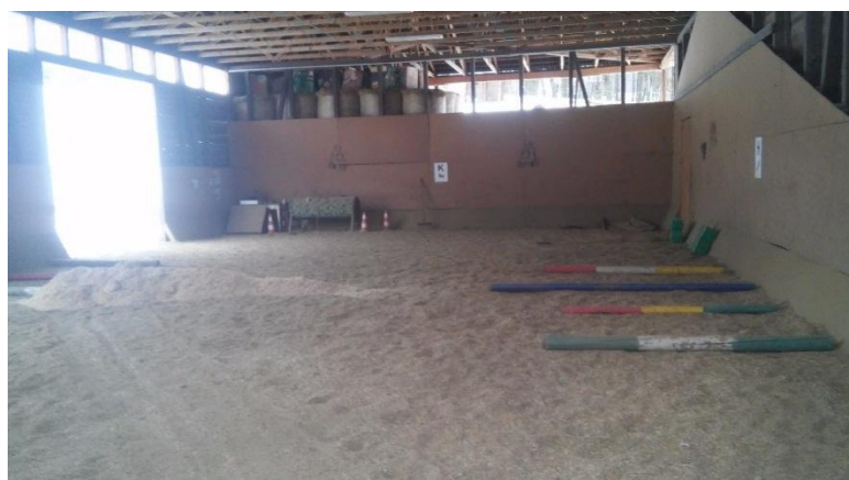
Obrázek 9. Krytá jízdárna