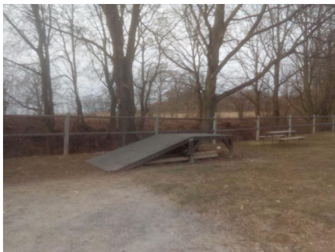
Obrázek 10. Nájezdová rampa