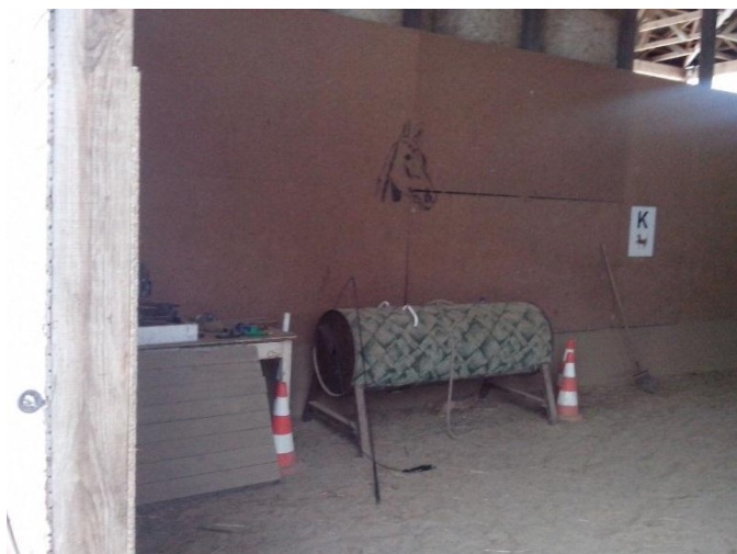
Obrázek 6. Nacvičovací kůň Cyril