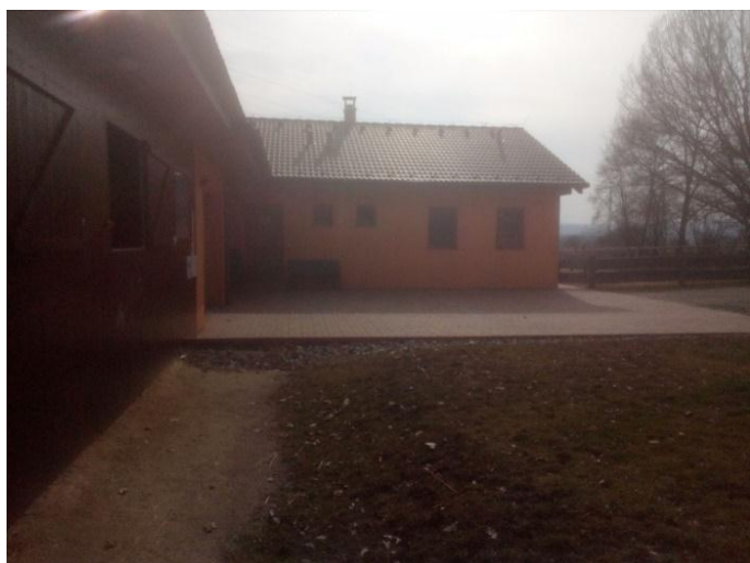
Obrázek 12. Bezbariérový přístup do stáje