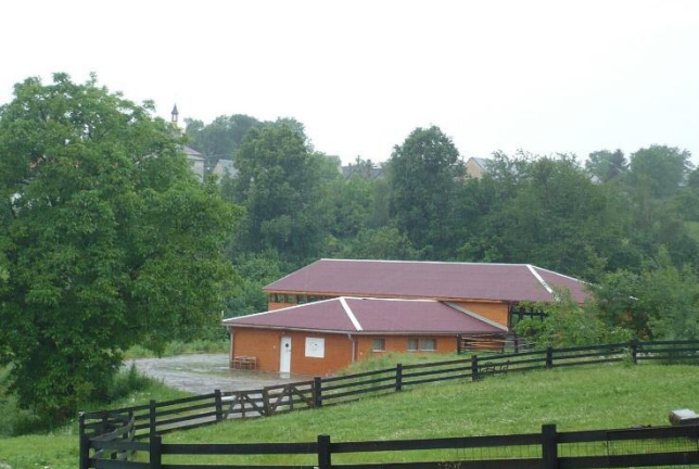
Obrázek 8. Centrum Ryzáček