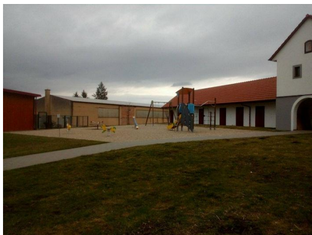
Obrázek 15. bezbariérové dětské hřiště