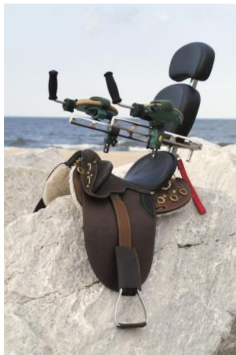
Obrázek 5. Paraanglické sedlo s modifikací ( www.farmshow.com )