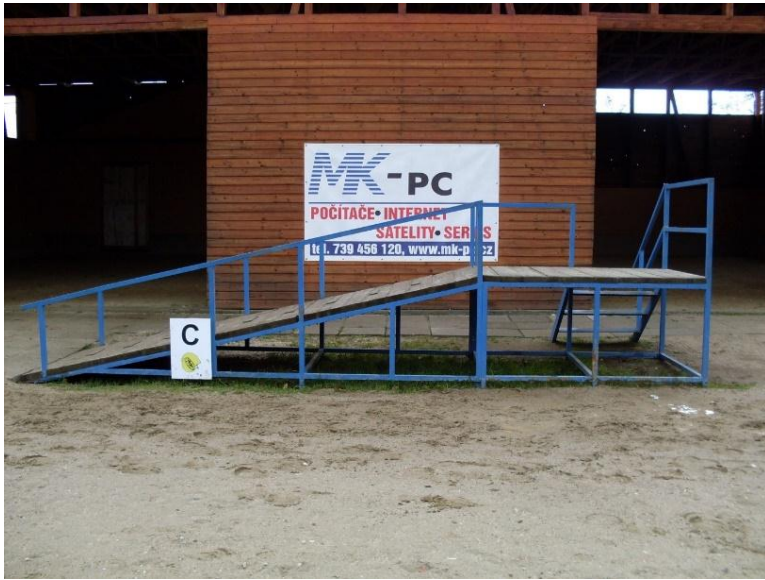
Obrázek 1. (nájezdová rampa)