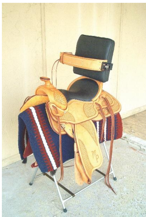
Obrázek 4. parawesternové sedlo s modifikací ( www.grayscustomsaddlery.com )

Za zmínku stojí určitě výběr, některých pomůcek k parajezdectví, aby mohl jezdec na koni bezpečně jezdit. Používají se různá sedla s opěrkami a vázáním. Například zajímavé jsou sedla s různou modifikací například parawesternové (obr.4) na nichž klient může vyjet i do přírody, nebo paraanglické sedlo (obr. 5).