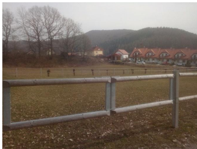
Obrázek 13. Ohrazená jízdárna