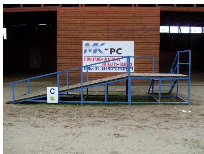
Obrázek 7. Nájezdová rampa