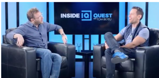
Obrázek 7: Simon Sinek přejíždí rukama po křesle, Projev 1

Sinek dotváří smysl výpovědi tónem hlasu a gesty. Když říká „Heyyy.“, tak je jeho hlas najednou vyšší a také slovo protáhne. Prsty přejíždí po křesle a dokresluje tak trapnost pozdravu při romantické schůzce.