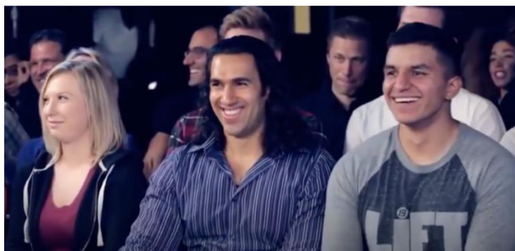
Obrázek 2: publikum, Projev 1