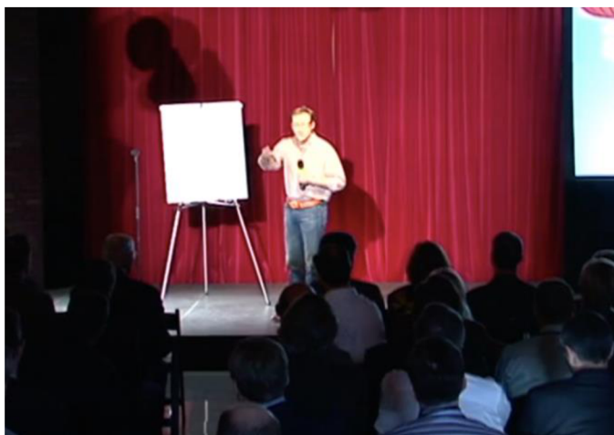
Obrázek 5: Simon Sinek ukazuje na posluchače, Projev 2

Sinek opět mluví o vlastním vnímání světa a zaujímá subjektivní stanovisko, používá zájmena 1. osoby jednotného čísla: „ About three and a half years ago, I made a discovery. And this discovery profoundly changed my view on how I thought the world worked, and it even profoundly changed the way in which I operate in it. ”