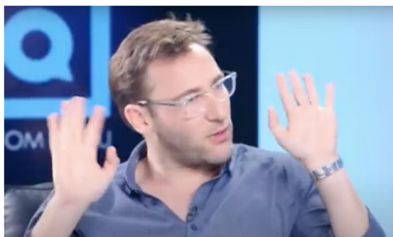
Obrázek 8: Simon Sinek zvedá ruce před sebe, Projev 1

Sinek používá oční kontakt a pohyby rukou pro doplnění smyslu svojí promluvy. Když řekne „ You go.. “, tak se střídavě dívá na stůl na pomyslný telefon a na moderátora. Poté před sebe zvedne ruce.