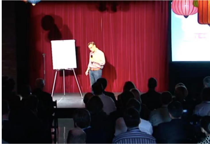
Obrázek 3: Simon Sinek na pódiu, Projev 2