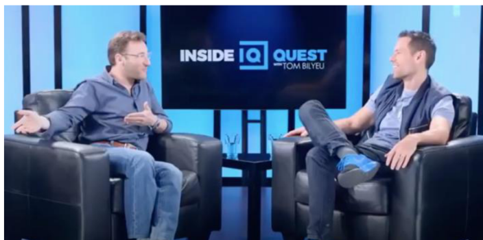
Obrázek 6: Simon Sinek ukazuje na pomyslnou skříňku s alkoholem, Projev 1

Sinek nedokončí výpověď, ale používá intonaci hlasu pro dotvoření smyslu výpovědi. Předvádí, jako že láká mladistvé na alkohol a nabízí ho.