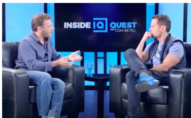
Obrázek 1: Simon Sinek a moderátor, Projev 1 13