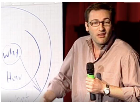
Obrázek 9: Simon Sinek krčí rameny, Projev 2

Sinek dotváří význam citoslovce „ meh “ mimikou tváře a pokrčením ramen, jak ukazuje Obrázek 9. Někteří tlumočníci ve své promluvě zohledňují nonverbální prvky, například Tlumočník 1 místo „ meh “ říká „ asi ne “, navíc vloženou přímou řeč uvozuje pomocí „ vy byste si řekli “. Tlumočník 4 nahrazuje citoslovce „ meh “ slovem „ možná “, navíc před ním udělá pauzu. Tlumočník 2 Sinekovu nonverbální komunikaci nijak nepopisuje ani neuvozuje druhou promluvu. Nemění intonaci a nejde poznat, že se jedná o odpověď na otázku, slovo „ no “ působí spíše rušivě. Tlumočník 5, 6 a 7 „ meh “ vypustili a nijak nezprostředkovávají Sinekův body language.